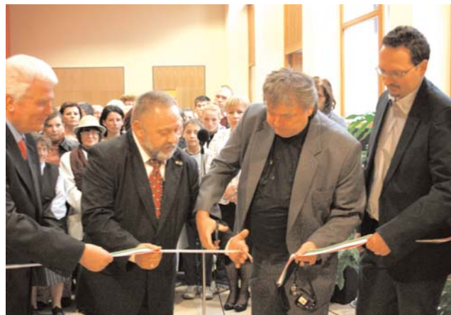
A szalagátvágás pillanata az óvodában