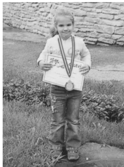
Az óvodás gyerekek és a dolgozók