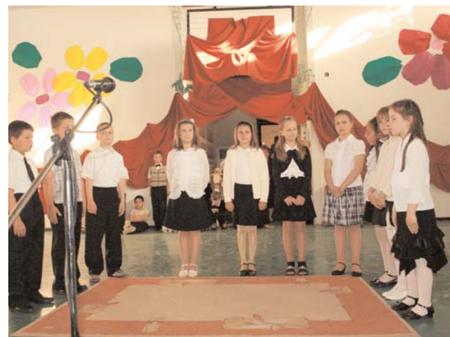
Két kép az Iskola gáláról