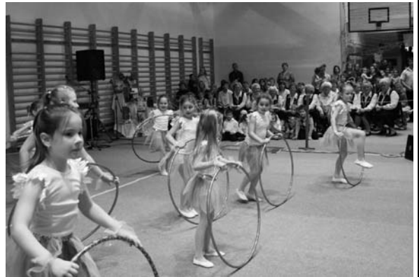
Répa-mese a Méhecske csoport előadása (bal alsó kép) Sunflowers - apróságok (jobb felső kép)