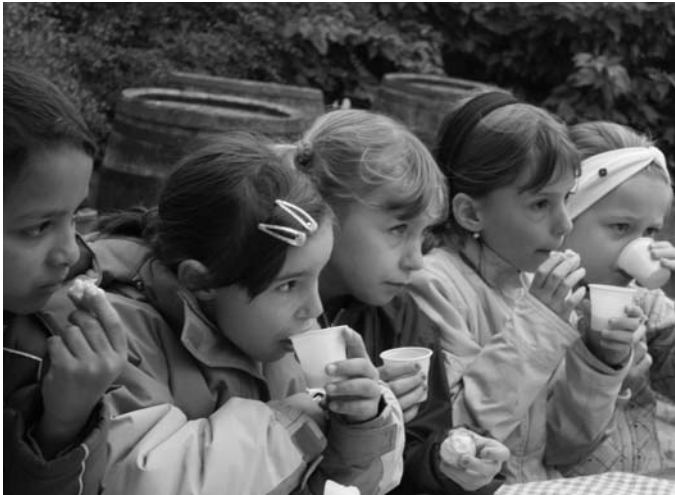
Finom ez a must!