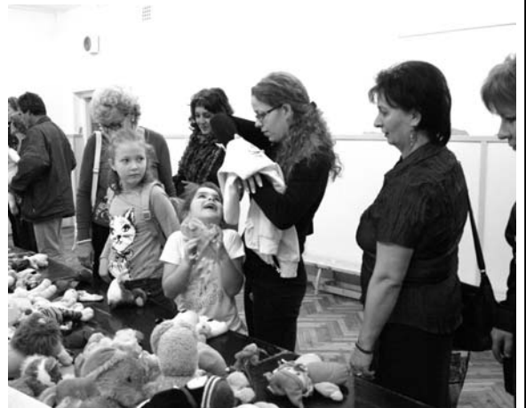
Bolhapiac - szemlélődők