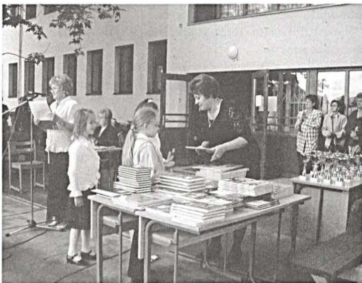
Fenti képünkön a tanulók átveszik jól megérdemelt könyv jutalmaikat.