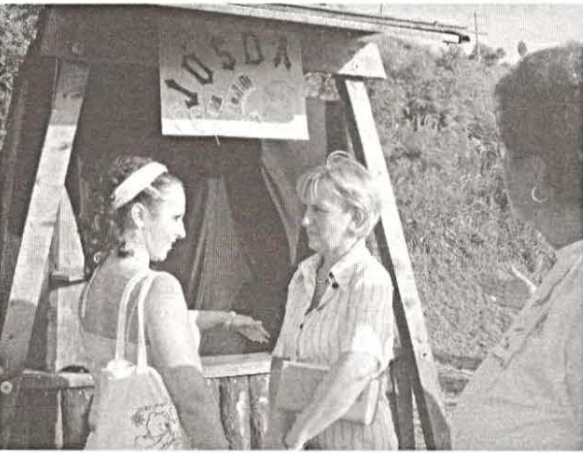
Vajon mit hoz a jövő?