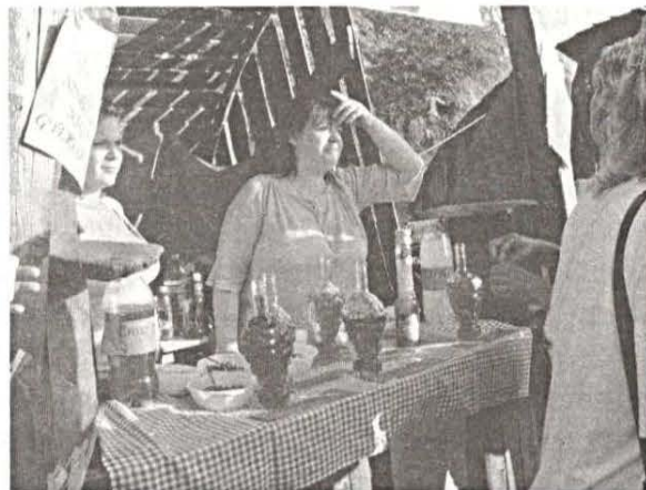
Bájjalok és receptek sokasága várta a bódulni vágyót.