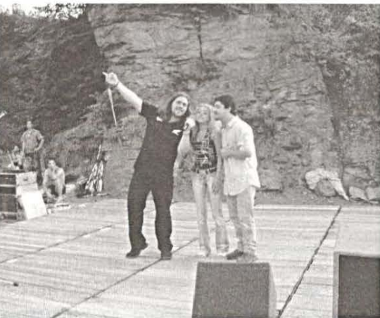
Szerelmes dalok a szerelmesek éjszakáján a Premier színház művészeinek előadásában.