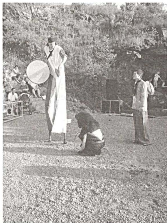
Linyáék Gólyalábas komédiája hazai szereplőkkel.