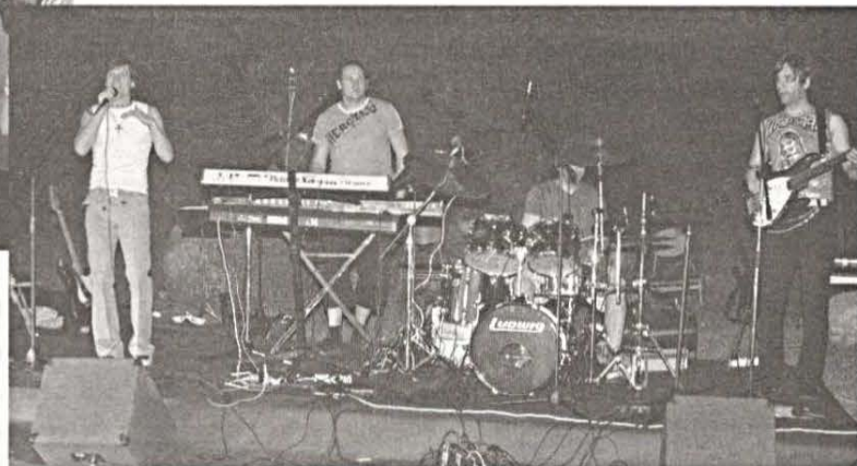
Színpadon az UNITED.