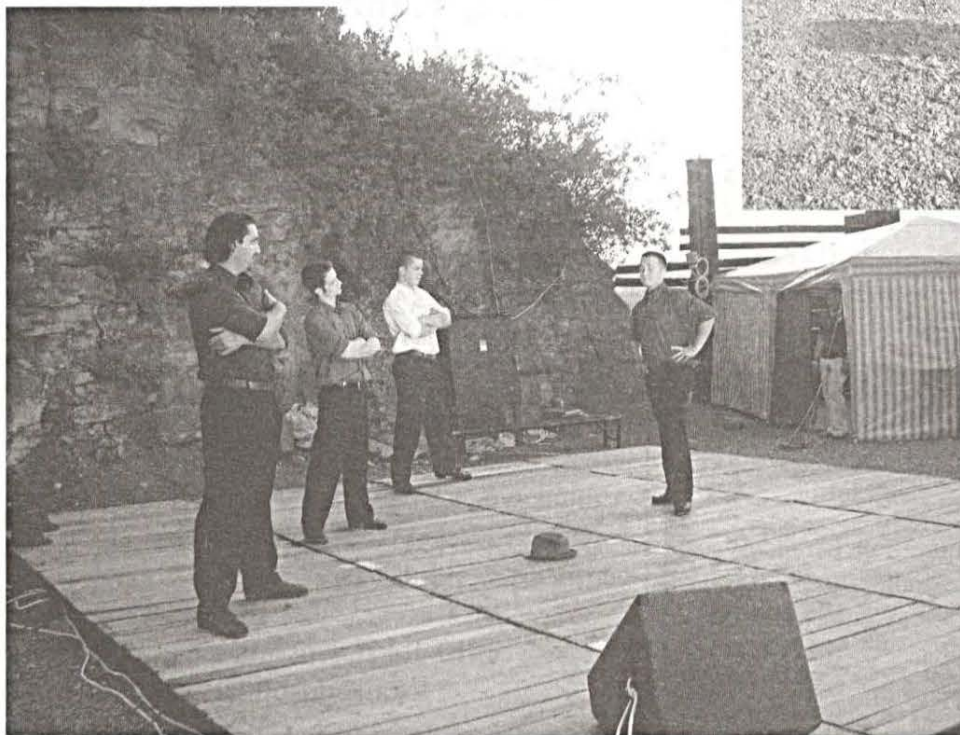
Four For Dance - népi motívumok modern köntösben.