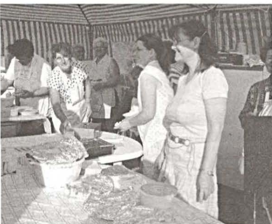
Készülnek a finomságok az "Örökifjak" ügyes kezei alatt.