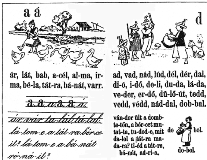
Egy régi ábécéskönyvből