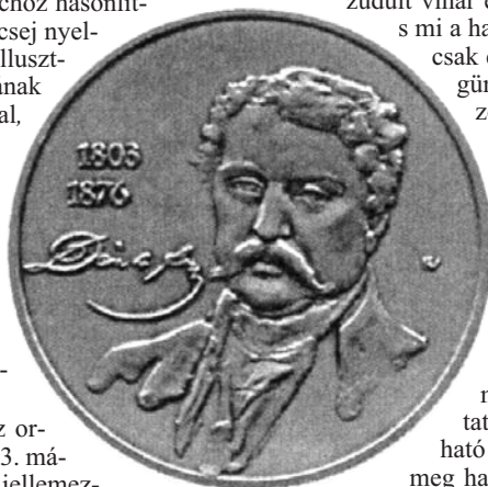
Füz Veronika ezüstérem-tervezete