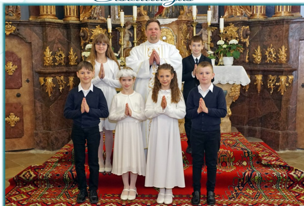
Márkó 2023. május 7.