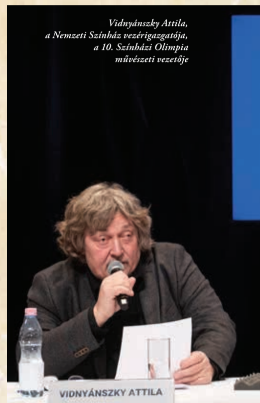
Vidnyánszky Attila, a Nemzeti Színház vezérigazgatója, a 10. Színházi Olimpia művészeti vezetője