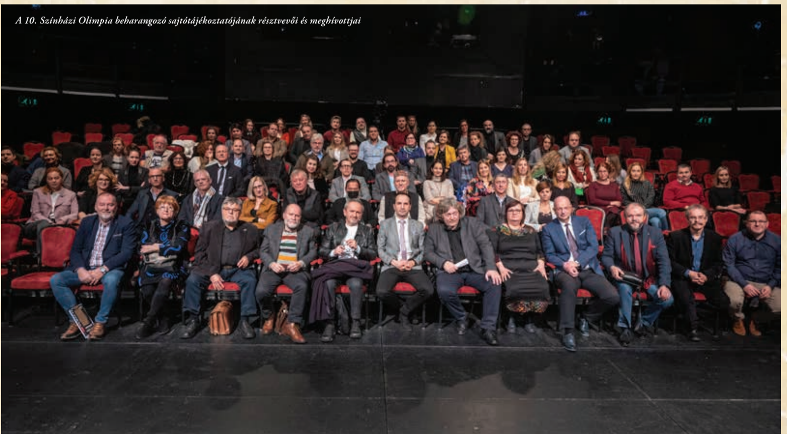
A 10. Színházi Olimpia beharangozó sajtótájékoztatójának résztvevői és meghívottjai