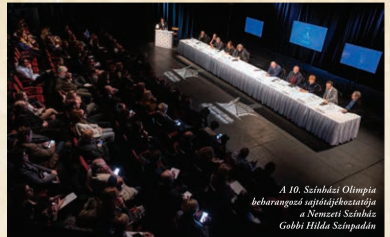
A 10. Színházi Olimpia beharangozó sajtótájékoztatója a Nemzeti Színház Gobbi Hilda Színpadán