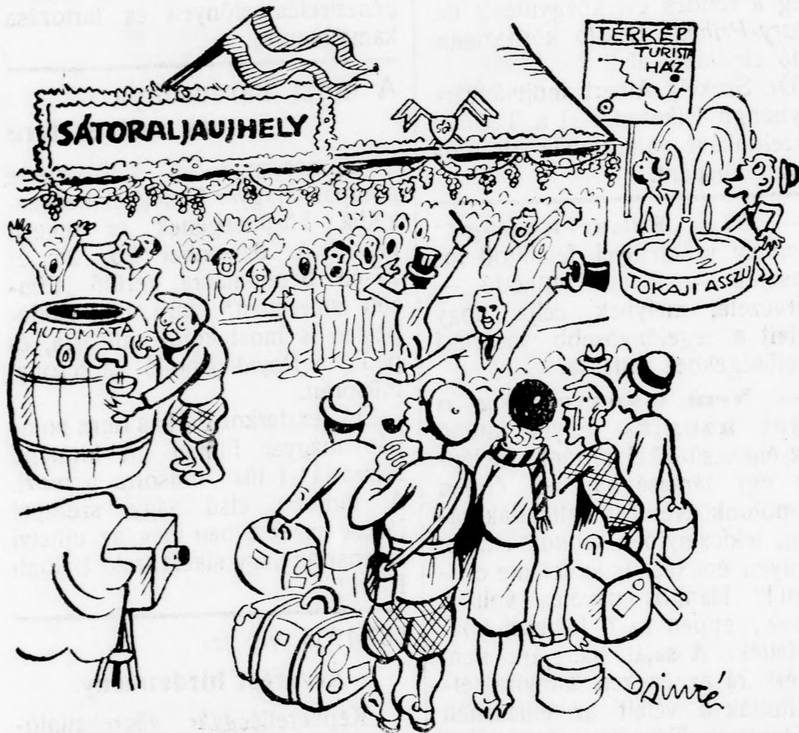
(Pintér Jenő rajza a Zemplén számára)

A megérkezett külföldi ujságíróknak azonnal szembetűnt a Hegyalja képeire stilizált állomási peron és a hatalmas hordóautomatáknál rögtön megkezdődött a kóstoló. Megcsodálták az ujságírók a peron tetejére felfutó szőlőindákat és a csinos üvegszekrényekben elhelyezett, értékes tartalmu pókhálós üvegeket.