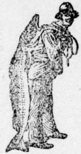
Az Emulsió vásárlásánál a SCOTT-féle módszer védelmét — a halászt — kérjük figyelembe venni.

Ugyan adjatok a szenvedőnek SCOTT-féle Emulsiót és kiméjletek meg álmatlan éjszakától. A fogak minden fájdalom és béibaj nélkül bujnak elő, fehérek, erősek és egyenesek lesznek