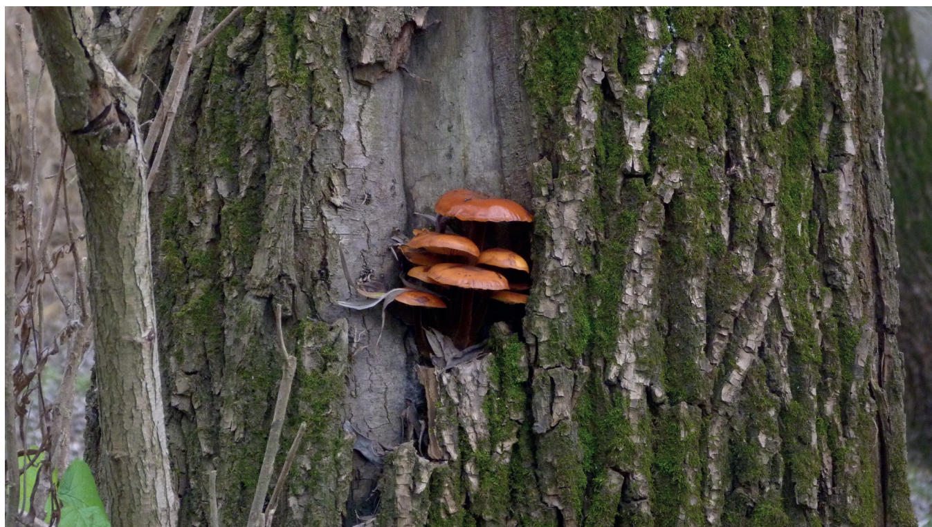
Téli fülőke

A "Hónap képe" rovatunk minden év januárjában gazdát cserél. Az idei lapszámokban Bodó Luca fotóit láthatják.