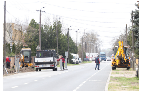
Elkezdődött a csapadékvíz elvezető rendszer kiépítése a főutcán

Áldott Húsvétot kívánok Ásotthalom minden polgárának!