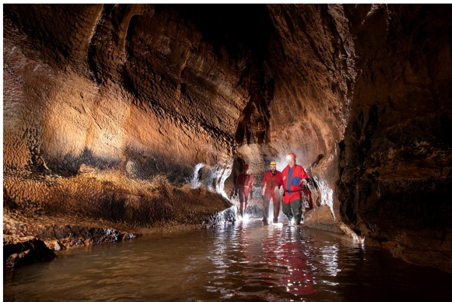
Bejárás és fotódokumentáció történt a Somodi-barlangban.

töbörben nyílik a Murikova-barlangal a Szilicei-fennsíkon. Mindkét barlangban régészeti leleteket találtak, ezért a szlovák nemzeti kincshez tartoznak. A tábor alatt elkészült a Krumpis-barlang (Ponor pri zemiačisku) felmérése alaprajzi és hosszsz metszeti nézetben, itt végponti szűkület-tágítási munkálatok is zajlottak.