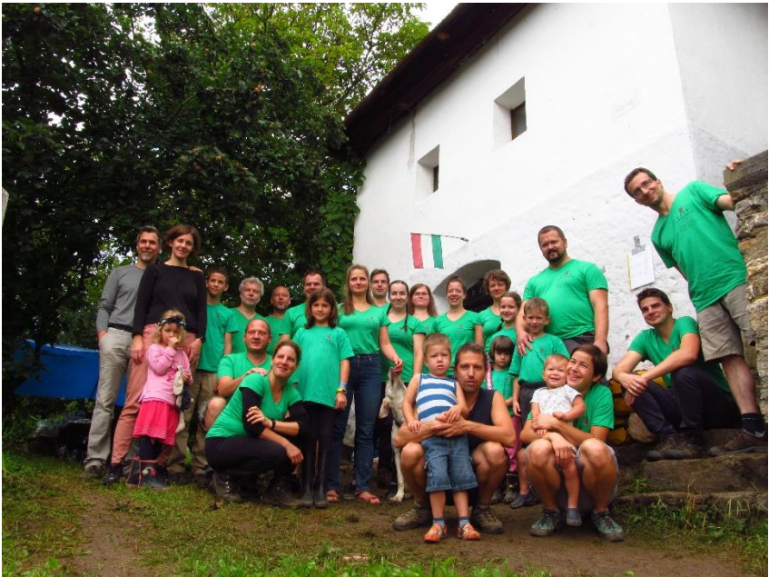
A PF feltáró csapata