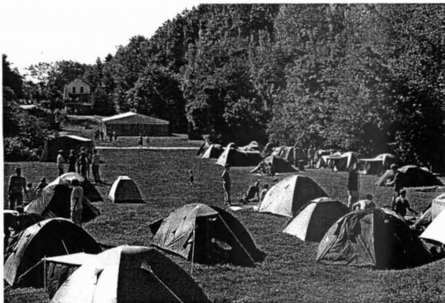
Barlangnapi tábor a Pál-völgyi kőfejtőben

hegyi-, Pál-völgyi-barlang /nagy kör, jubileumi/, Solymári-ördöglyuk, Szemlő-hegyi-barlang, valamint Pál-Mátyás átmenő) és 1 felszíni (Gellért-hegyi barlangok) túrán résztvevők száma meghaladta a 260 főt, valamint 2 bűváltúrán 5 fő merült a Molnár János-barlangban.