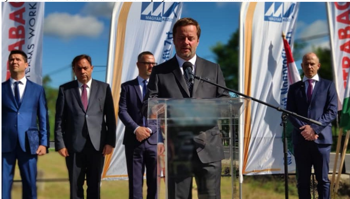
A 32-es főút alattyáni szakaszának ünnepélyes átadása

Magyar Falu Program támogatásával, közel bruttó 400 millió forint hazai forrás felhasználásával befejeződött a 32-es számú Hatvan – Szolnok másodrendű főút Alattyán belterületi szakaszának felújítása. A felújított útszakasz 2020. 09. -án került ünnepélyes keretek között átadásra.