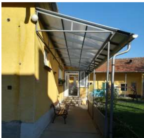
Mozgáskorlátozottak részére is alkalmas bejárat kialakítása...