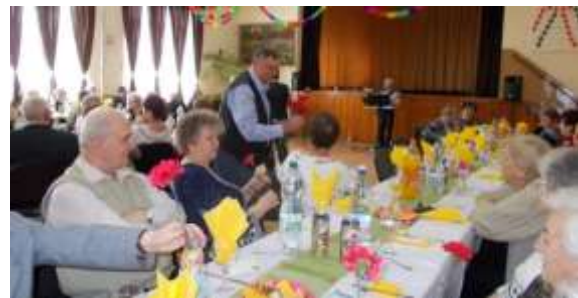
Nőnap i rendezvény a művelődési házban