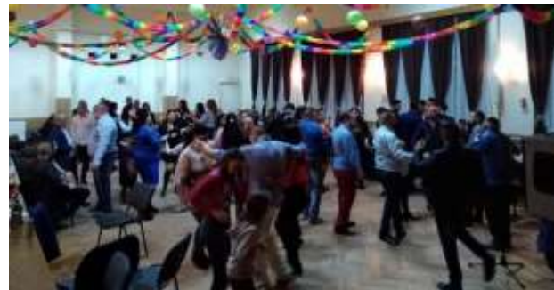
A farsangi mulatság képei