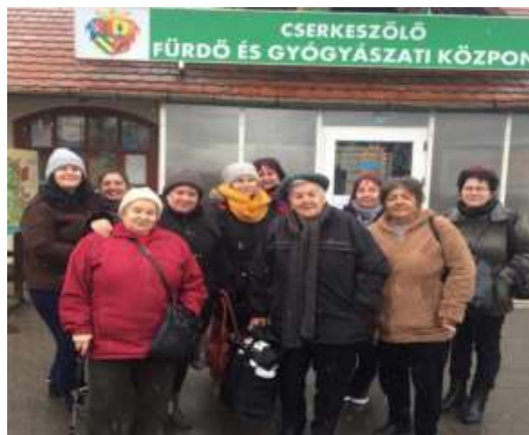
Cserkeszölői fürdőzők csapata