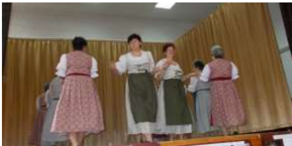
Táncos lábú mamik fellépése