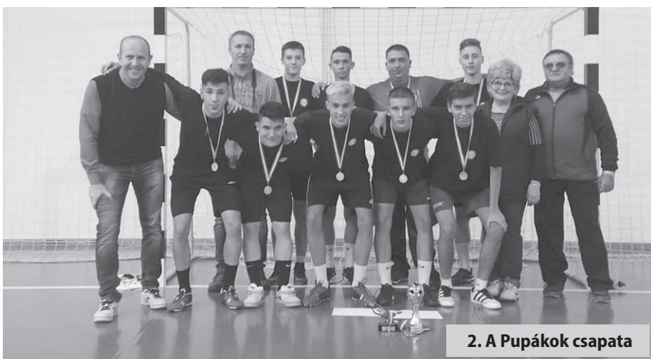
2. A Pupákok csapata