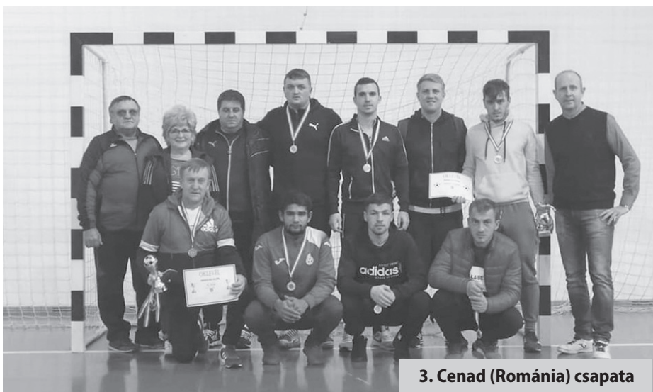
3. Cenad (Románia) csapata