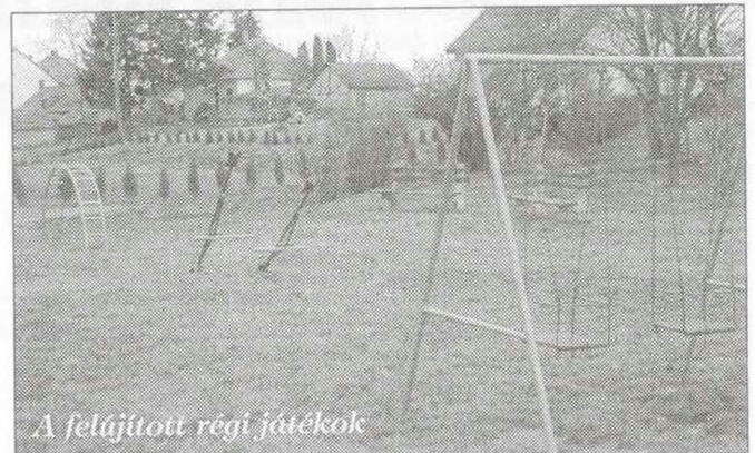
A felújított régi játékok