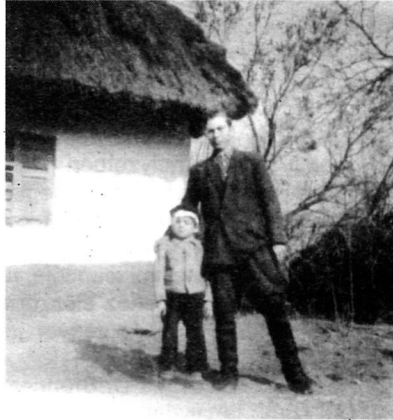
Ilyen zsuppos házak égtek le akkor