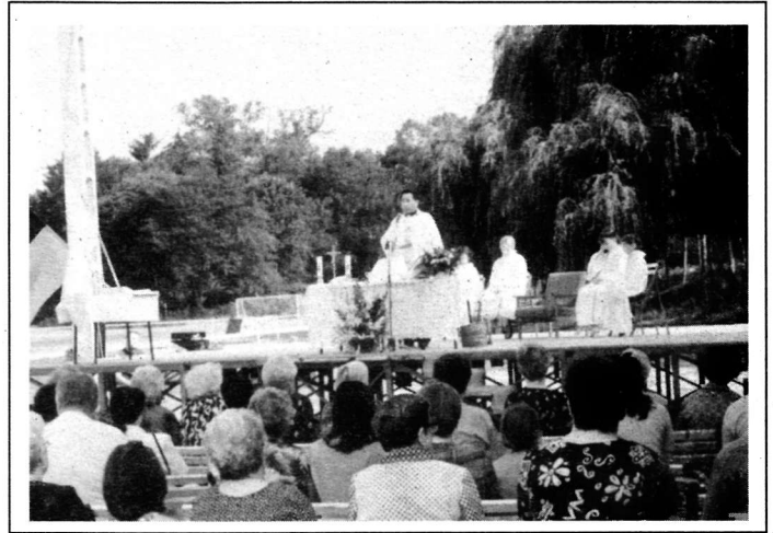
Tábori mise a Falunapon