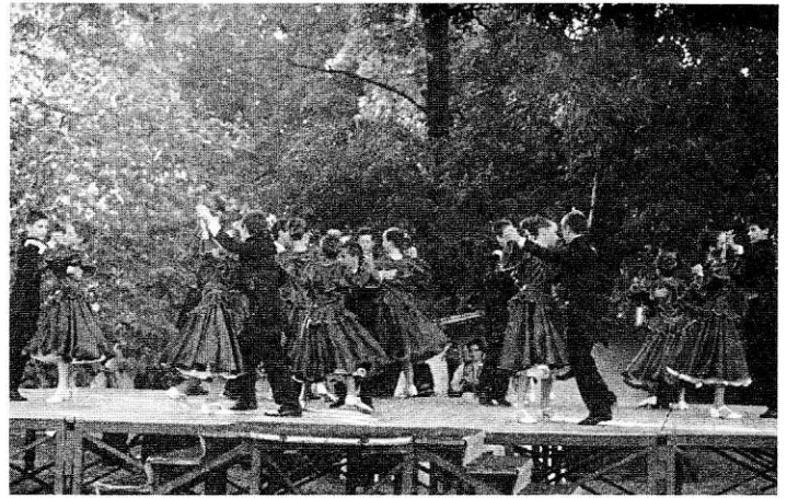
One-Step együttes táncbemutatója