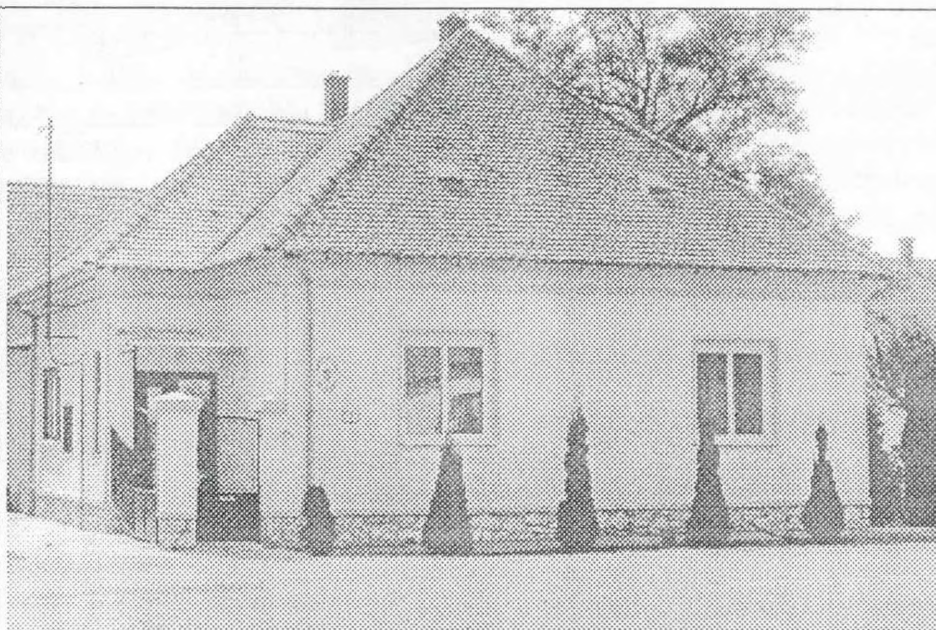
Megújult külsővel várja orvosi rendelő a betegeket Vasszécsenyben.

Az 1753-54-ben épült lipárti templomon nagyobb javításokat utoljára 1925-26-ban végeztek, amikor a tetőszerkezet cseréjére került sor. Azóta eljárt az idő az épület felett, ezért a mostani felújítás szükségessé vált. Az épület rekonstrukciójának befejezése után ismét régi pompájában láthatjuk.