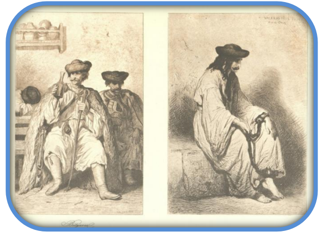
Théodore Valerio: Betyárok a kocsmában és a börtönben 3 (1853)

A valóságban a betyárok élete nem volt mesészerű. Egyesek a házak oldalát kiásva lopták el az élelmet, mások elhajtották a marhákat, ellopták a lovakat, útonálló zsványok voltak, sokuk még gyilkolt is. Leginkább kisebb bandákba verődve raboltak, garázdálkodtak, nagy területeket jártak be, több vármegyében vagy egyeseket országosan is körözték. Álnév, illetve gúnynev rejtegette valódi személyazonosságukat, azonban pár év alatt elfogták őket, és börtönbe kerültek vagy kivégezték őket.