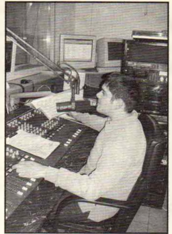
Munkájuk során rengeteg szeretetet kapnak

A Magyar Tudományos Akadémián volt egy értekezés, amelyre meghívtak engem is. Itt ugyanezt kérdezte az Amerikai