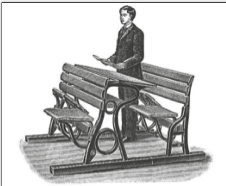
Abb. 2. Schulbank. Aus: Gamper, M. Die Entwicklung des Schularztwesens . Wien, 2002, S. 32.

In Ungarn und auch in Österreich wurde die Tatsache immer mehr allgemein anerkannt, dass eine gute Schule, die sowohl auf die geistige Erziehung als auch auf die körperliche Erziehung achtet, die Garantie einer gesunden zukünftigen Generation ist. Dafür setzten sich die pädagogischen Reformbewegungen ein. Es ist möglich, dass nach der Jahrhundertwende mit den neuen Schulgebäuden und den sich verbreitenden gesundheitswesentlichen Kenntnissen die Vorsichtsmaßnahmen für die Schulhygiene allgemein verbreitet waren, weil sich in den Spalten des Blattes nach dem Jahrhundertwende mit dem Thema nur wenig beschäftigt wird.