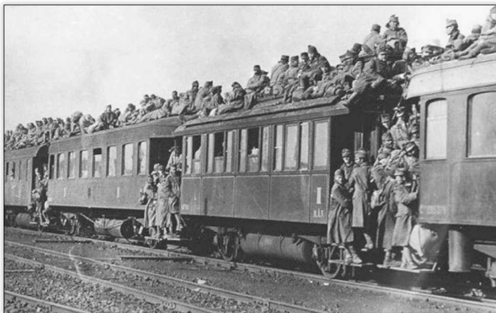
3. kép: A frontról hazatérő magyar katonák 1918-ban 76

Végül szeretném kiemelni Jankovich Bélának a háborús évek iskolái érdekében folytatott munkásságát. 1917. június 15-éig töltötte be a vallás- és közoktatásügyi miniszteri tisztséget. A Tisza-kormány lemondása után Jankovich saját maga kérelmezte felmentését az állásából. Gróf Tisza István a következőket nyilatkozta Jankovich felmentését követően a levelében: „...és Önnek ezen alkalomból hű és kitűnő szolgálatainak és különösen a háború folyamán kifejtett rendkívüli tevékenysége elismeréséül Lipót-rendem nagykeresztjét díjmentesen adományozom.” 75