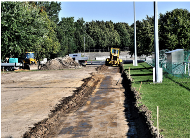
Megújul a Sport utca. Hogy ne a víz legyen az úr

■ Ajka Város Önkormányzata a 2020-ban elkezdte és 2022-ben befejezi a Sport utcai csapadékvíz elvezető rendszer felújítását, valamint az érintett területen parkolók kialakítását. A beruházás - amihez sajnos nem kapott pályázati támogatást a város - előkészítéseként indult el az elmúlt időszakban a bányáspályán található edzőpályával párhuzamosan húzódó fasor kivágása, ami a tervezett csatornahálózat nyomvonalába esik. A kivitelezési munkák kezdetét azonban anyagbeszerzési gondok is hátráltatják.