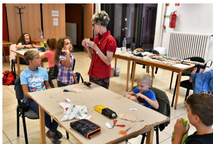
A gyerekeket minden érdekelte. A pásztorkultúra is szóba került