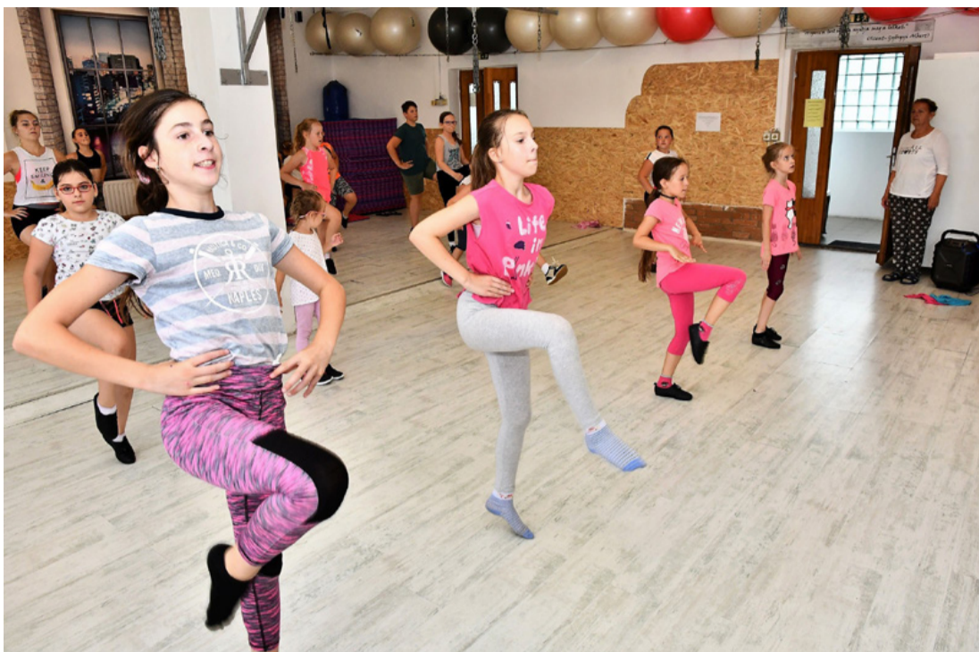
Végre csapatban gyakorolhattak. Szeptemberben indul a verseny