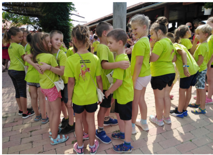
A kicsinyek öleléssel búcsúztak egymástól és az óvodától. Az első ballagás

A csoport tagjai bemutatták a szülőknek és a nagyszülőknek azt, hogy milyen tudással indulnak az iskolába. Énekeltek a farsangról, verset mondtak a természetéről, az állatokról. A műsor végén minden ballagó tarisznyát kapott, mint a nagyok, benne óvodai emlékekkel, ceruzával, pénzzel és pogácsával. Az ünnepség lezárása után lementek tutajozni az egyforma bambis pólójukban, aztán szétszéledtek a szélrózsa minden irányába.