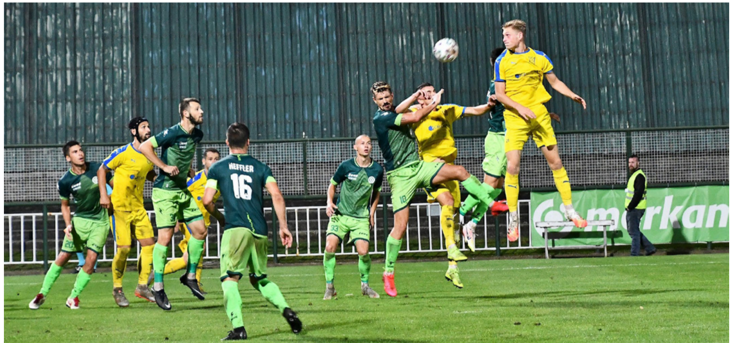
Légballet a Kazincbarcika elleni meccsen. Megtáncoltatták az FC Ajkát