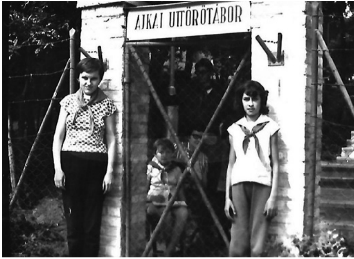
A kapuban állni felelősséggel járt. Ha valahol bezárul egy ajtó...

■ Úgy tűnik, hogy az 1964. június 21-én felavatott Ajka Város Úttörőtábor, a napjainkban Balatonszepezdi Ifjúsági Táboroként üzemelő létesítmény, gazdasági okok miatt eladásra kerül.