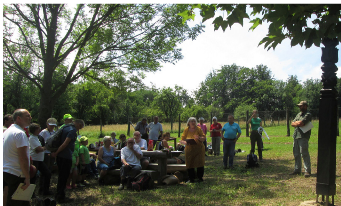
A megemlékezők egy csoportja. Virágokkal és koszorúkkal jöttek

A XIX. század elején került előtérbe erre felé a mezőgazdasági tevékenység. Az állattenyésztés és a földművelés váltotta fel az addigi erdőmunkálatoikat. A földek messze voltak a falutól, ezért nem lehetett naponta kijárni, hogy művelni tudják. A tulajdonosok kiköltöztek a földjeikre, télen pedig a faluban laktak. Ekkor kezdték építeni a tanyákat, amelyek már téli szállásra is alkalmasak voltak. Így a gazdát követték a családok is. Megtermelték az életük fenntartásához szükséges élelmiszereket. A munkáskéz is megvolt, hiszen egy-egy családban 4-5 gyerek született, akik hamar részt vettek minden munkában. A családok gyarapodtak és egyre igényesebb, udvarház jellegű épületeket emeltek.