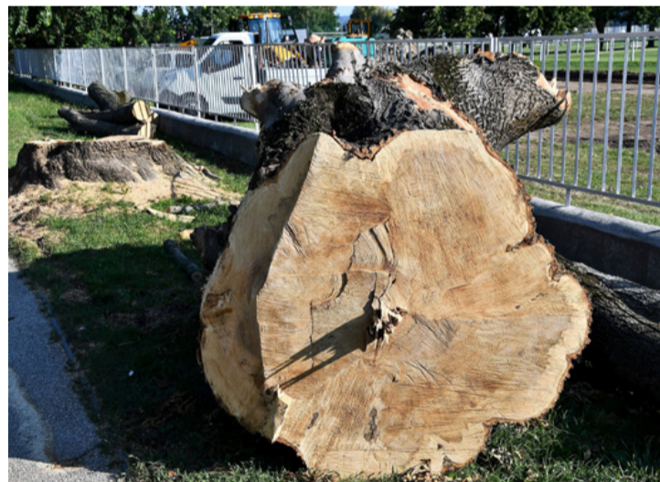
A kivágott fákat is hasznosítják. Ők is áldozatot hoztak