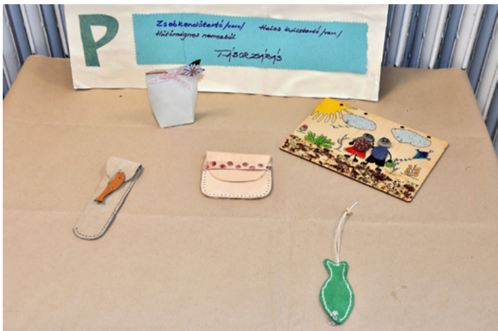
Ügyes gyermekkezek munkái. Nemezsből készült hűtőmágnes

■ Ajka Város Önkormányzatának „Humán közszolgáltatások fejlesztése Ajka térségében” című projektjének keretében valósult meg az ideai bőrműves tábor a Nagy László Városi Könyvtár és Szabadidő Központban. Július 27-től 31-ig a művelődési központ aulájában készültek a használati-és dísz tárgyak bőr és más természetes anyagok felhasználásával, hogy a gyerekek elmélyedhessenek az alkotófolyamatok során a rendelkezésre álló anyagok sokféleségében.