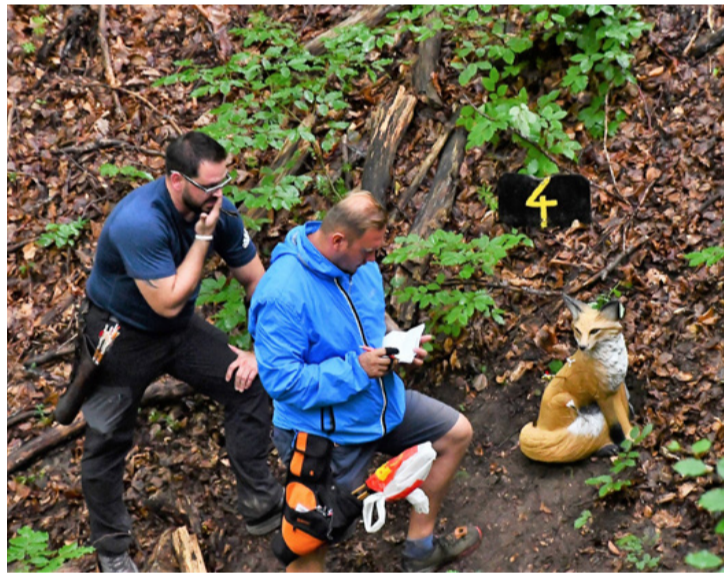
A legkisebb cél a róka volt. Telitalálat

íjat használtak. Az íjászatban, bár egyre népszerűbb sportág a nők körében is, még mindig a férfiak vannak többségben, az ajkai versenyen a résztvevők kétharmada is az erősebb nemhez tartozott. Az életkor vegyes volt, a 10-12