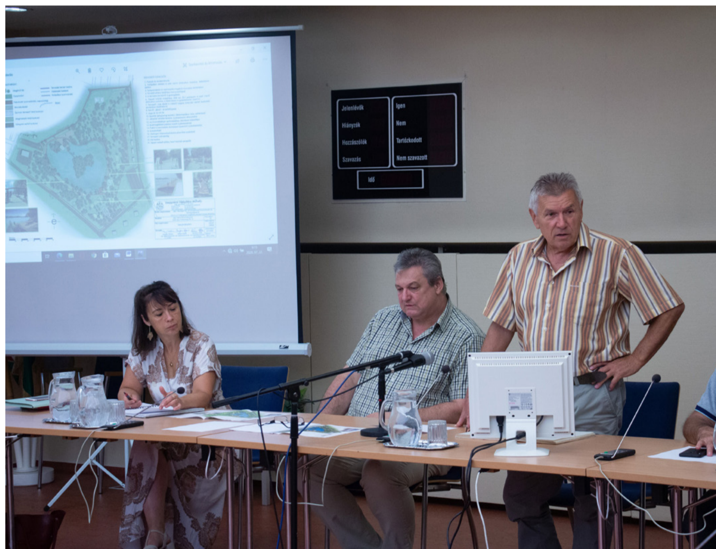
A városházán tanácskoztak a liget terveiről. Triatlon is lesz

A területen 41 nyárfa áll, amik már elég rossz állapotban vannak és balesetveszélyesek, megérették a kivágásra. A terület arculata ennek ellenére nem változik, a fásítást, a fiatal csemeték ültetését már elkezdték, és tovább folytatják. A területen megjelennek a nőiesség fő elemei, a gyermeket váró nő, az anya gyermekével és az érett nő. A téren kialakítják a kislánykorra utaló Csipkerózsika sétányt, terveznek meztelén ösvényt, a fiataloknak szerelem ösvényt, és szerelem kapuját, amelyre a