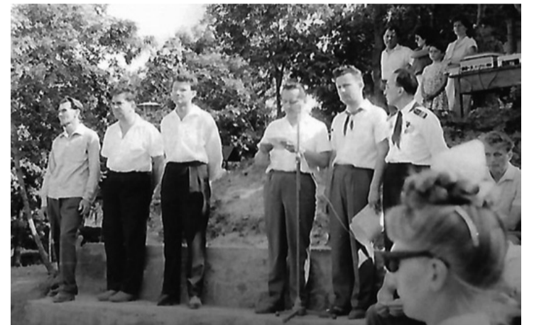
A tábor egykori vezetői egy megkopott képen. A nosztalgia marad