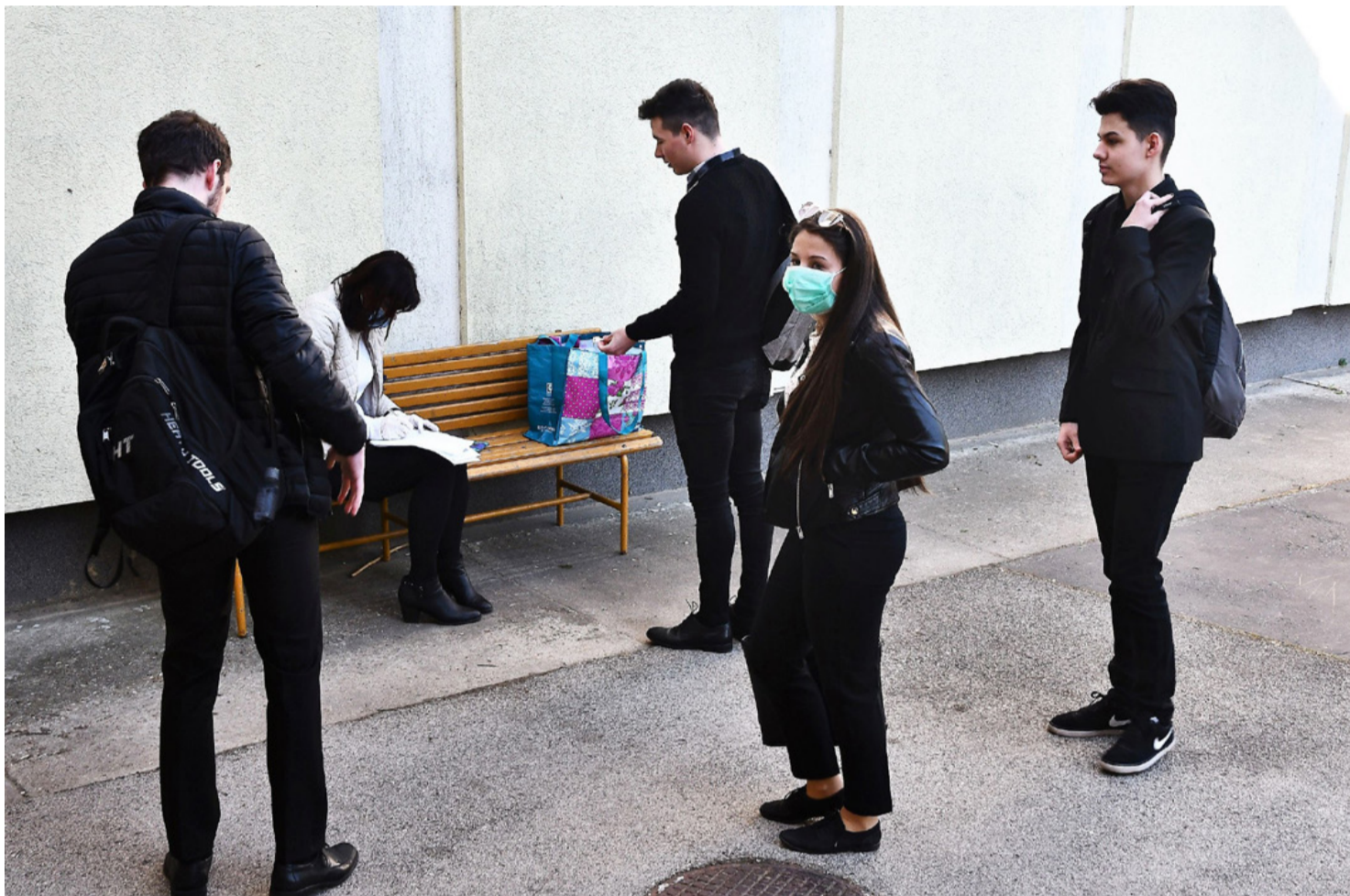
Volt, aki már az utcán magára vette