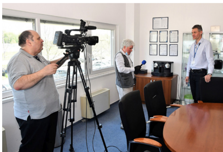
„Kettő az egyben”: Az Ajka TV is készített tudósítást a Payernél zajló vírusvédelmi folyamatokról