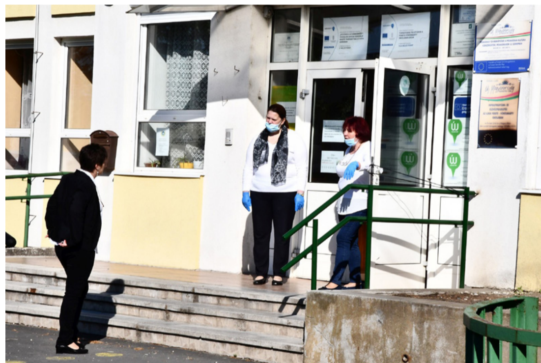
Szilárd kapuőrseg: ide a vírus be nem jöhet!