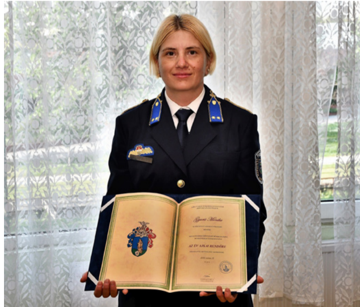
Az év ajkai rendőre a frissen átvett díszoklevéllel