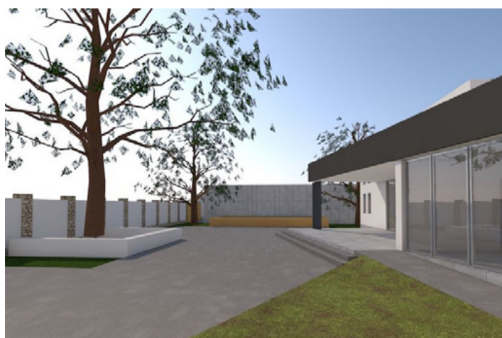
Ilyen lesz a belső udvar

az idősebbek nem értettek, de keresték rá a válaszokat. Abban nagy volt az egyetértés a tagok között, hogy a legfőbb cél a város népességmegtartó képességének az erősítése lehet, és ehhez kell több, a fiatalok helyben tartását segítő fejlesztés. A középiskolás korosztály meg is fogalmazta a saját elképzeléseit, amelyek központjában egy olyan intézmény létrehozására tettek javaslatot, ahol szabadide-