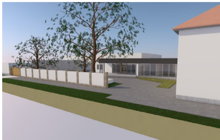
Végül senki nem fog ráismerni a régi Kaszinóra