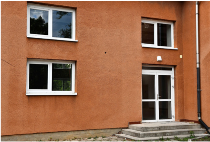
Új nyílászárók a Kaszinó épületén