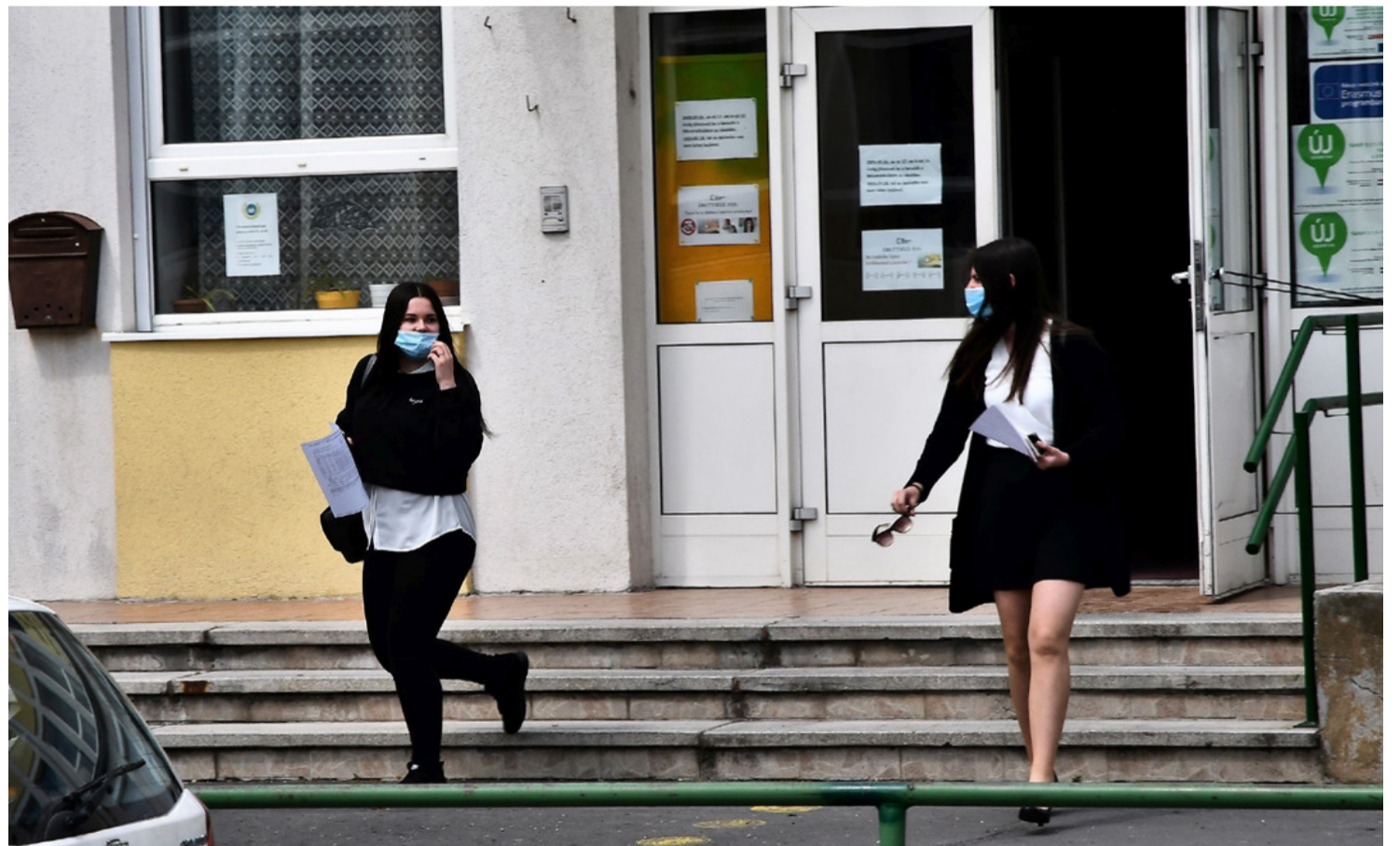
„Később dumcsizunk, jó”