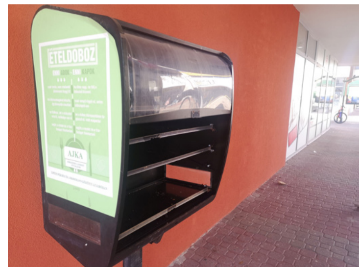
Kereslet és kínálat – Ételdoboz a belvárosban.