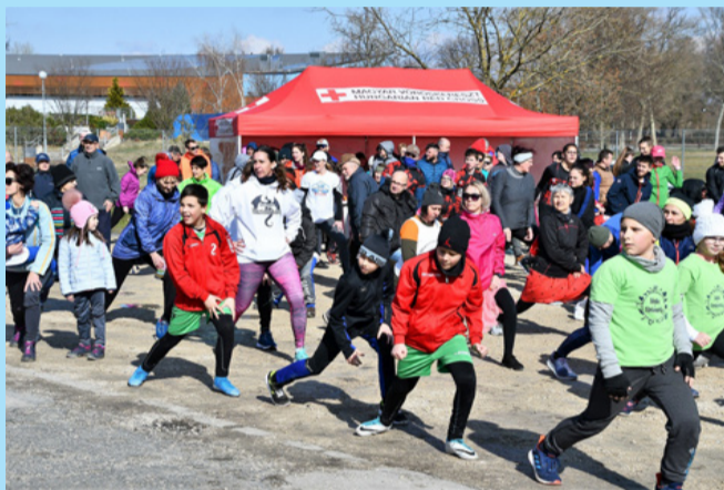
A bemelegítés elengedhetetlen része a futásnak

Több százan húztak futócipőt egy nemes ügy érdekében március 7-én. A Nőnap jótékonyági futás a Magyar Imre kórház dolgozóinak kezdeményezésére jött létre, az Intenzív osztály jobb betegellátásért. Az időjárás éppen nem volt futóbarát, de ez senkit sem gátolt meg abban, hogy csatlakozzon a résztvevőkhöz. A rendezvényen csaknem 300-an vettek részt. Volt aki gyermekével, és volt aki négy lábú kedvencével