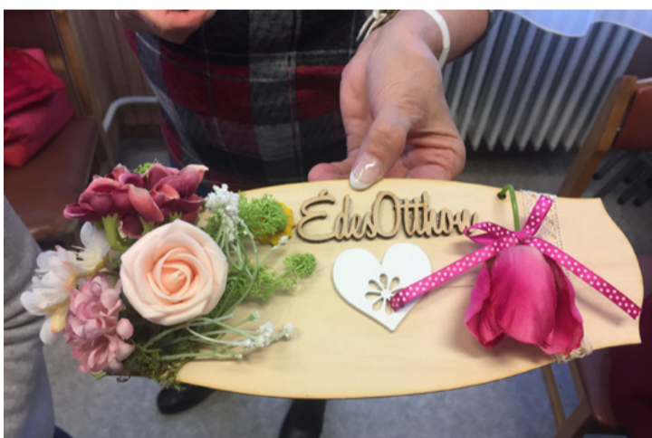
Az ajtókon kopogtat a tavasz