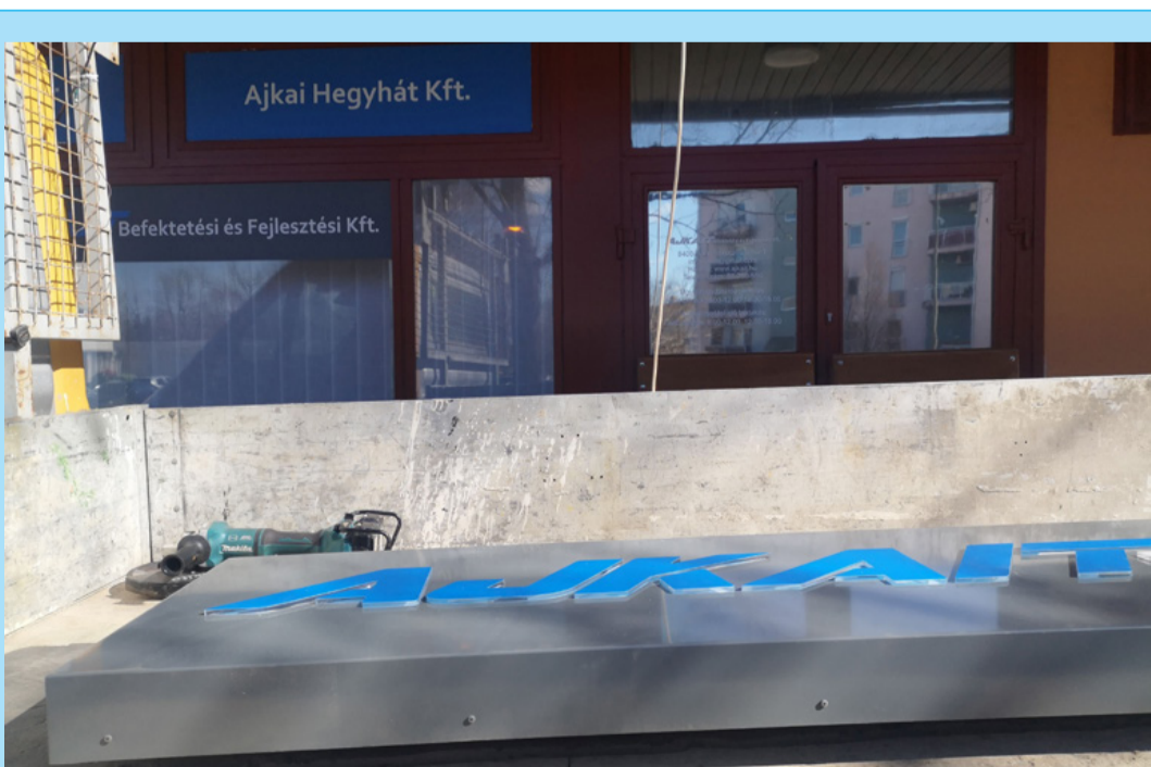
Új LED-es, vagyis energiatakarékos cégtáblát kapott az Ajkait Kft.

Ajkait Kft. 8400 Ajka, Rákóczi F. utca 8. fsz. 1.