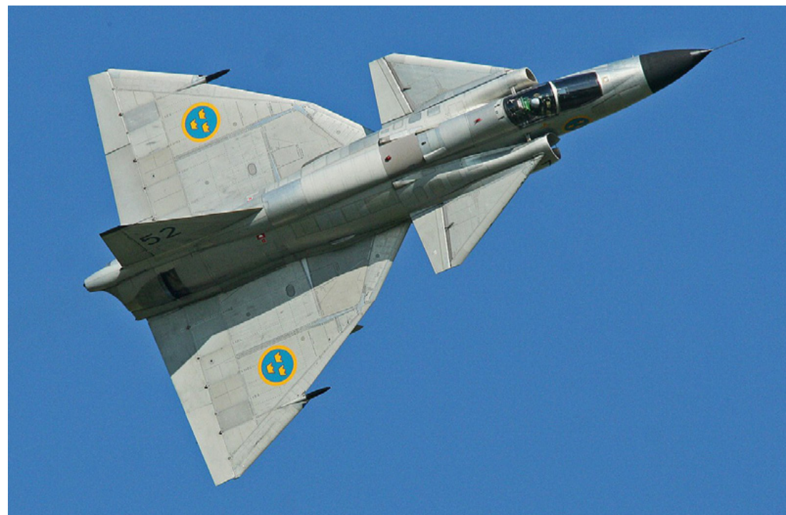
Egy Saab 37 Viggen – amit már kivontak a harcrendből – svéd gyártmányú egyháztóműves, rövid és közepes hatótávolságú vadászgép. Érdekessége, hogy a főszárnny előtt egy elülső sík (canard) is van.