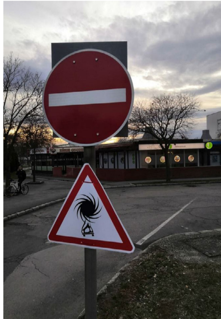
Egyes esetekben zavaró lehet - ha éppen nem törvénysértő - közlekedési táblának látszó tárgy kihelyezése egy szabályos tábla alá