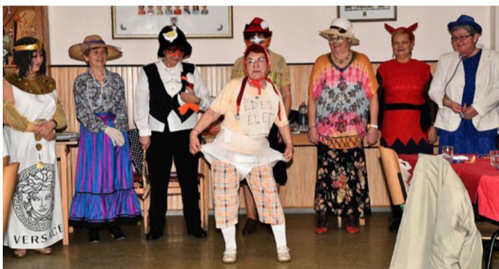
Ha farsang, akkor jelmezes verseny