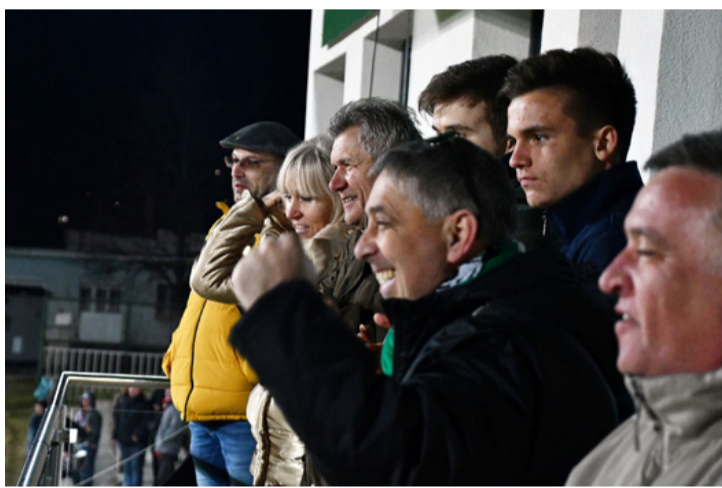
A díszpályában is nagy volt az öröm

■ Hazai pályán az éllovas MTK után a tabella második helyén szereplő Budafoki MTE csapatát is legyőzte az FC Ajka.