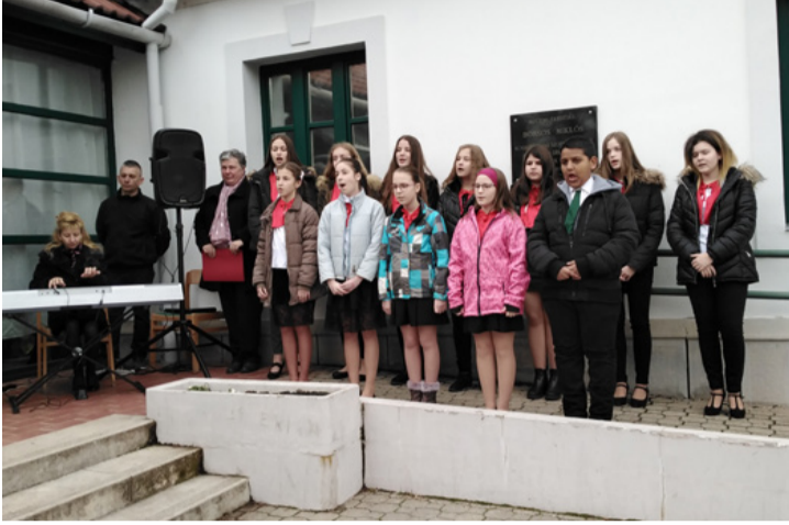
Az iskola mai hangadói