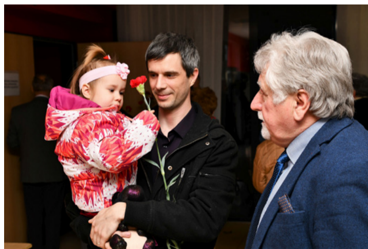
A Nőnap, az nőnap...