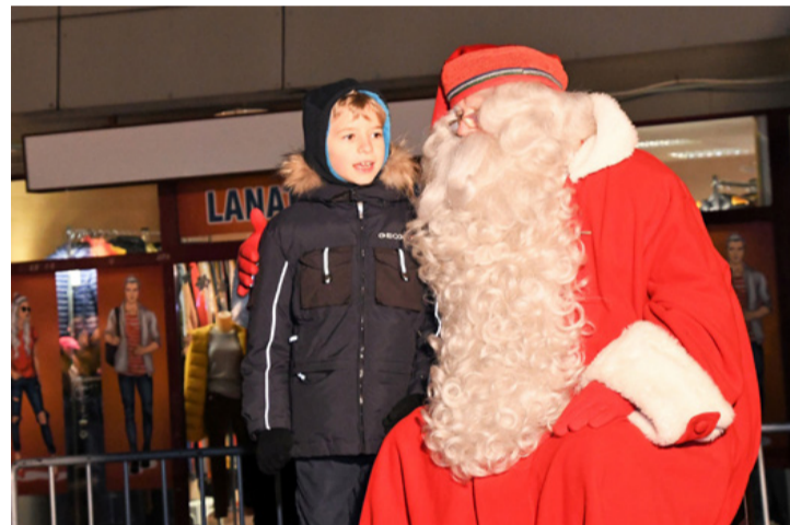
Nagyon várták a gyerekek, mert igenis létezik!

– Olvassatok sokat, de ne e-bookot, hanem papír alapú könyveket – javasolta a téren őt váró gyermekeknek Jou-