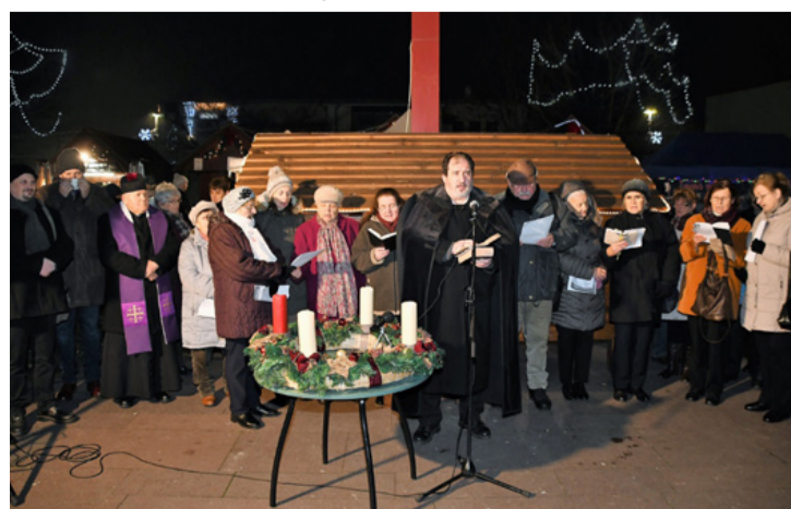
A második gyertya gyújtásánál is sokan voltak

Vannak mennyei kincsek és földi kincsek ebben az