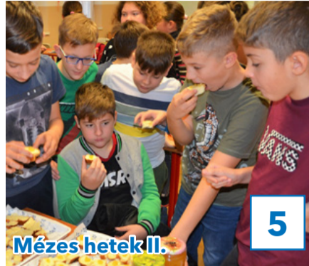
Mézes hetek II.