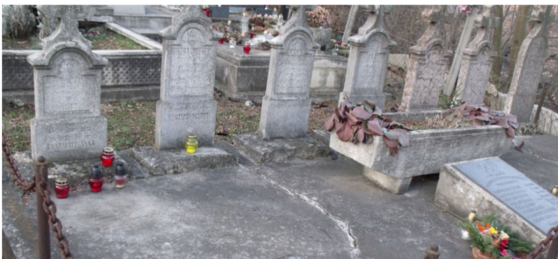
Bányászsirok a bódéi temetőben