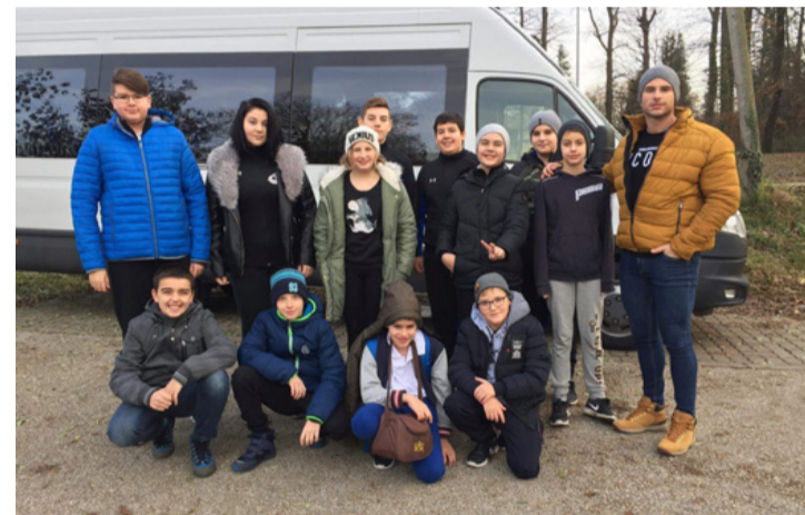
Ilyenek a Cápák szárazon

Külön öröm volt látni, hogy remekül helyt álltak a cserék. Ugyan volt hiányzónk a kezdőkeretből, de a többiek remekül helyettesíteni tudták csapattársukat. Ebben a bajnokságban (2006-ban születettek) először debütáltak a 2008-2009-ben született játékosaink, akik ráadásul már most több kialakított helyzetüket csak egy hajszálon múlt, hogy nem tudták gólokra váltani. Rendkívül büszkék vagyunk rájuk – fogalmazzuk az edzők. Jelezték, hogy a második mérkőzés, a Sopron ellen,