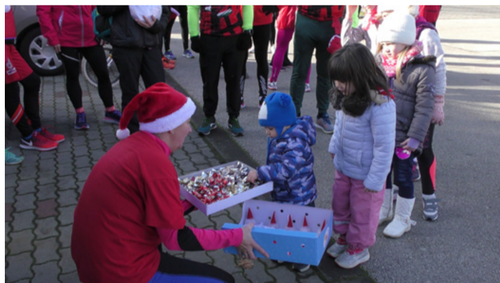
A fő cél, hogy a legkisebbek is felfigyeljenek az eseményre