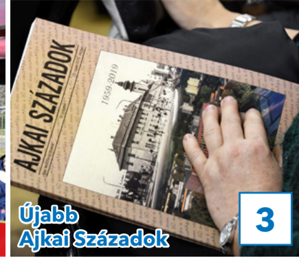
Újabb Ajkai Századok