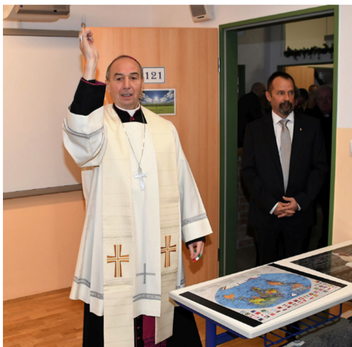
dr. Udvardy György Veszprémi Főegyházmegye érseke minden tantermet megáldott

Az igazgató örömet és hálafejtést fejezte ki, hogy az érsek atya megtisztelte az egyházmegye legfiatalabb, ugyanakkor legnagyobb fejlődést felmutató intézményét. A gyerekek és a pedagógusok nevében megköszönte az egyház veze-