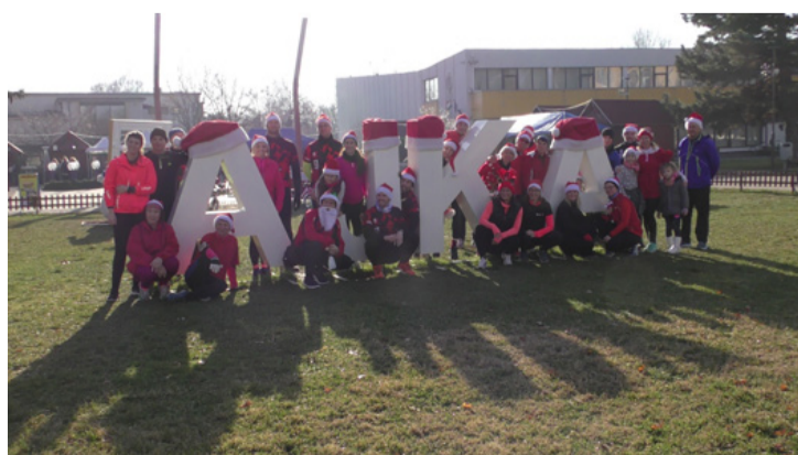
Egész Ajkát ellepték a TovaFutó Mikulások