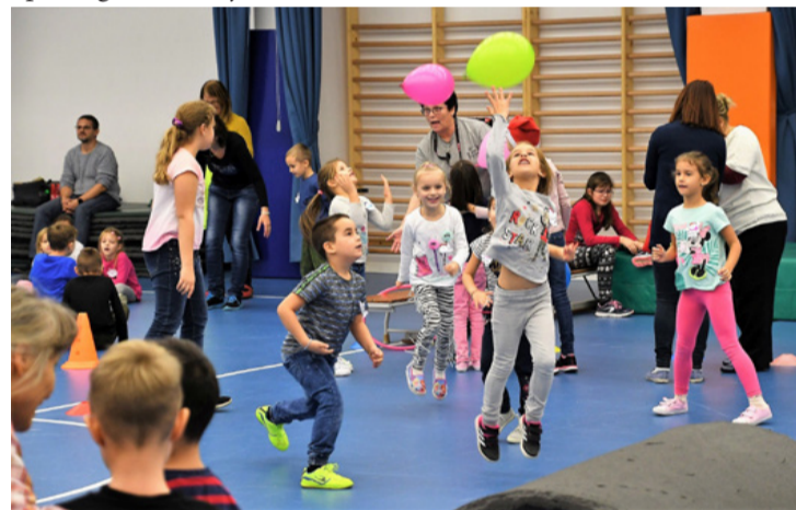
A játékban az ügyesség, a fürgeség, a találmányosság játszotta a főszerepet