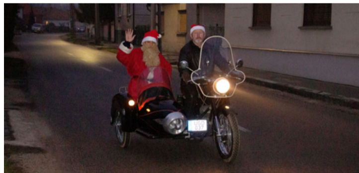
Ha nincs hó, praktikusabb egy oldalkocsis motorkerékpár