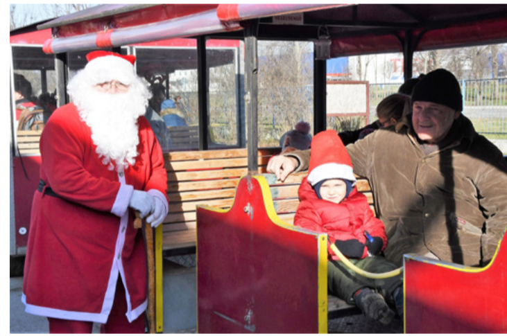
Napfény, vonat, Mikulás... kell ennél több?

Ötödik éve vonatozhattak a Mikulással az ajkai gyermekek. Az Ajka és Térsége Civil Szervezetek Szövetsége december 8-án tartotta a játszóházzal egybekötött Mikulás délelőtti Civil Házban. A vonat már a meghirdetett kezdés, 10 óra után pár perccel kigördült, hogy utazhassanak egy kört mindazok, akik korán érkeztek. A ház bejáratánál egy igazi szakállas Mikulás is várta a kicsiket. Az idén vagy a Mikulás takarékoskodott, vagy a gyerekek voltak nagyon jók, ugyanis mindenki szép nagy csoki mikulást kapott, hozzá egy-egy mandarint és egy szaloncukrot. Aki verset vagy mesét mondott, szintén kapott ajándékot a nagy és kitömött puttonyban. Aki a vonatra várt, vagy már túl volt az utazáson, a kézmű-