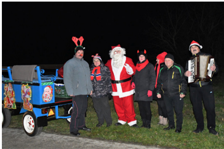
A „trakis Miki” és segítői

„Megjött a Mikulás itt van már, Tele van a puttony régen már, Jó gyerek, rossz gyerek mind tudja, Mit hoz a Mikulás a puttonyba.”