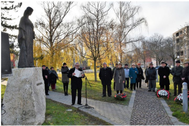
Szent Borbála szobra és a megemlékezők a vmk előtti parkban

■ Szent Borbálára, a bányászok védőszentjére emlékezett a város, az egykori bányászok, a hagyományörző szervezetek tagsága december 4-én az Agorán a Borbála szobornál. Borbála legendája a villámcsapással fonódott össze, ezért olyan szakmák művelői tartják védőszentjüknek, amelyek a tűzzel, a váratlan veszéllyel kapcsolatosak.