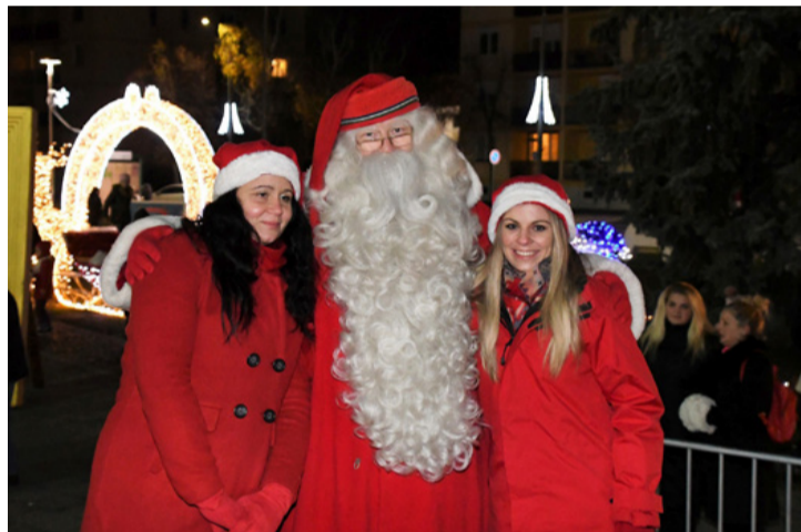
Öreg Mikulás, nem vén Mikulás