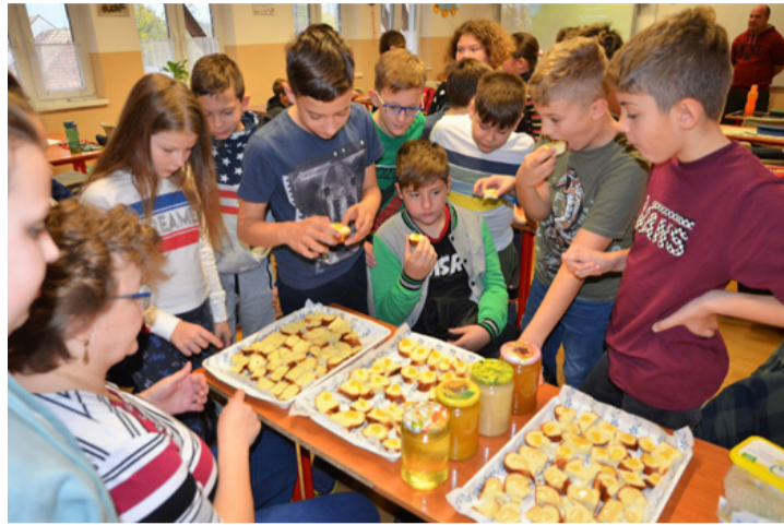
Nagy sikere volt a mézkóstolónak