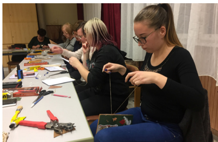
A lapokat kéttűs varrással illesztették össze