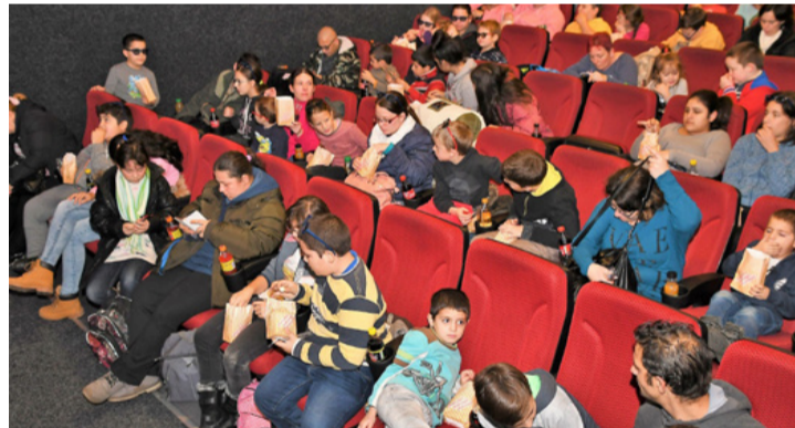
Igazi 3D-s moziélmény igazi szeretetből