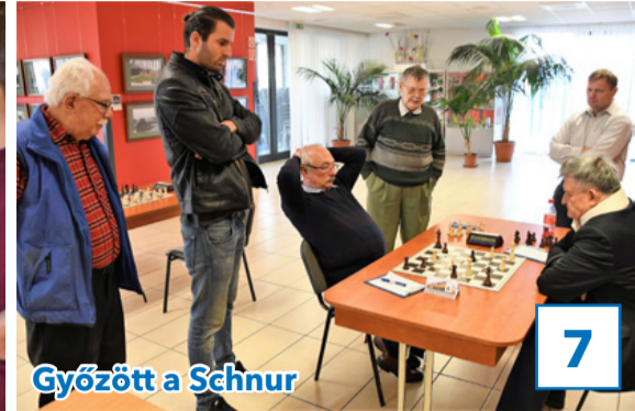
Győzött a Schnur