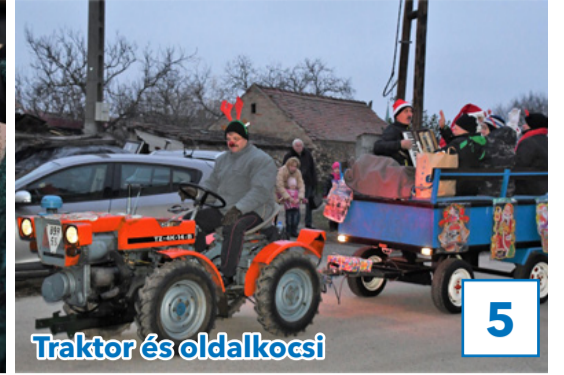
Traktor és oldalkocsi