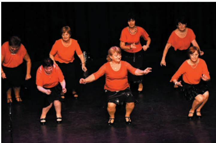
Koruket meghazudtolva táncoltak

Veszprém megye sokszínű kulturális tevékenységét mutatták be színpadi produkcióikkal a nyugdíjas klubok művészeti csoportjai november 22-én a Nagy László Városi Könyvtár és Szabadidő Központ színháztermében. Az immár hagyományos megyei gálán az idén 30. évfordulóját ünneplő országos klubszövetségről is megemlékeztek a résztvevők.