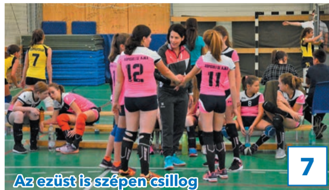
Az ezüst is szépen csillog