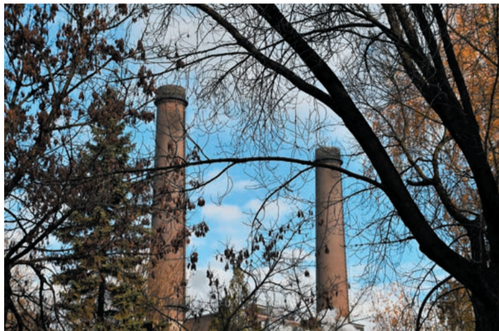
A tulajdonosok szerint „zöldül” az erőmű

A következő szónok, az erőmű másik régi nagy kriti-