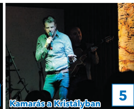
Kamarás a Kristályban