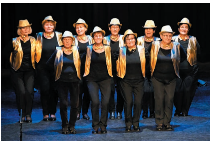
A szabadiak csillogó színfoltot jelentettek a gálán