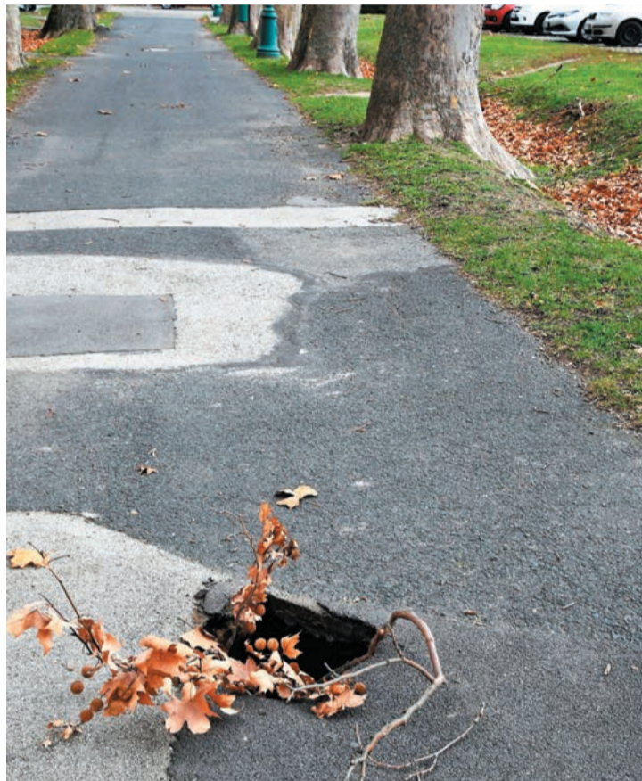
A kátyú hamarosan eltűnik az útról. Addig nem árt az óvatosság!