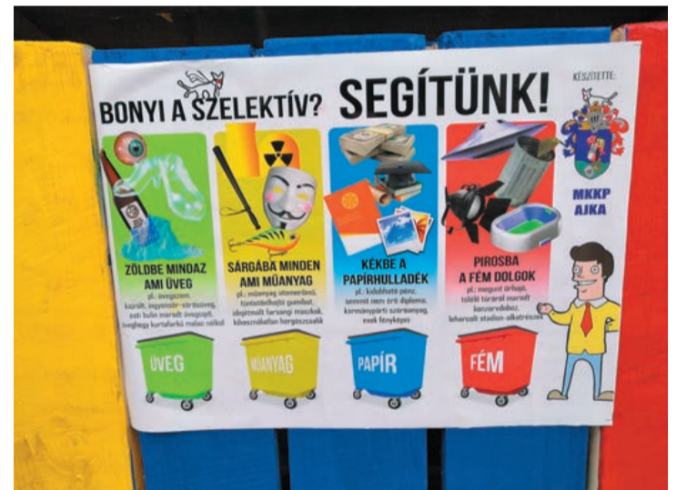
Jobb felső sarokban a „manipulált” címer