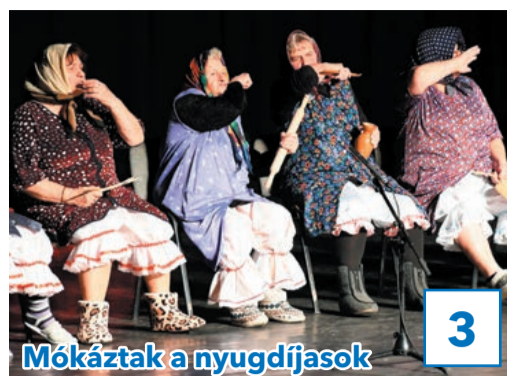
Mókáztak a nyugdíjasok