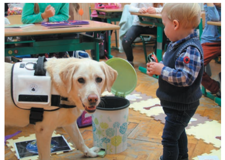
A terápiás kutya egy másfél éves babának is meg tudja tanítani, hogy a szemét a kukába való