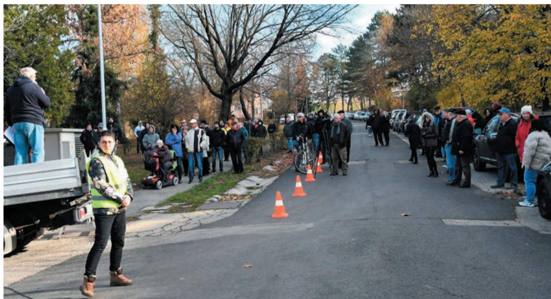
A szép idő ellenére kevesen jöttek el