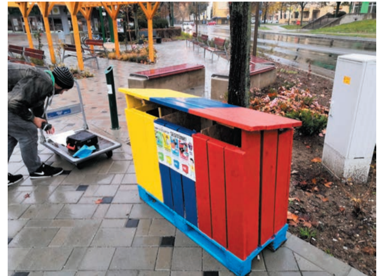
Az installálás boldog pillanatai

A Magyar Kétfarkú Kutya Párt ajkai szervezte (MKKP Ajka) november 10-én adta át a Zenit előtti téren elhelyezett szelektív hulladékgyűjtőt.