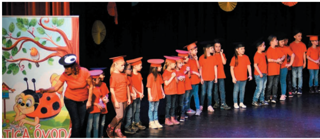
Katicák a színpadon