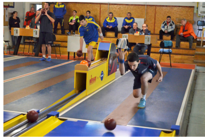
Teke Szuperliga Tósokberénden