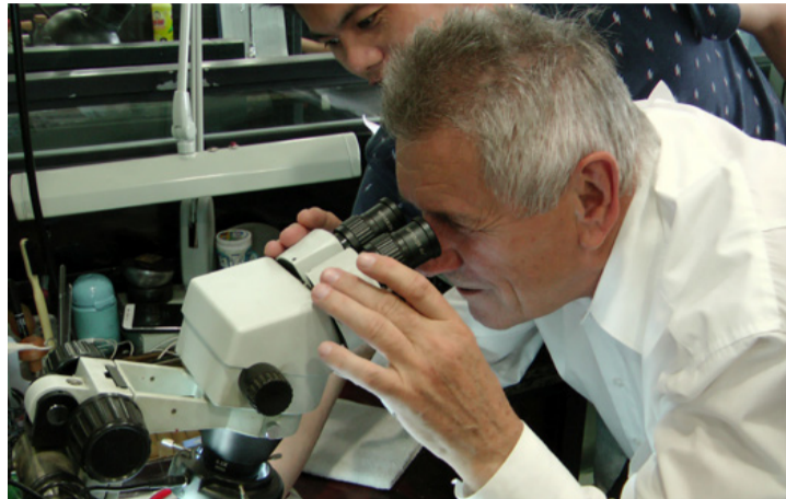
Nem túlzás: a donghaji manufaktúrában mikroszkópikus pontossággal munkálják meg a kristályokat

Az ébredés kissé nehezen ment (otthon még mindig hat órával kevesebb volt, azaz kb. hajnali kettő), nehezemre esett kikászálódni az ágyból. Diszkrét kopogtatás figyelmeztetett arra, hogy kezdődik a nap. Gyorsan gálába vágtam magamat (tudtam, hogy a polgármesteri hivatalban kezdünk) és felpattan-am ez elektromos járgányra, ami – késlekedésemnek hála – egyedül engem szállított az étterembe. Közben gyorsan „marok kamerámat”, hogy néhány videofájl készítsék a szálloda környékéről. A reggeliző teremben, ami akkor volt mint egy fél futballpálya,