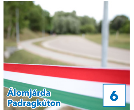
Álomjárda Padragkúton 6