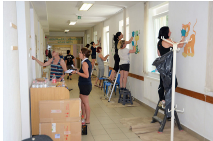
A Bourns Kft. kezdeményezésére sokan ragadtak ecsetet