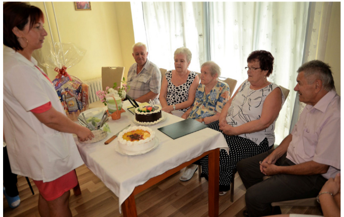
A műanyagmentes július jegyében papírtányért használunk...