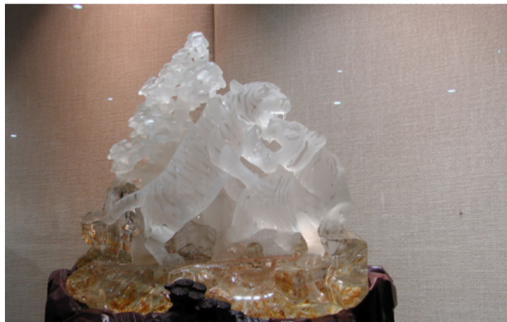
Egy műretek. Tigrisek kristályból

a többiek már javában csillapították éhüket. Próbáltam nem elcsábulni a számtalan fogástól és kordában tartani fantáziámat, de nem tudtam olyan fogást elképzelni, ami hiányzott volna a svédasztalról. Szinte már zavaró volt, hogy az ember szinte át sem tudja tekinteni a kínálatot, még ha érdekességekre vadászik is, muszáj választania a sok-sok finomság közül. Seb-tében felállított szabályom szerint kagylót, ismeretlen eredetű tengeri ételeket, leveket, salátákat, gyümölcsöket nem, narancslé, kávé, kefir, virsli, tojás, némi rizses valami igen. Lehet, hogy túl szigorú voltam és nem ugrot-