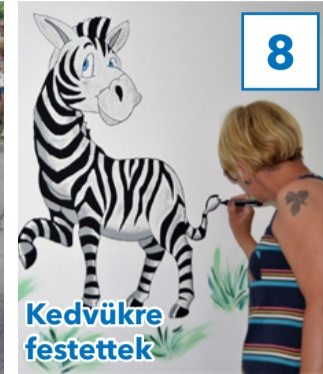
Kedvükre festettek 8