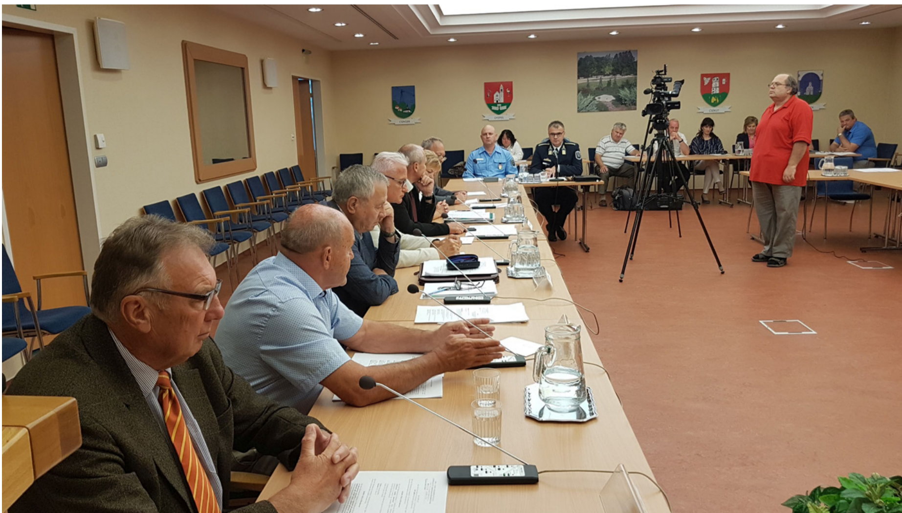
A városi rendőrkapitány beszámolóját tartja a testület előtt