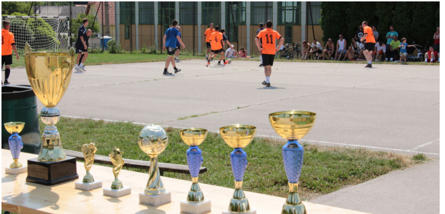
(ta) ■ Most is Milánék nyertek