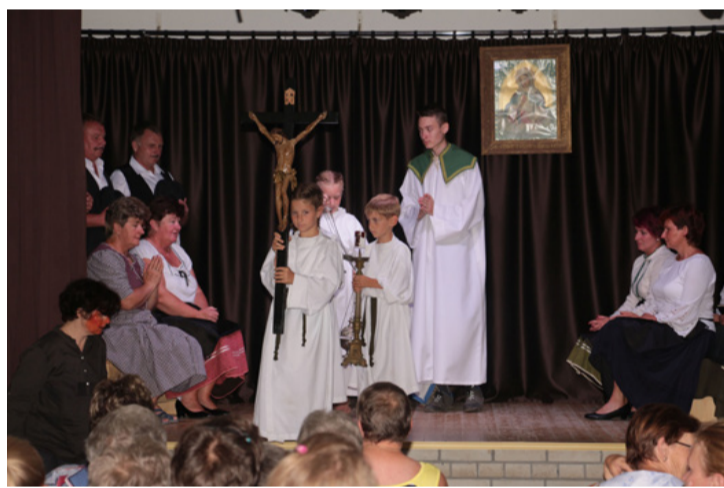
Egymásnak játszottak, tiszta szívvel és lelkesedéssel

■ Ajkarendek határában Józsi fédá und Rézi mám a két szalmabábu ismét felöltötte ünnepelő ruháját, hiszen 25. alkalommal tartottak a faluban háromnapos Német Nemzetiségi hétvégét.