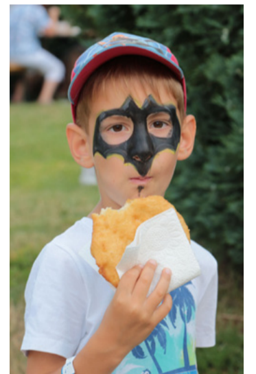
Ő talán a százhuszadikát is megéri