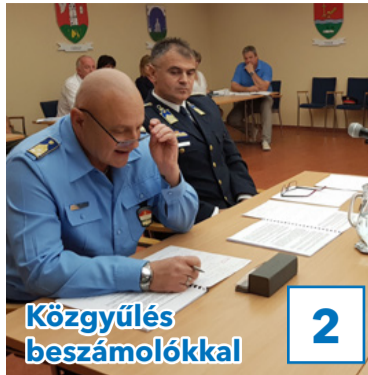
Közgyűlés beszámolókkal 2

32. évfolyam, 26. szám, 2019. július 19., péntek