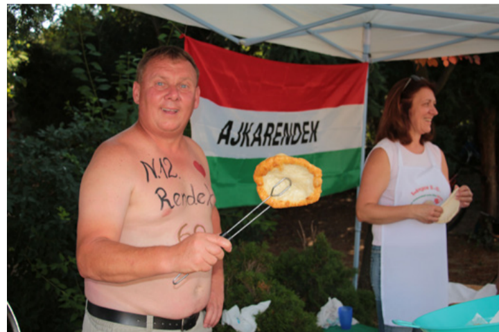
Ennél jobb lángos nincs is!

finom vacsora, addig az iskola előtt veterán autók és motorok sorakoztak fel, hogy megcsodálják őket. Nagy sikere volt a téren a traktoroknak is. Gyerekek és felnőttek szívesen időztek a színes gépek mellett, amiknek tulajdonosaival elbeszélgetve még azt is megtudhatták, hogy a mezőgazdasági munkák nem egyhangúak, hanem sokrétűek és izgalmasak. Legtöbbször a hatalmas zöld-sárga John Deere traktort nézték meg közelebbről és másztak fel a fülkéjébe. Egy ilyen bemutató remek lehetőség arra, hogy felkeltsék vele a fiatalok érdeklődését az ágazatban rejlő lehetőségek iránt. Míg az ételek csábítóan illatozva rottyogtak a bográcstokban és kóstolásra vártak addig 60 bátor ajkarendeki Adonisz-testü férfi vállalta, hogy testére festeti az Ajka 60 feliratot. Tisztelegve ezzel is Ajka város előtt. Annyi bátor jelentkező akadt, hogy már a