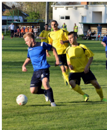
Az Ajka Kristály – Sümeg focimeccs egy lendületes pillanata