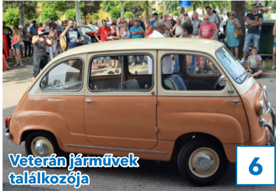
Veterán járművek találkozója 6