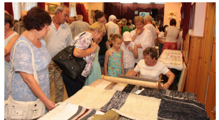
A „gyakorlati bemutató” is sok érdeklődőt vonzott