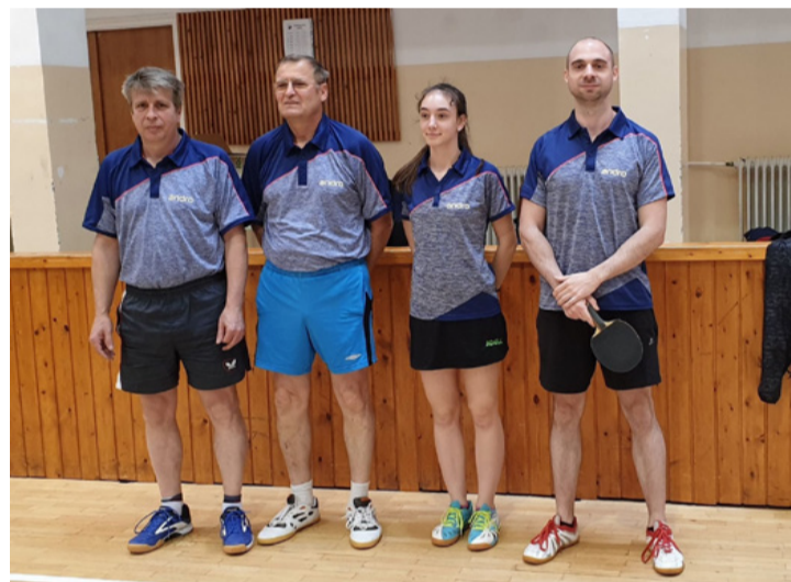
Kiharcolhatják az NB II-be jutás jogát