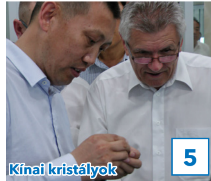
Kínai kristályok 5