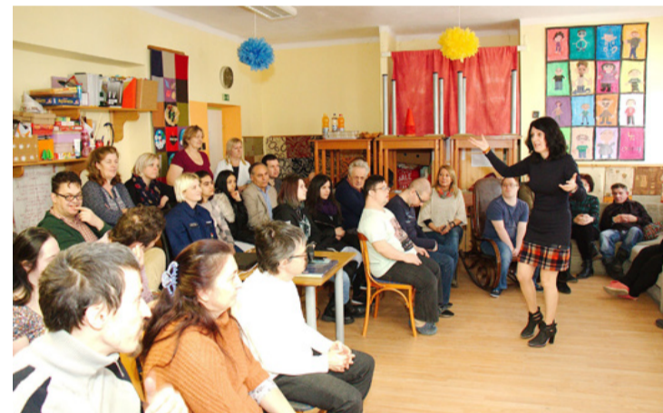
Az intézményvezető végig fenntartotta a figyelmet

Kell-e jelenteni a lopást, kell-e jelenteni ha tudomásom van arról, hogy valaki lopott? - tette fel a kérdést a házigazda. A válasz is érkezett hamar: igen jelentené mindenki. Ami nagyon jó arány, ráadásul itt is igaz Babits Mihály Jónás könyvéből elhíresült mondata, miszerint "mert vétkesek közt cinkos aki néma". Azaz ha nem jelenti valaki a tudomására jutott lopást az nagyon könnyen kerülhet maga is bajba, hiszen nem mindig pontosan nyomon követhető az, hogy ki volt annak a bizonyos tárgynak, tárgyának a közelében és így a lopásról tudó kollégák is gyanúba keveredhetnek, nem beszélve arról, hogy hallgatásukkal bűnpártolást követnek el. Egy kutatás szerint az emberek 80 százaléka találko-