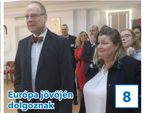
Európa jövőjén dolgoznak