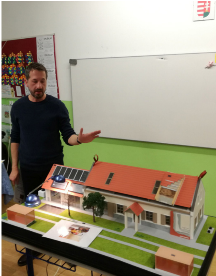
Nagy sikere volt az ökoház makettnek Tósokberénden