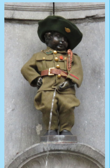
Brüsszel jelképe, ezúttal katonaruhában