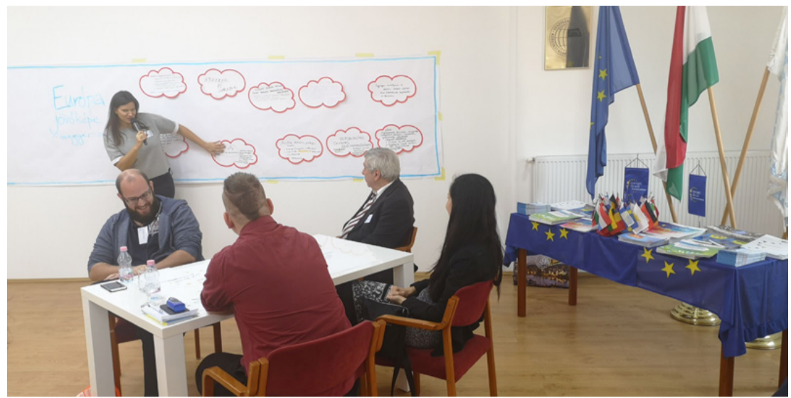
A műhelymunka végig jó hangulatban zajlott

A műhelymunkát három, az EB Magyarországi Képviseletén dolgozó új hölgy (egyikük Kolozsvárról érkezett) vezette, akik először „felmérték”, kik is vesznek részt a workshopon, az élet és az ország mely területéről éreztek, majd kiscsoportokba szervezve több megvitatandó kérdést tettek