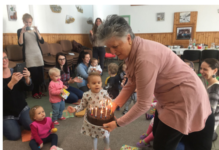
A hangulat mindig kiváló a klubban