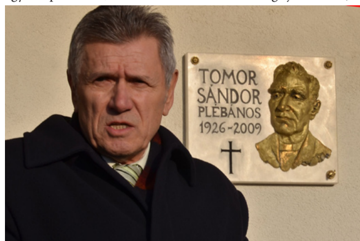
„Ha ma élne... nem lenne annyi ármánykodás, álszenteskedés, befordulás, képmutatás.”