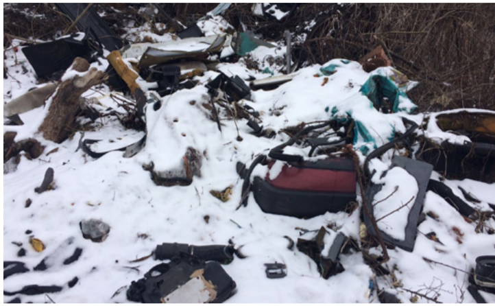
Nem épületes látvány a sok szemét az erdőszélen

Az Üveggyári Ifi Flotta tagjai nemrégiben, a Széki-tó környékén tett kellemes túrájukról hazafelé menet Széckpuszta közelében számos tele műanyag zsákot láttak szanaszét heverni.