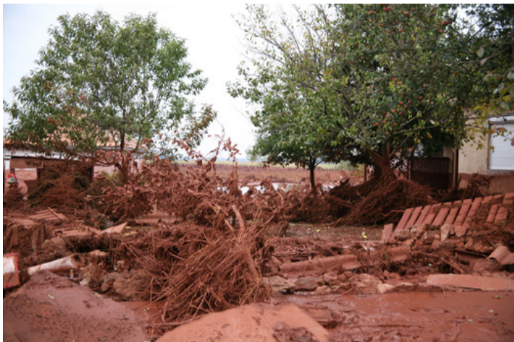
Rombolt és betemetett mindent a vörösiszap