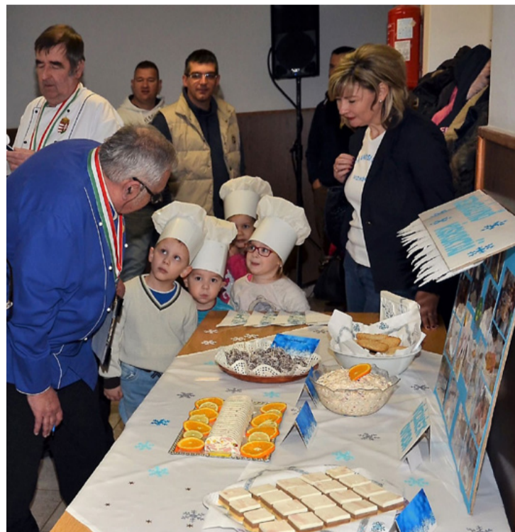
A kiskukták a jövő zálogai

A nyolc gyerekcsapat között a Vízikék óvodából a