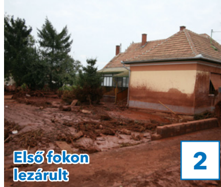
Első fokon lezárult

32. évfolyam, 5. szám, 2019. február 15., péntek