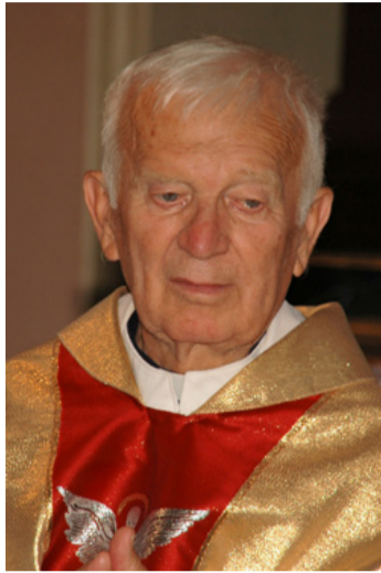
Tíz éve nincs közöttünk

Sanyi bácsi rendkívül puritán ember volt. Nem kellett neki a cicoma, a fényűzés, sem öltözködésében, sem otthonában. Mindenkiel szóba állt és érthetően, egyszerűen, nyíltan, nem kertelve társalgott. Lehetett az a kirándulások alkalmával, vagy a Tósokberénd és Bódé között közlekedő helyi járaton. Ugye mindenki em-