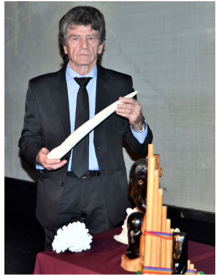
A tengerész kincsei egy részével

utazását. A tervezett és kényeszerű dekkolások alkalmával lehetősége volt bejárni, az európai ember számára olykor egzotikus tájakat. Körbeutazta a Földet Ázsiától Amerikáig. Megtapasztalta, hogy a katalógusokban látható csalogató képeken túl minden helynek van árnyoldala is. Találkozott, az 1963-as angliai vonatrablás legendájával Ronald Biggs-sel, a Japán Cukaharával, a torna sport egyik csavart ugrásának névadójával. Olyan állat-, és növényvilág tárult a szemé elé, amelyet, a magyar ember többsége csak a tévében lát. Vizuális élményeit megörökítette és a kivetítő segítségével megosztotta a jelenlévőkkel. Kedves volt tőle, hogy a végén megköszönte feleségének az elmúlt 38 évet. Befejezésül bemutatott néhány birtokában lévő tárgyat is, korallt, perui pánsípót, sisakkagylót és a faragott elefántagyrat, amelyekhez történetek sora