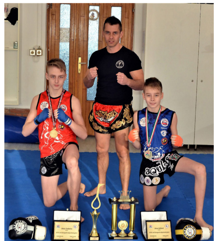
Már figyel rájuk a világ

Szüleik is mindenben mögöttük állnak, édesanyjuk egyetlen edzést, vagy versenyt sem hagyna ki. Erre szükség is van, mert, ahogy edzőjük fogalmaz, a sport hasonlít az üzleti élethez: nem lehet leállni, folyamatosan mozgásban kell lenni ahhoz, hogy versenyben