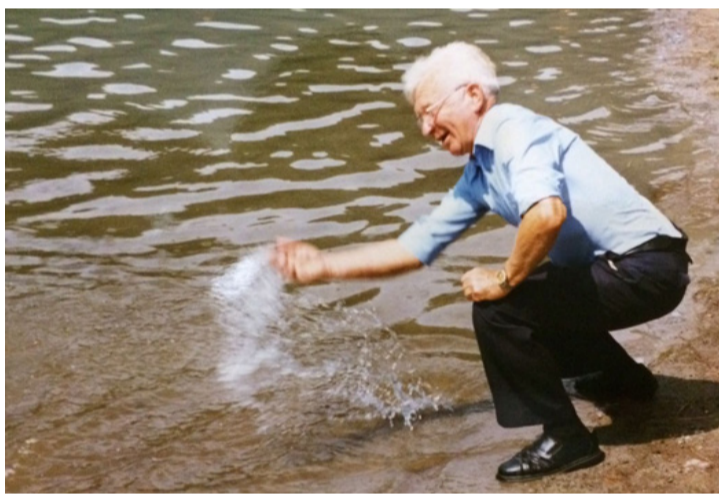
Egy önfelelt pillanat

lékszik megjelenésére, az elmaradhatatlan pantallóra a világoskék inggel? Képes volt egy álló nap cipelni a pakkját, amiből jutott mindenkinek egy falat, sőt a flakon bor is elfért a szatyrában, olykor a megtisztelő pertu ivásra is lehetőséget adott. Sokat költött a fiatalságra. Szentmise után elvitte őket egy fagyira, bambira, de ün-