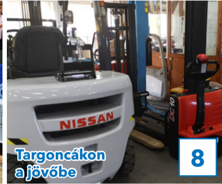
Targoncák a jövőbe