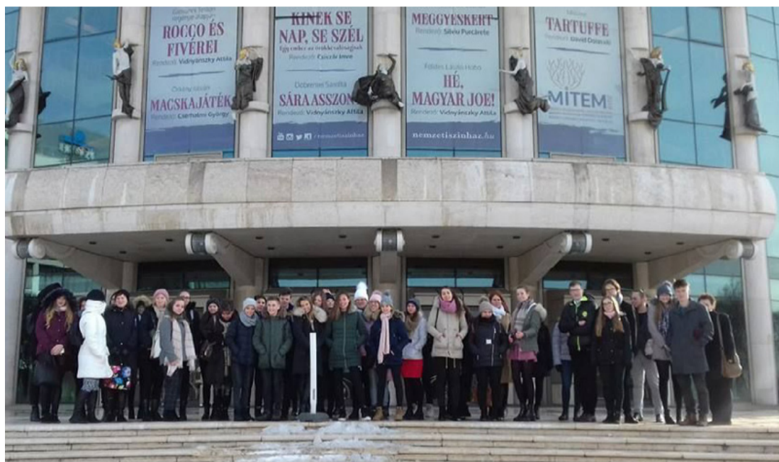
Bródysok a Nemzeti lépcsőjén