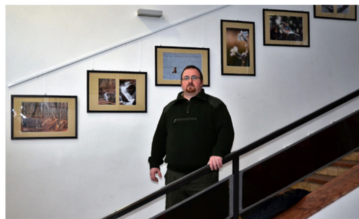
Érdemes ellátogatni a vmk lépcsőházába