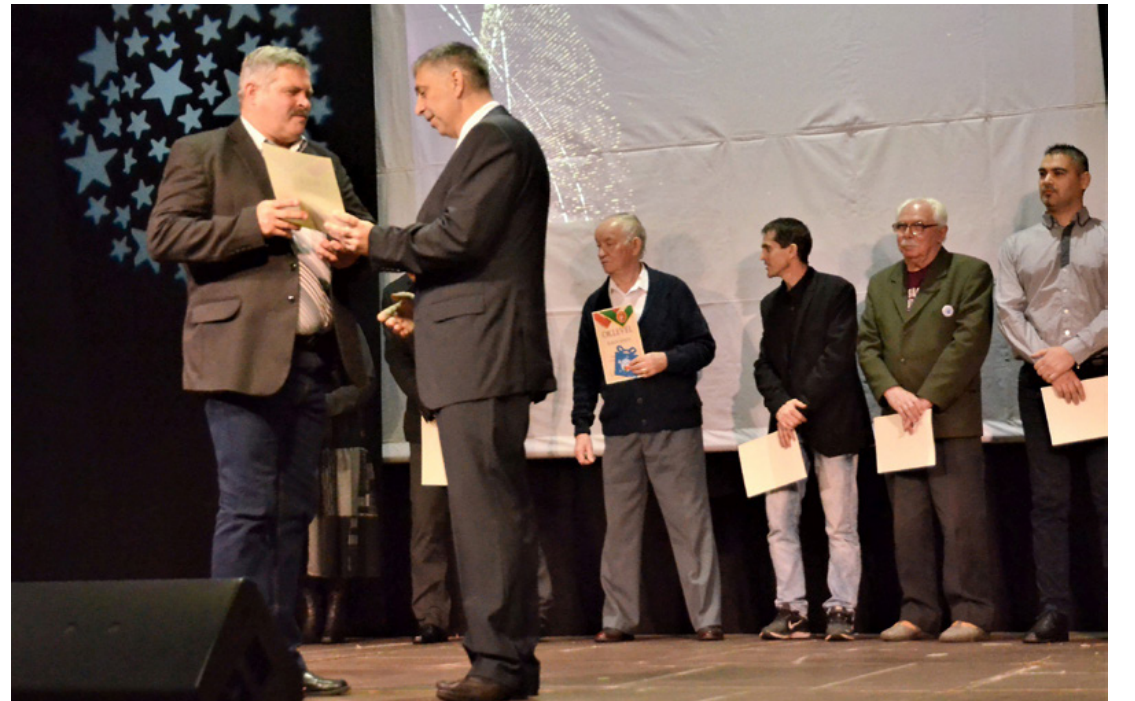
Szokás szerint a seniorok is kitétek magukért