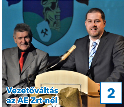
Vezetőváltás az AE Zrt-nél

32. évfolyam, 1. szám, 2019. január 18., péntek