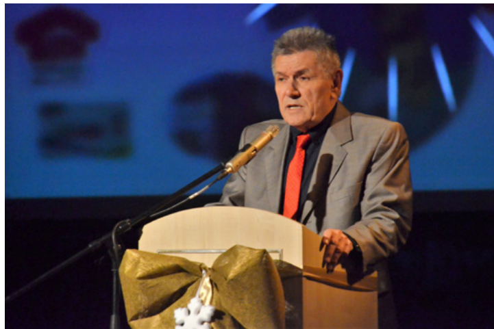
Elkezdődnek Ajkaújváros építésének előkészületei

A kulturális szolgáltatások színvonaláról csupa felsőfokban tudott beszélni a polgármester. A Nemzeti Művelődési Intézet Veszprém Megyei Irodájától kért és kapott tájékoztatás szerint a megyében Ajka a második helyen áll. De néhány területen Veszprémet is megelőzi, azaz ideje ártérkelni az egykori „bányászvárosról” alkotott előítéletet. A színházba látogatók arányát illetően Ajka az első tíz magyar város között van. A kórusok, a zenekarok és az Ajka-Padragkúnd Néptáncegyüttes mind-mind magas színvonalat képviselnek.