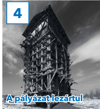
A pályázat lezárul