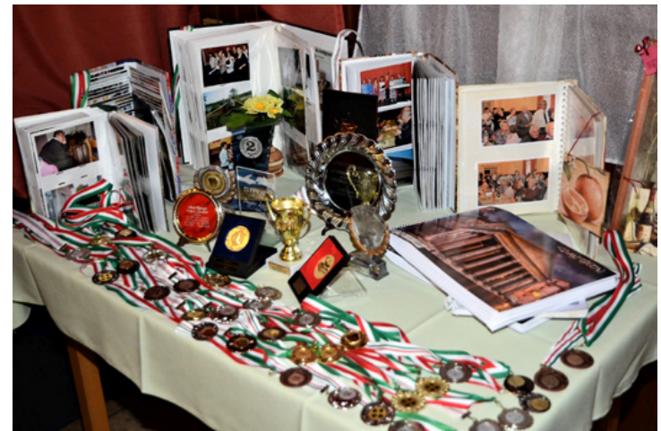
Csaknem negyven év után az utolsó elismerések tárgyai