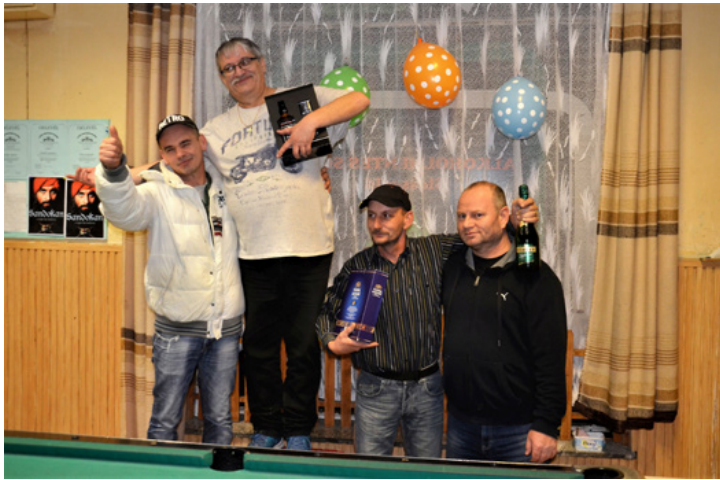
A boldog győztesek