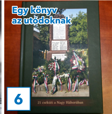
Egy könyv az utódoknak