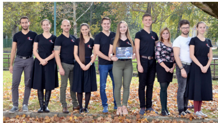
Ha kell szomorúak, ha kell elegánsak