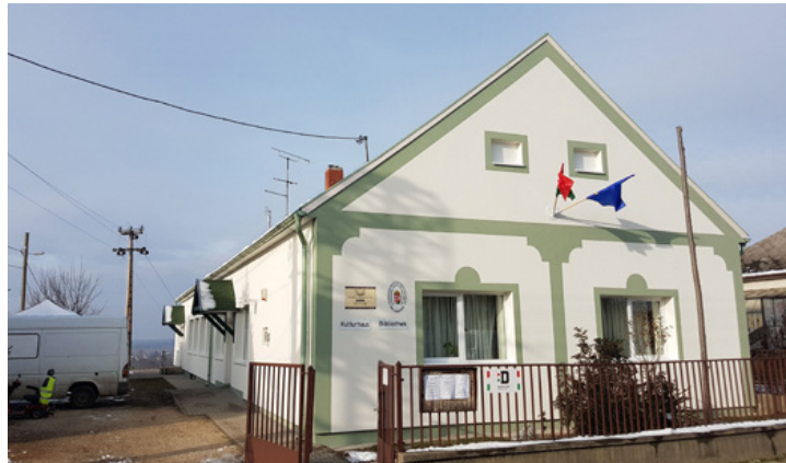
A felújított művelődési ház