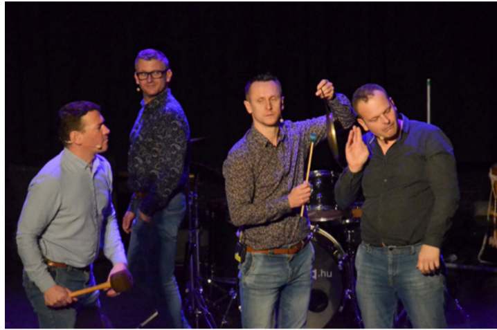
Az előadás bővelkedett humoros mozzanatokban