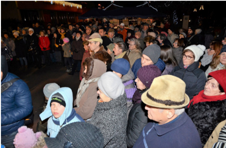
Az Agórán sokan várták a fény eljövését