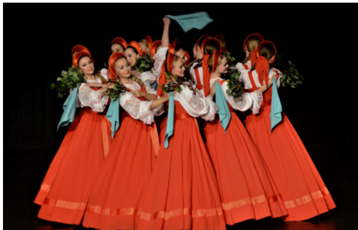
Mintha a színpad felett lebegnének

Művészeti vezetőjük M. Kolcova, aki megőrizte és gyarapította repertoárjukat. RÉ ■