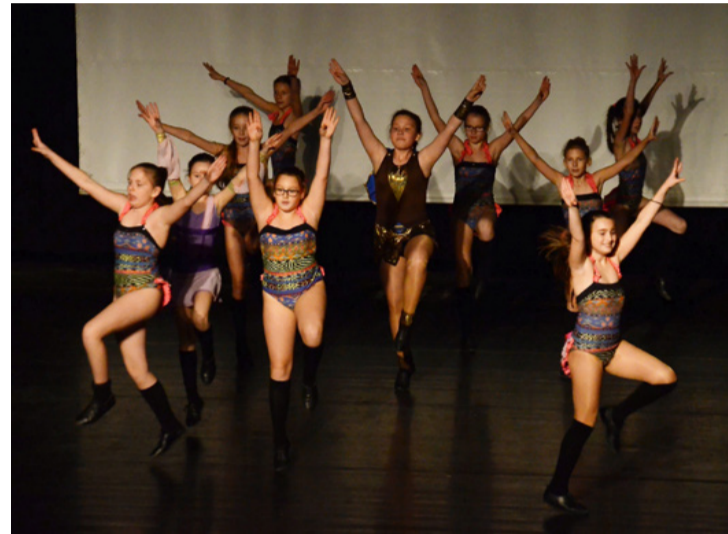
Lendületes táncok sorát láthatta a közönség