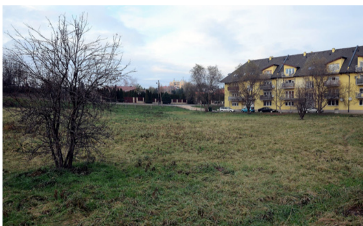
Nyitott tere a lehetőségeknek