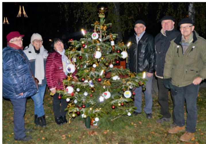
A csékútiak büszkesége

kell), valószínűleg elnyeri majd a legformabontóbb dí-