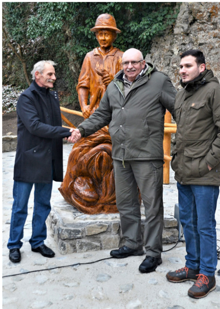
A művész és a leszármazottak

Molnár Gábor 110 éve született és vált a XX. század egyik legnépszerűbb vadász és utibeszámoló írójává, 26 önálló kötete, több száz tárcája, ismeretterjesztő írása jelent meg. Rádiójátékait éveken át hallgathatták a műfaj kedvelői. Nemcsak író, kutató is volt, két darázs-faj is viseli a nevét. Egy brazil expedícióhoz az őserdei kutatásra lövész tudása, érdeklődése és fizikai adottságai miatt választották ki 1930-ban. Ott egy baleset során veszítette