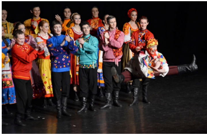
Szinte tudomást sem vesznek a gravitációról

A világhírű orosz állami együttest Nagyvezsgyina Nagyvezsda koreográfus alapította 1948-ban, aki az ősi néptáncot ötvözte a klasszikussal. Egy litográfián látta azt a körtáncot, amelyen a lányok nyírfavesszőket tar-