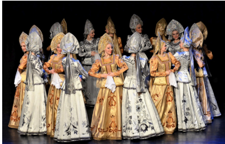
Káprázatos ruhák, elbűvölő mozdulatok

■ Az Állami Akadémiai Táncművészeti Együttes Magyarországon turnézik. Ajkára is ellátogattak a művelődési központ színháztermébe november utolsó napján, hogy különleges tánclépéseikkel, fantasztikus koreográfiáikkal ámulatba ejtsék a közönséget.