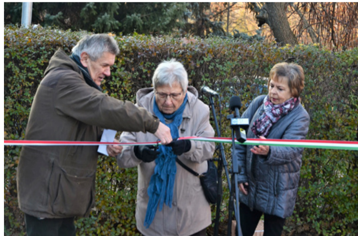
A szalagátvágás is jól sikerült