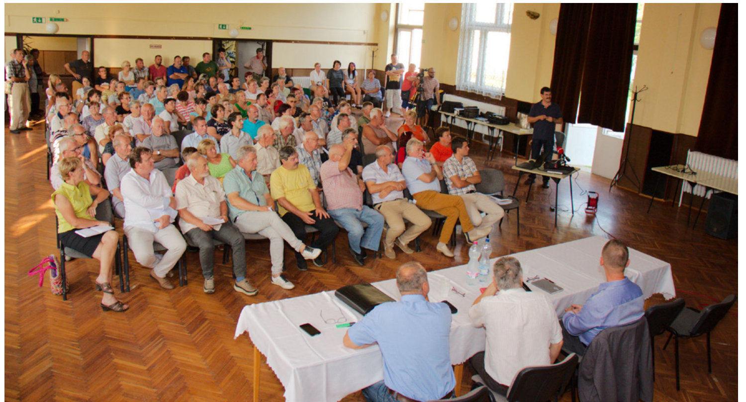
Megteltek a művelődési ház széksorai