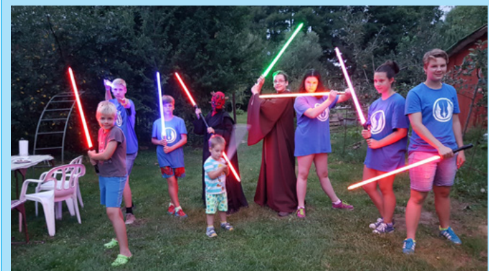
Mintha a filmvászonról léptek volna le

Jedi lovagok lepték el Ajkát július utolsó hetében. Nyolcan voltak, közös jellemzőjük, hogy fiatalok és imádják a Star Wars-t, illetve a kultikus filmhez kapcsolódva mindent.