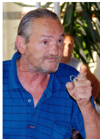
A helyiek éltek a lehetőséggel és sokat kérdeztek

■ Hatalmas érdeklődés mellett szervezte meg Ajka Város Önkormányzata Padragkúton az első városrészi fórumot, ahol a lakók véleményére voltak kíváncsiak az életüket befolyásoló problémáikat illetően.