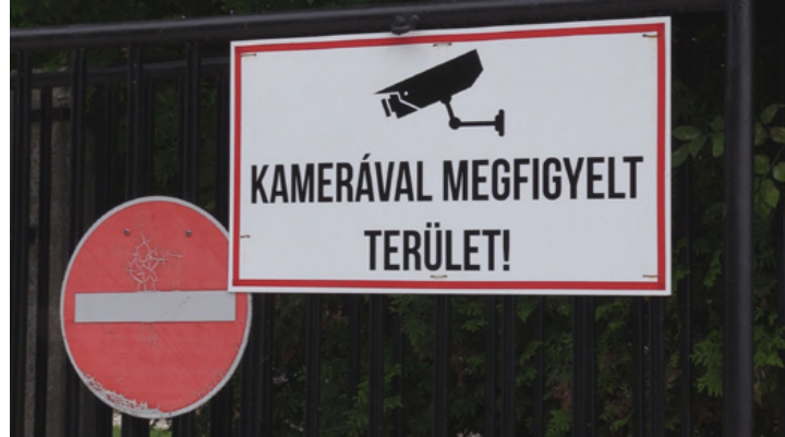
Már látszik, hogy a kamera nem lehet végleges megoldás

– A temető fenntartáshoz hozzátartozik, hogy biztosítjuk a méltó kegyeletgyakorlást. Tehát ha valaki kijön egy sírhoz, gyertyát gyújt, vagy szeretne csendben megemlékezni elhunytjairól, akkor nem feltétlenül praktikus, ha autók vágatnának el mellette.