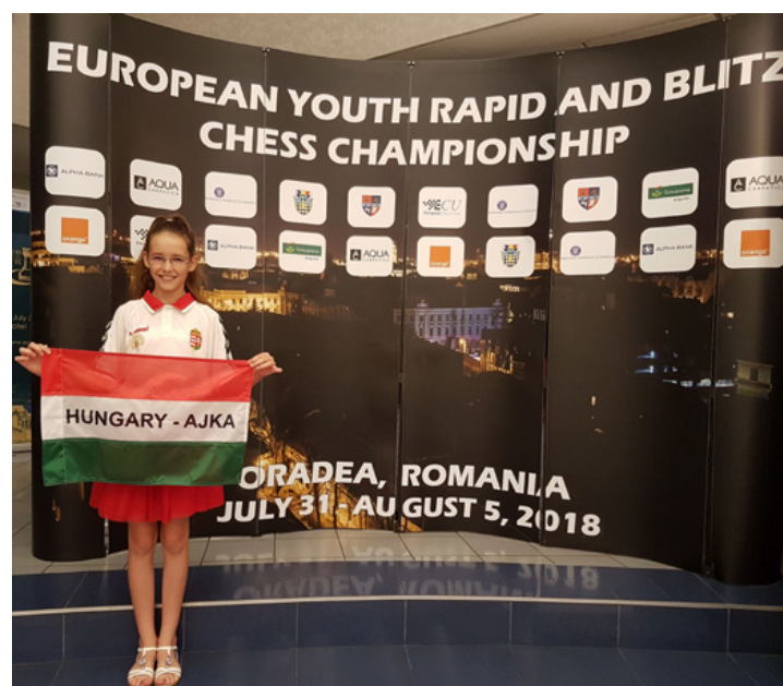
A legmosolygósabb és legtehetségesebb ajkai sakkozó