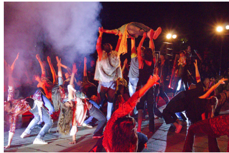
A „Képzelt riport...” aktuálisabb, mint valaha