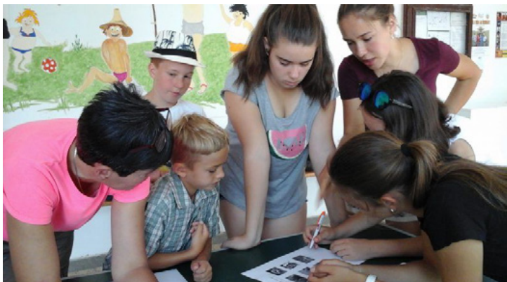
A táborozók egy csoportja