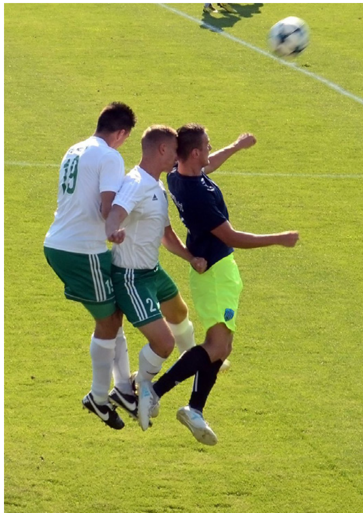
Ekkora fölényben voltunk