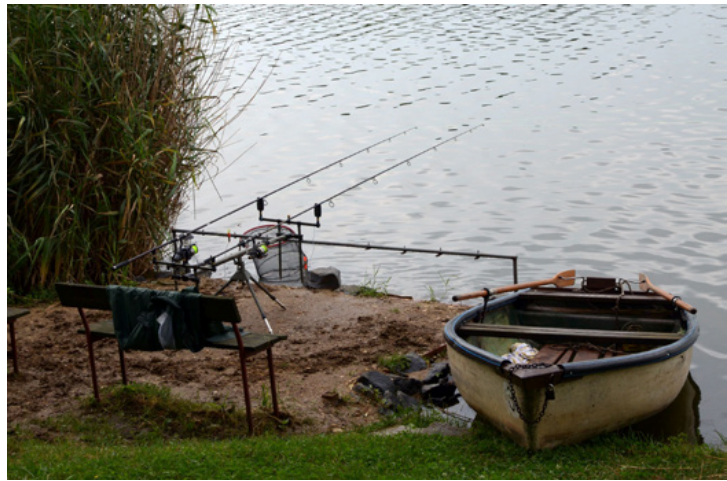
A horgászat kellékei a parton