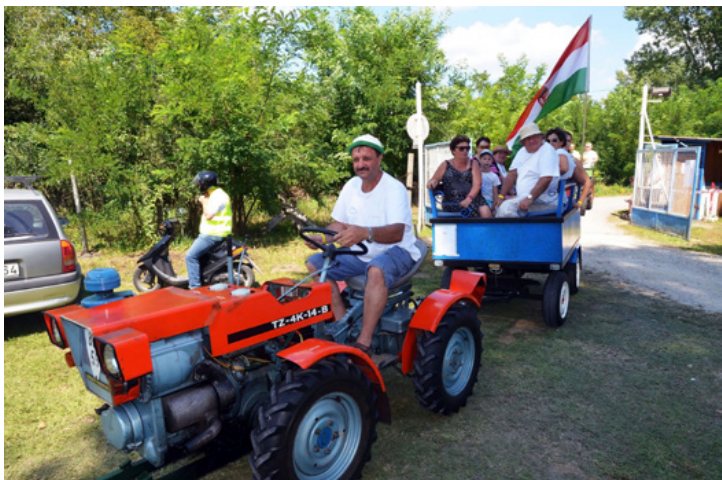
Stilszerű belépő a Tóberfesztre