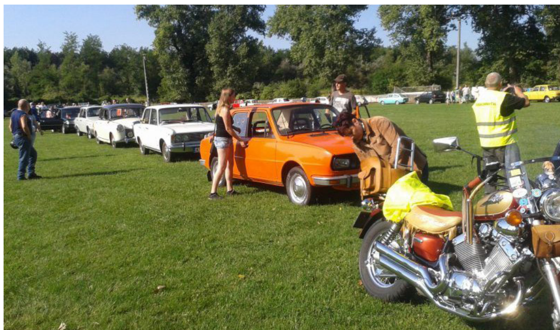
A Tóberfeszt vendégei a Balaton-felvidéken „túráztatták” járműveiket