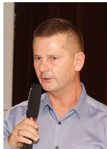
A jegyző is állta a sarat