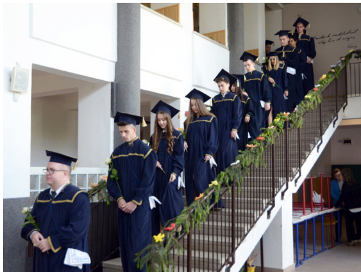
Különleges színfoltja az ajkai ünnepségeknek a vörösmartysok taláros ballagása