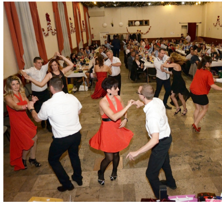
A salsa bemutatóhoz csatlakoztak a bálzókon is

A műsor salsa bemutatóval folytatódott, több vendég is csatlakozott a látványos táncbemutatóhoz.