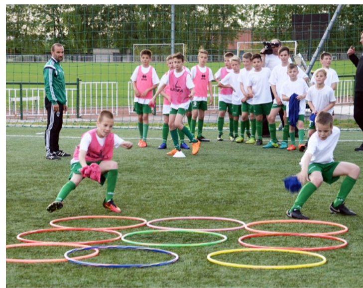
Ajkai gyerekekkel mutattak be hasznos gyakorlatokat a szombathelyi szakemberek