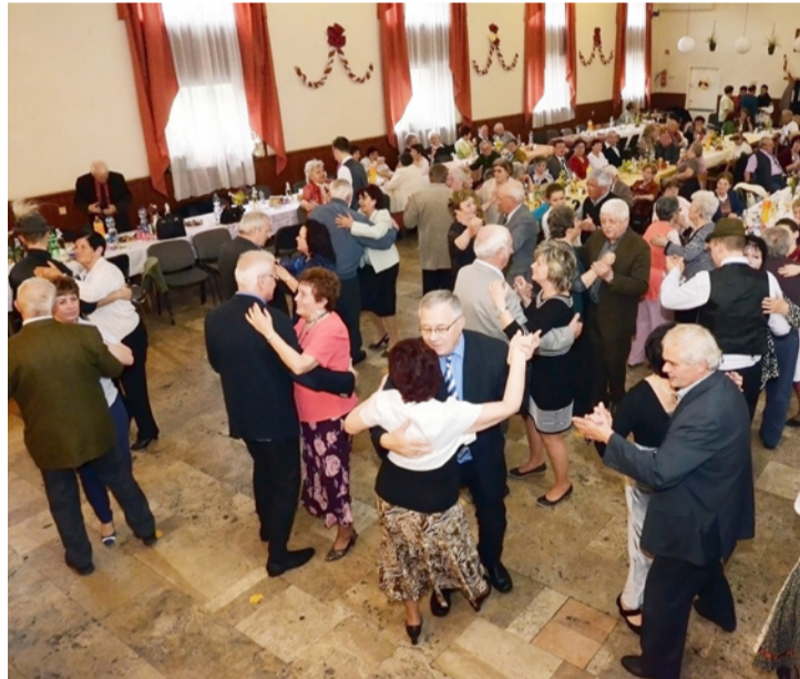
Nem kellett sokat biztatni a nyugdíjasokat, hogy táncra perdüljenek

TÓBERKENU Régi korok csónakázásait is felidézték