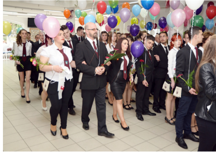
A szent-györgyisek léggömbökkel ballagtak, amelyeket az ünnepség végén a magasba engedtek