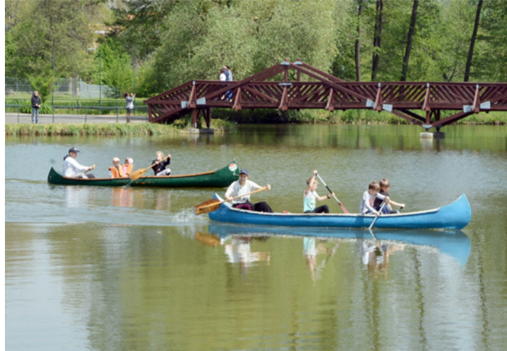
Nagy csatákat vívtak a tavon