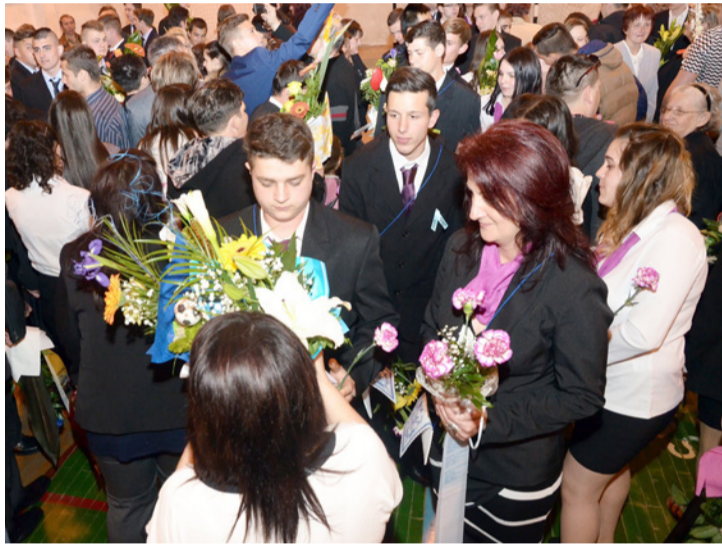
Családtagok, barátok gyűrűjében a ballagók (képünk a Bercsényiben készült)

A Bercsényi pénteken délután, a Vörösmarty gimnázium, az Ajkai Szakképzési Központ Bánki intézményegysége, a Szent-Györgyi szakközépiskola, szakiskola és kollégium, és a Bródy gimnázium szombaton délelőtt tartotta ballagási ünnepségét.