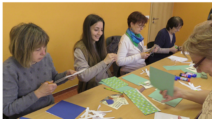
Jókedvűen folyt a munka

Színes kartonból először a borítólapot tervezték meg. Volt, aki kék, vagy zöld, vagy barack színt választott ehhez. A szakácskönyv elejére feliratokat, címkéket és egy kis kötevényét ragasztották, amit selyem szalaggal tettek 3D hatásúvá. A kötevényre csipkézett zseb került, amelyből színes