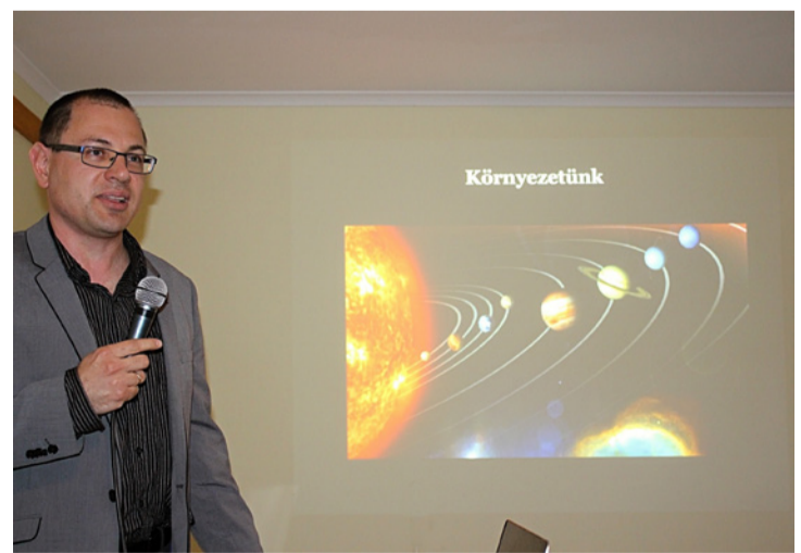
Vetített képekkel is illusztrálta előadását a csillagász

Az MTA kutatója ajkai származású, így gondolkodás nélkül fogadta el a felkérést a klubtól, hogy előadást tart-