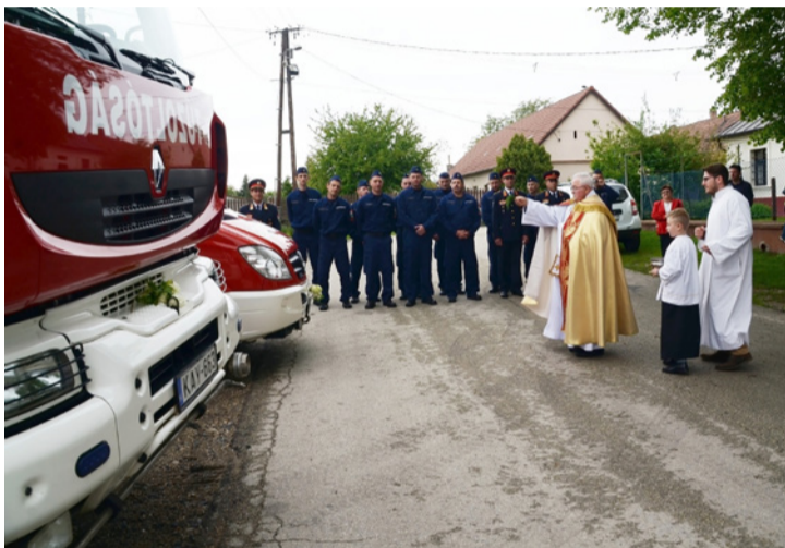
A plébános megáldotta a tűzoltóautókat is

Az idén a Tűzoltók Világnapja és az Anyák Napja alkalmából május 7-én a vasárnap délelőtti misét nekik szentelték a tósokberendi Szent István király katolikus templomban.