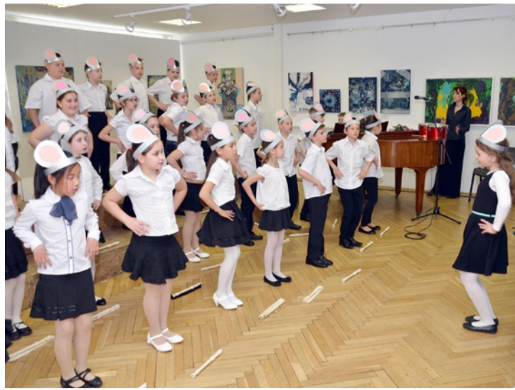
A gyerekek számára jó játék is a közös éneklés

Az intézmény nagykórusának tagjai látványosan töltötték be a színpadot. Kodály Zoltán művet, a Svéd hatost, Bartók Béla szerzeményt, és a Macskaindulót dalolták. Színes arcukat mutatták meg az