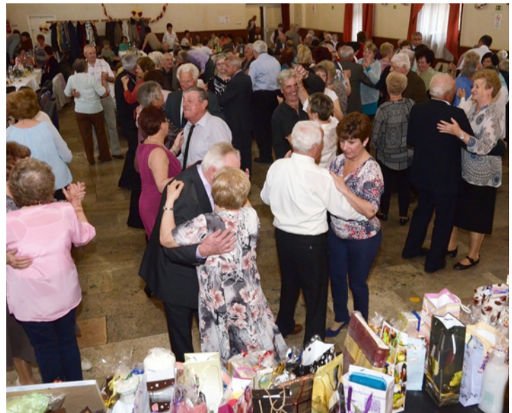
Tombolatárgyak gazdag választéka mellett mulattak a résztvevők

A klubvezető köszöntötte a meghívott vendégeket, majd felkérte Dörner László ön-