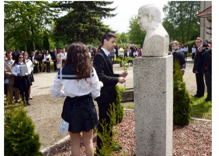
A Bródyban hagyomány, hogy a ballagók virágot helyeznek el a névadó szobránál

Az iskola minden ballagáskor Bródy emlékéremmel jutalmazza azokat, akik az ott töltött négy