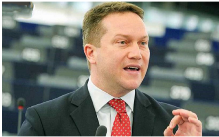
Ujhelyi István Európa Parlamenti képviselő

■ Nem egy alkalommal idéztem már Önöknek a Fidesz 2009-es EP-választási programjából, mivel abban még olyan Európa-párti, valódi polgári gondolatok vannak, amelyek gyökeresen szemben állnak a Fidesz jelenlegi szélsőjobboldali, Európa-ellenes politikájával. Persze, azt a programot még olyan fajsúlyos, gondolkodó konzervatív politikusok jegyzik, mint például Martonyi János. A mostani Fidesznek már írott programja sincs, nemhogy épkezésként gondolta. A közös hazánk hosszú-távú érdekeit szolgáló gondolata biztos nincs. Az egykor Európa-párti, liberális párt a sokadik kanyar után mára egy vállaltan bomlasztó, az európai közösséget – minden jel erre mutat – az orosz agresszor érdekei mentén akadályozó, szügyig korrupt szervezet lett, amely ráadásul bár nemzetinek mondja magát, a nemzet valódi egyesítése helyett erőszakosan, tudatosan és generációs sebeket ejtve szétszakította azt.