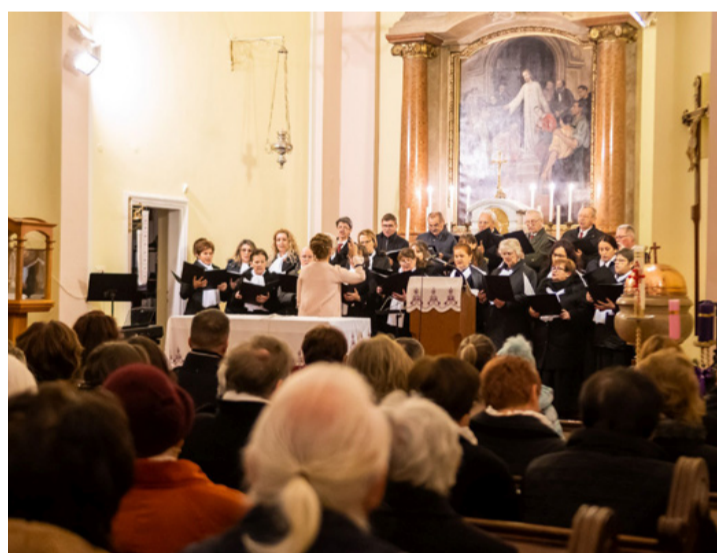
A vegyeskar a Jézus Szíve templom oltárképe előtt