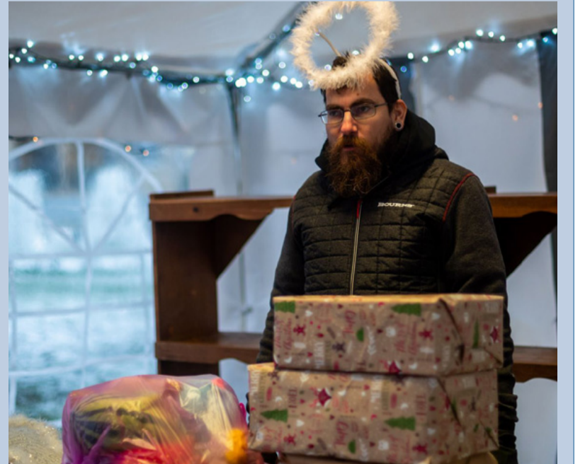
Gyűlnek az ajándékok a Manóműhelyben