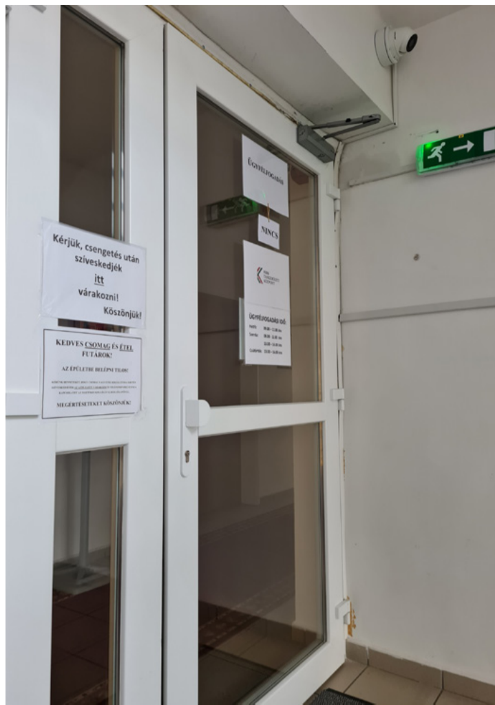
Egyelőre eddig jutottam...

A beszélgetésünket hangfelvételel szeretném rögzíteni.