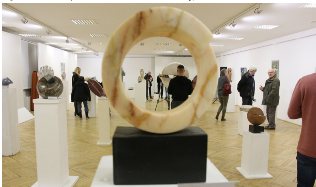
Látrépa a kiállításról