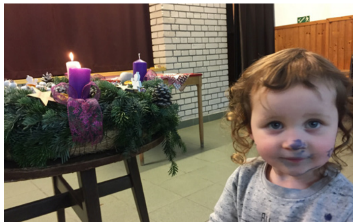
A legszebb ajándék...