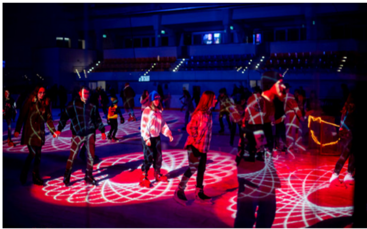
A jégcsarnokban különleges fényeffektekkal várják a bulizókat

A karácsony és szilveszter közötti időszakban, illetve a meghosszabbított téli szünetben január 8-áig minden nap nyitva lesz az ajkai Jégcsarnok, minden nap várják majd közönségkorcsolyával az ide látogatókat, mindazokat, akik le szeretnék mozogni az ünnepek kalóriáit. Akinek nincs saját korcsolyája, közel háromszáz pár bérelhető korcsolya közül biztosan megtalálja a számára megfelelő méretet és kényelmet. NéNo ■