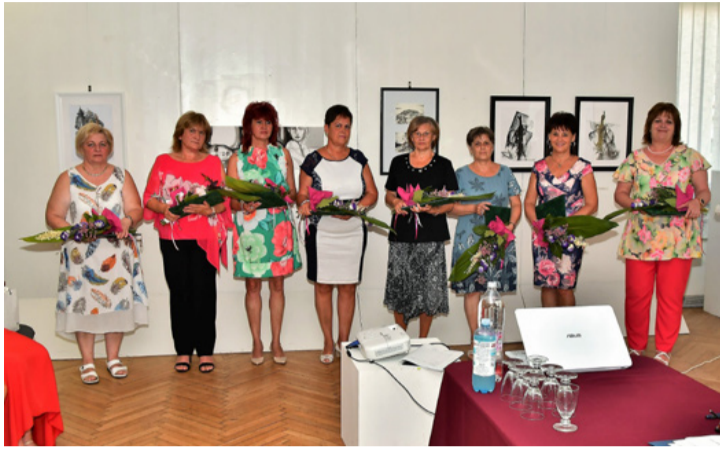
Pedagógus Szolgálati Emlékérmeket kaptak