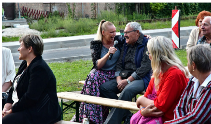
Kovács Ágnes Magdolna, a Pannon Várszínház színésze a közönséget is megénekelte