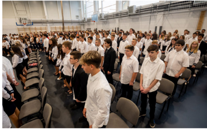
A tágas csarnok több sportágnak is otthont adhat