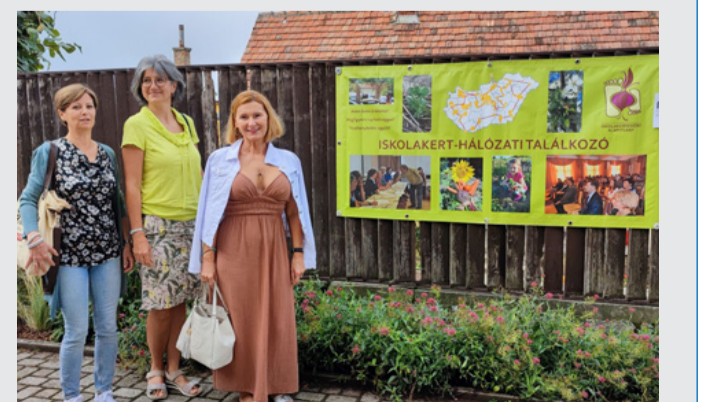
A büszke nyertesek