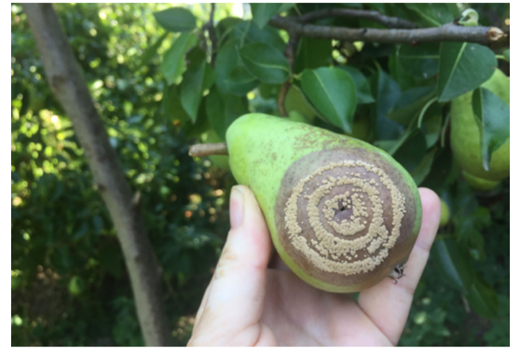
Célkeresztben a monília fertőzés

Sokan nem szeretnek vegyszereket használni a kertjükben nekik ajánlják a szakemberek az „egyszerű anyagok” használatát. Ilyen lehet a csalánkivonat is, amit remekül lehet bevetni monília fertőzés ellen. Létezik