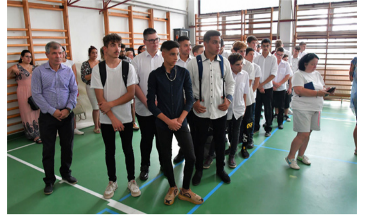
Kezdi sejteni, mi vár rájuk