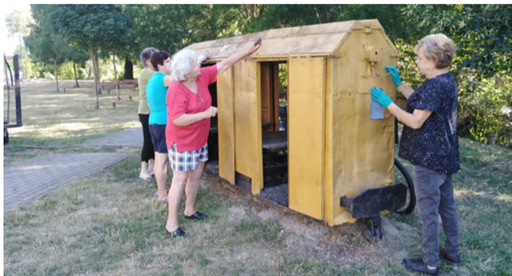
A személyszállító tisztításával kezdték a munkát