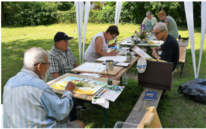
A közös alkotás varázsa. Balról a második a leköszönő elnök

■ Hiába Trianon, hiába az erőszakkal meghúzott határok, a magyar, a székely képzőművészet hatad üzen a történelmi eseményeknek és egységes magyar képzőművészetet alkot, még egy ilyen magyar kisvárosban is, mint Ajka.