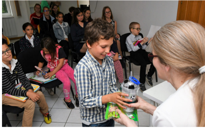
Akik számítanak, mert fontosak nekünk

■ Az ajkai Te Számítasz Egyesület mindössze három éve szerveződött, de a nevüket, a munkájukat már nagyon sokan ismerik a városban és környékén. Az idén nagyon fontos mérföldkőhöz érkeztek, ugyanis sikerült ráatalálni és elindulniuk azon az úton, amiért elsősorban megalakultak. Ez pedig nem más, mint utat mutatni és reményt adni a gyerekeknek a hátrányok leküzdésére és támogatni oktatásukat, fejlesztésüket. Első évzáró ünnepségüket június 10-én tartották.