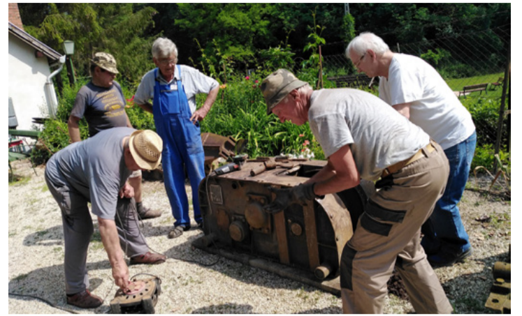
A bányász szervezetek tagjai társadalmi munkában újítják fel a múzeum gépeit