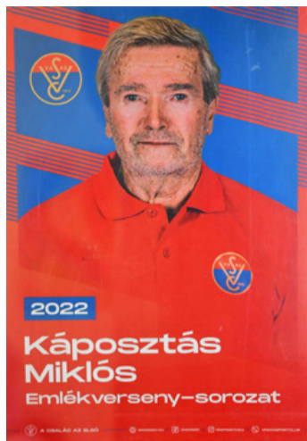
A verseny plakátja

■ Hat ajkai sakkozó is részt vesz a héten zajló Káposztás Miklós emlékversenyen, amely hétfőn délután kezdődött a Nagy László Városi Művelődési Központban.