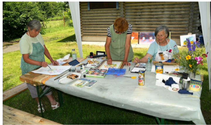
A virágcsendéletet mindenki a saját stílusában örökítette meg