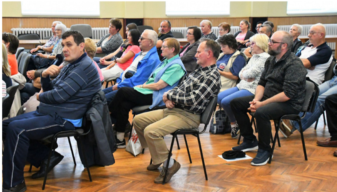
Helyi népszavazás dönthet az elszakadásról