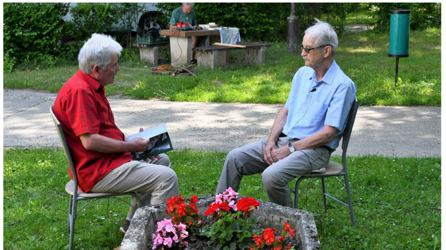
A beszélgetés a Rovaniemi kepmingben, a székely-magyar alkotótáborban zajlott