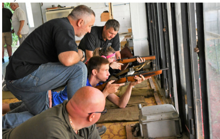
Kispuskások a lőállásban