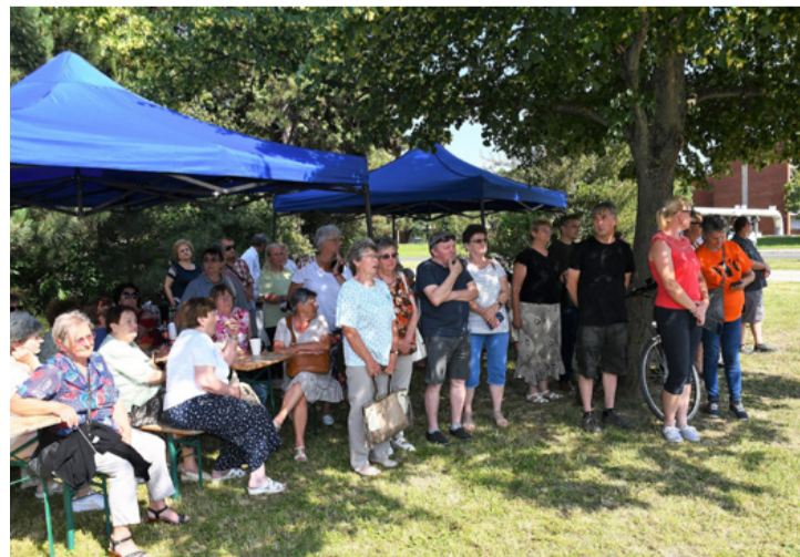
Sok egykori videotonos érkezett a szoboravatóra