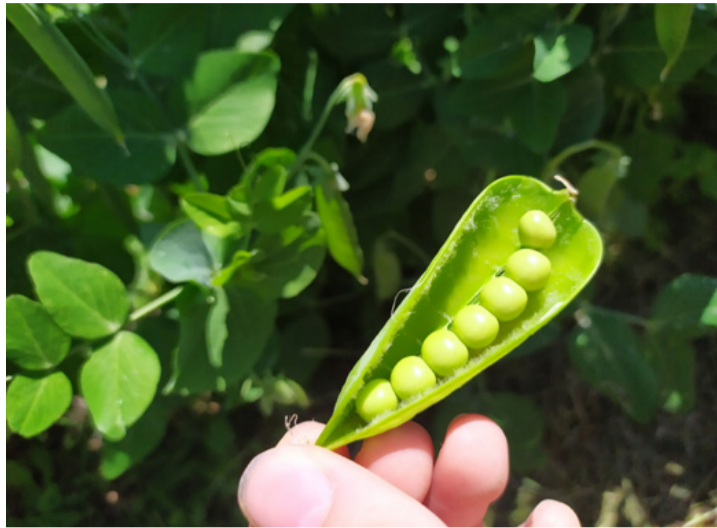
„A borsó, meg a héja...”