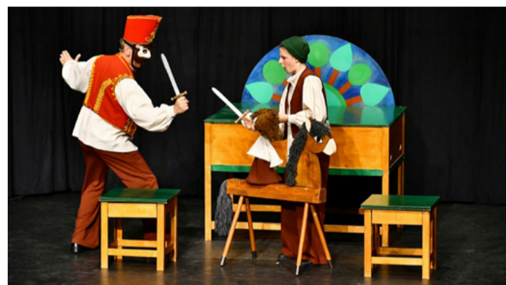
Egyszerű eszközökkel is magával ragadó előadást produkált a Pegazus

Május utolsó napján mutatta be a pápai Pegazus Színház a „Terülj, terülj asztalkám” című zenés bábjátékát az ajkai óvodások nagy örömeire a művelődési központ színháztermében. Az évad utolsó, bérletes előadása méltán aratott nagy sikert a gyerekek körében, akik az első pillanattól kezdve élvezték az előadást.