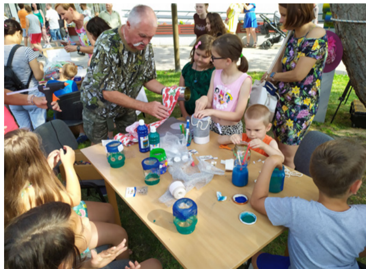
Korosztálytól függetlenül mindenki lelkesen vett részt az újrafelhasználásban

■ „Találkozz a benned élő művésszel” volt a mottója a Bazalt és Plasztik utcai alkotó napnak az Agórán. Hiszen semmi nem szemét, mindenből lehet valami újat készíteni.