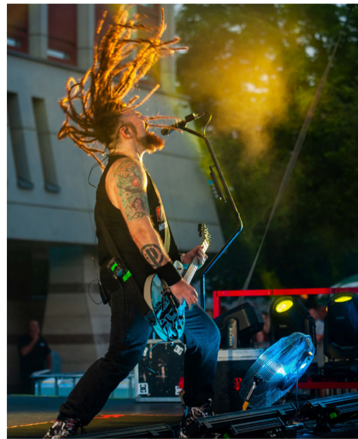
Méltó zárása volt a pünkösdi fesztiválnak a Tankcsapda fellépése

A többször bizonyított mondás szerint „a jó bornak nem kell cégér”, ennek ellenére ezt most mégis meg tesszük. Somlói borászok nélkül nem lett volna teljes a borfesztivál, így a Szalai Pincészet, a Csordás-Fodor Borház, a Bogdán Birtok Borászat és a 5 Ház Birtok különböző évjáratait kóstolhatták a jó minőségű italok szerelmesei. Aki megszomjazott a délután folyamán, a borok mellett csapolt sörrel, üdítővel, vagy éppen édes fagyalattal frissíthette fel magát. A közkedvelt Lángos Bárnak is bőven adtak munkát az időközben megéhező vendégek. Az Építők étterem dolgozói pedig fáradhatatlanul sütötték a tócsikat, amit változatos feltétekkel kínáltak. Nem meglepő, hogy a vasárnap esti program végére a nagy hőség sajnós megtette hatását, ugyanis egy szorgalmas hölgy rosszullete miatt a mentőknek is volt egy kis munkájuk. Szerencsére na-