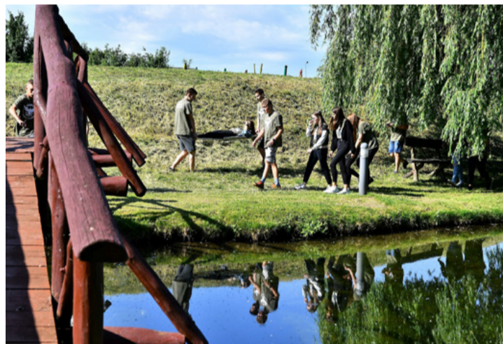
Sérültet mentenek a kadétek

Az első állomáson még a parkban, a tó közepén levő szigetről kellett a bajba jutott társukat kimenteni, mielőtt az ellenség felderítői a helyszínre érkeznek. Ott a szigetre való bejutás, a bajtársuk menthető állapotba hozatala, valamint a sérült szállításának megszerzése, kivitelezése volt a fel-