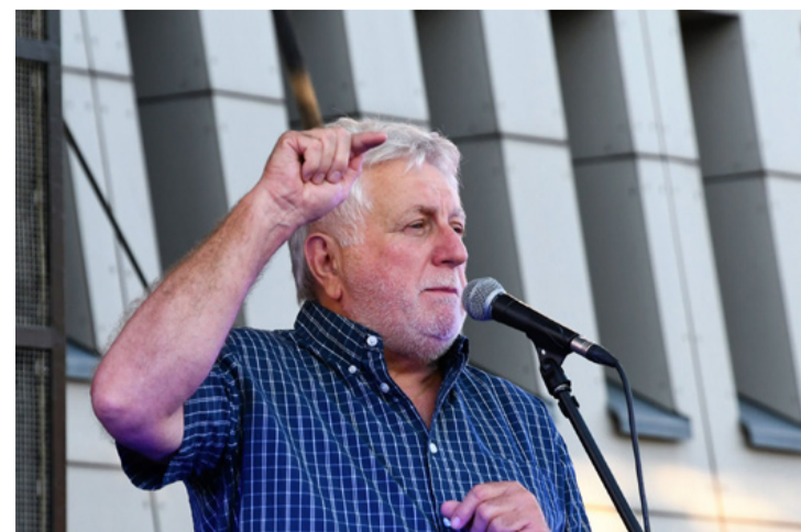
Óriási ováció követte az alpolgármester bejelentését: jövőre már a megújult Városligetben ünnepelhetjük a Pünkösdot