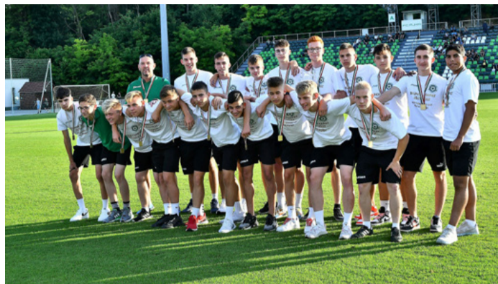
Az U17-es „majdnem veretlen” bajnok csapat

A Regionális U19 Közép-nyugat csoportban is kőkemény párharcok zajlottak le a szezon során, és az FC Ajka is nagy cápanak számított, csak úgy, mint a Főnix-Gold FC és Veszprémi Foci Centrum USE. Az ajkaiak 28 mérkőzésből 23-at nyertek meg, négyszer pontoztokodás lett a vége, illetve egyszer szenvedtek vere-