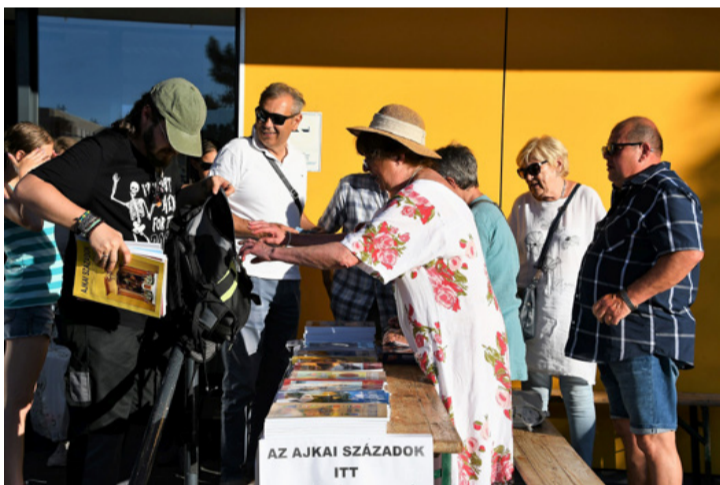
Nagy volt a forgalom az Ajkai Századok standjánál is