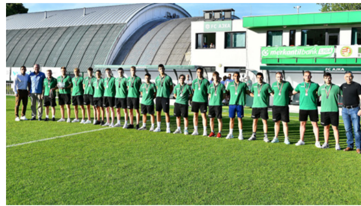
Az U19-eseket már a „nagy csapat” is kóstolgatja