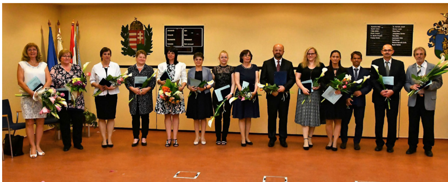
A kitüntetettek a „családi fotón”