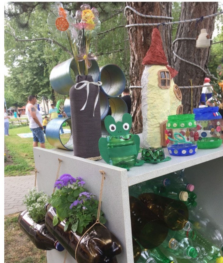
PET palackok metamorfózisa