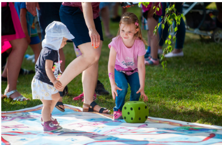
A legjobban talán a legkisebbek élvezték ezt a csodaszép együttlétet