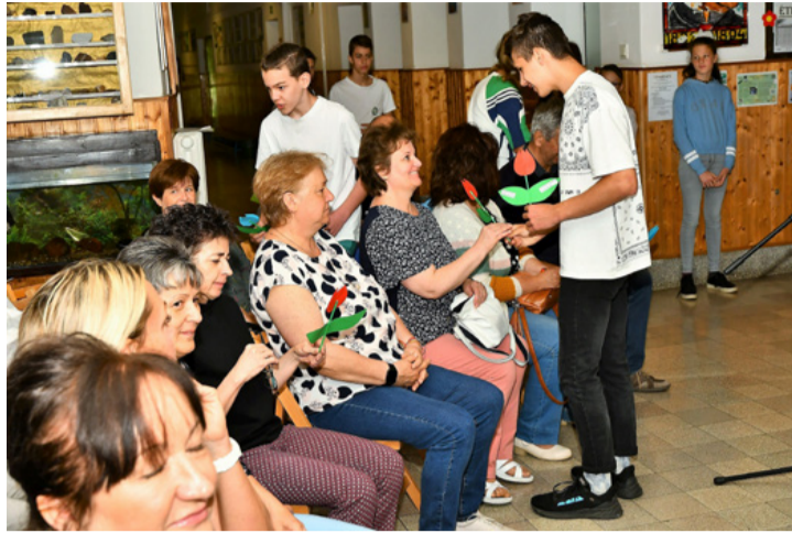
Minden ünnepelt egy diákok által készített tulipánt kapott

A pedagógusi munkát a csendes esőhöz lehet hasonlítani, amely jó sokáig tart, áztatja a földben megbúvó magokat. Azok magukba szívják a nedvességet, majd termőre fordulnak, de nem minden mag azonnal, van amelyik később, de annál nagyobb termést hozva. (És van, amelyik nem kel ki – L. S.)