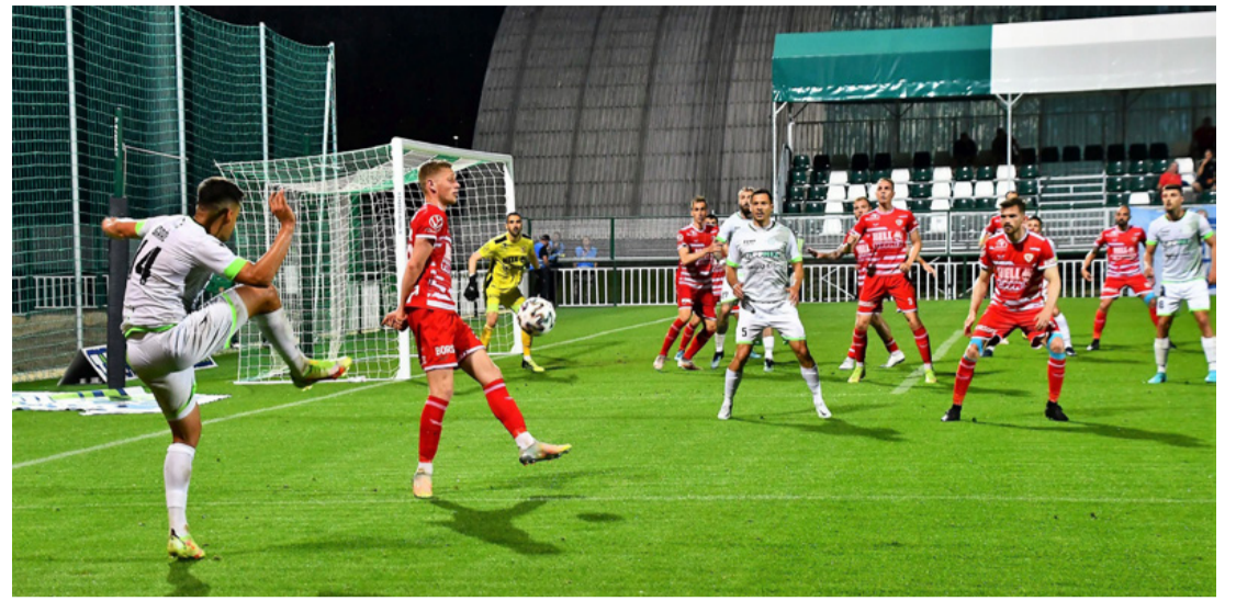
Gaál beadás. Ebből sem lett gól