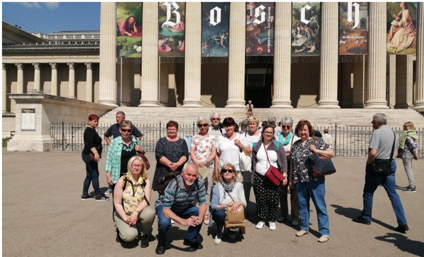
LibLing Olvasókör tagjai a Szépművészeti Múzeum bejáratánál