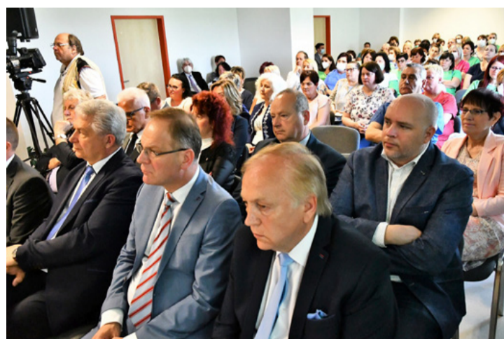
Az első sorokat főleg a Fidesz politikusi töltötték meg, mintegy demonstrálva, hogy az egészségügy irányítása jó kezekben van