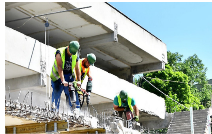
Három munkás éppen a teraszt bontja, ami kisebb is lesz, mint korábban volt

A munkálatok jól haladnak – kaptuk a tájékoztatást Navracsics Tibor országgyűlési képviselőtől. Ő egyébként ko-