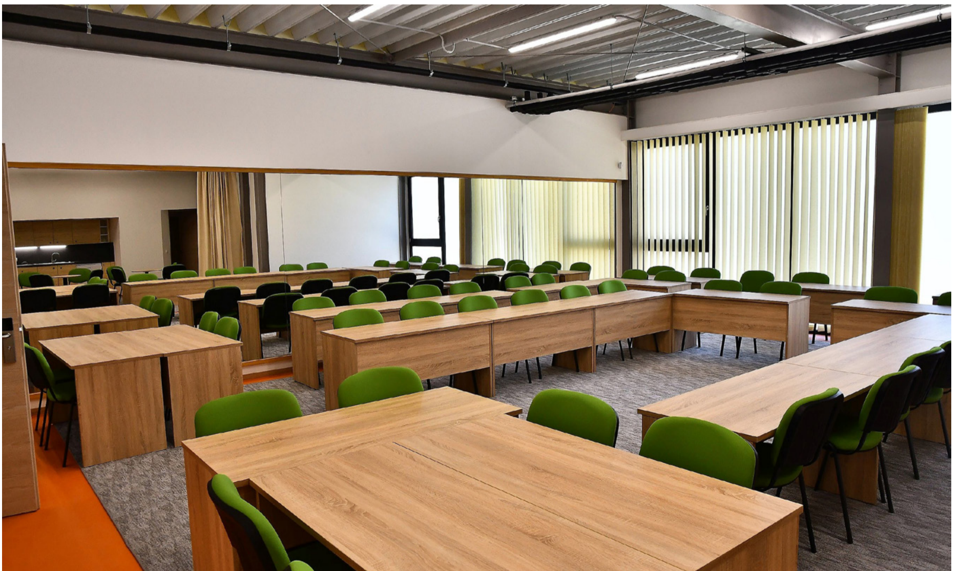
A zöld előadóterem. Várja a hallgatókat