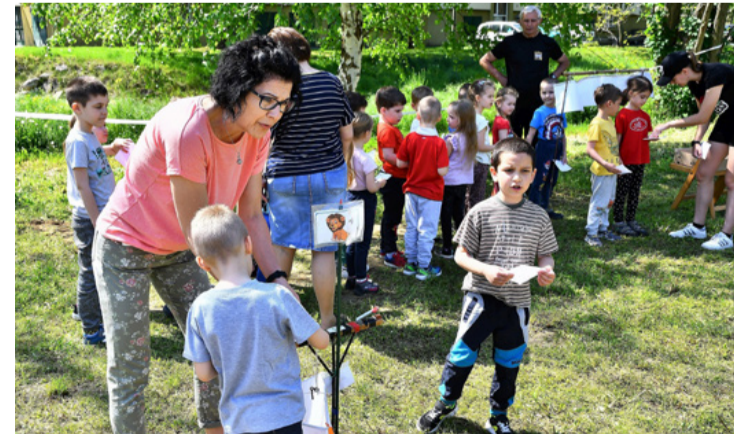
Tájékozódás képről és térképről