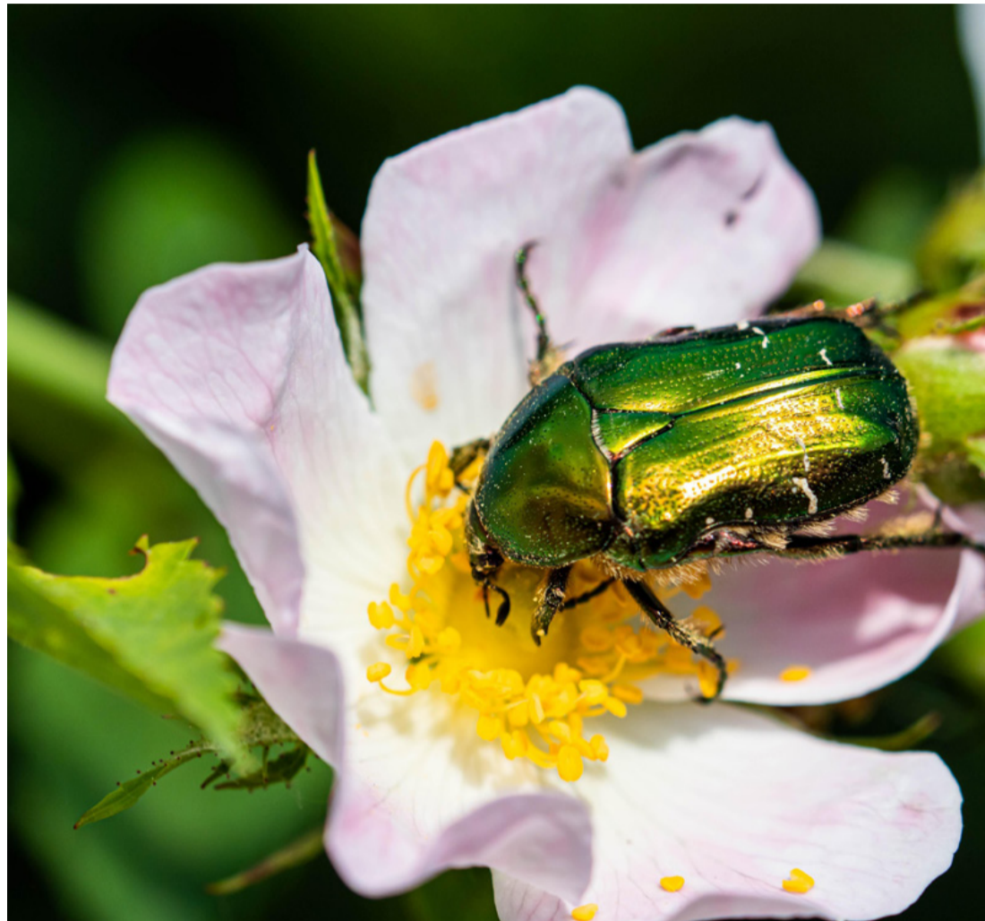
A rózsabogár szelíd rovar és segít a komposztálásban is