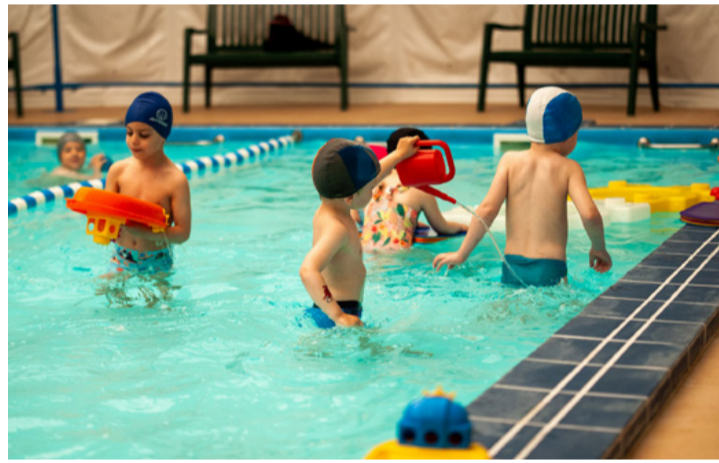
A vízzel való ismerkedésbe beleférnek a hagyományos játékok is