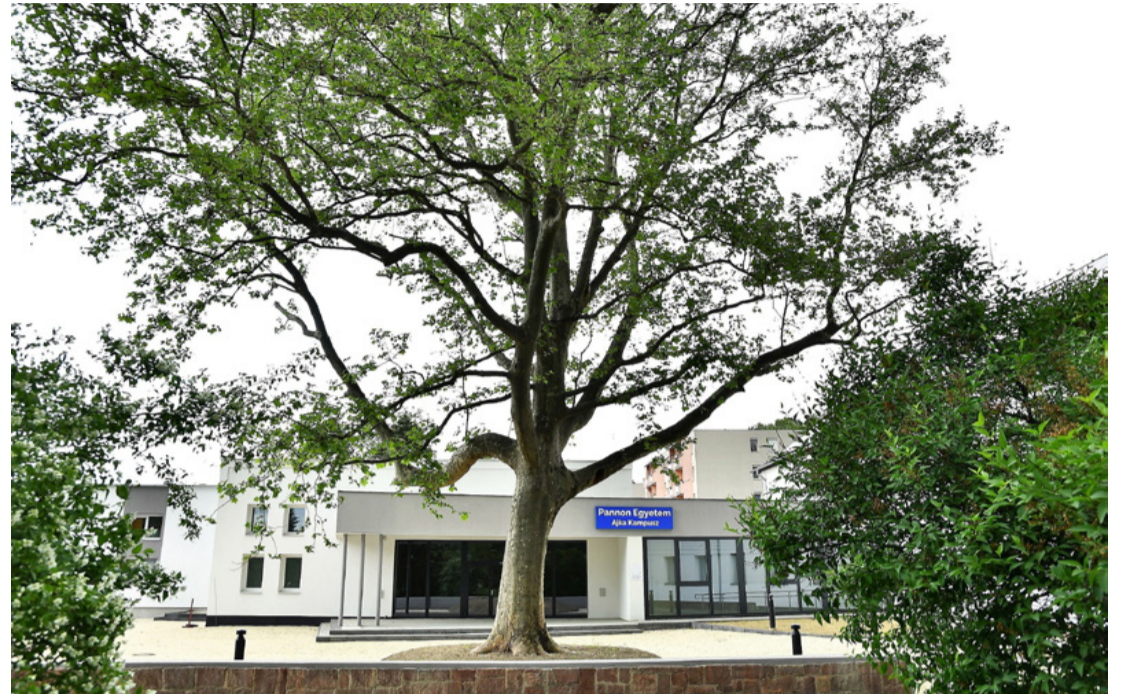
Akár jelkép is lehetne a csaknem százéves platán, a „tudás fája” a kampusz előtt

utca-Petőfi utca-Gyár utca körforgalomba kerül az az egykori Videotonnán álló szobor, ami egy munkásnőt ábrázol, táskarádióval a kezében. (Modellje még él.) Tökéletesen alkalmasnak tűnik a környék sajátosságaihoz illő „retro” hangulat megidézésére.