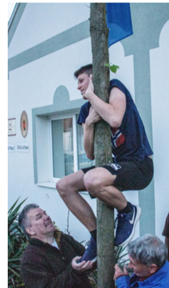
Próbamászás a májusfán

A májusfa egykor szerelmi ajándék is volt, amit a legények éjjel a hajdonok ablaka előtt,