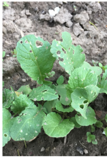
A reteklevélen a lyukas közönséges földibolhák jelenlétét jelzik

Jó megoldás a növénytársítás vagy ha csalogató növényt ültetünk a megvédendő növény közé. Ilyen csalogató lehet a mustár vagy sarkantyúka. Ezeket azért hívják csalogatóknak mert, amíg lakmározzák a rovarok őket, addig nem bántják a számunkra fontos vetést. Védő zöldségnek ültethetünk salátát. Mivel a salátának azonos vizigénye van a retekkel, és a saláta na-