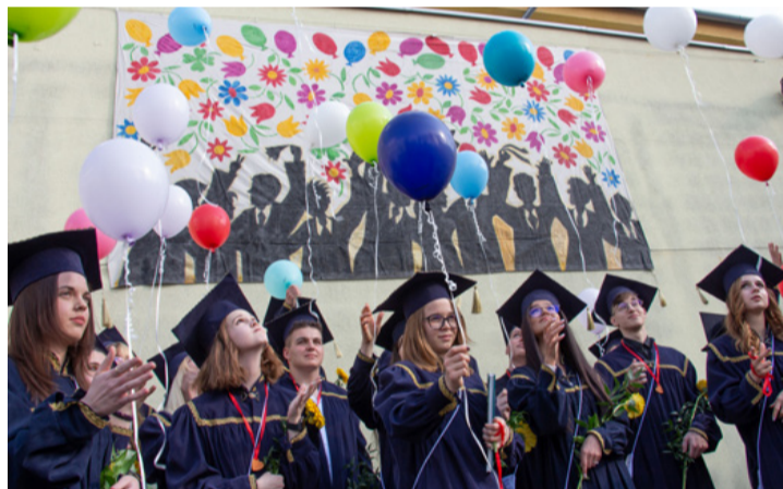
Idén is magasra szálltak a kívánság-lufik

Igyekeztek megérteni mindent, de egy-egy terü-