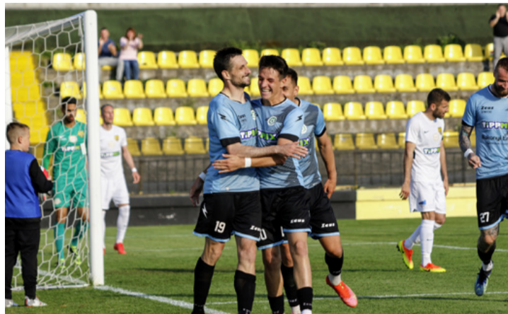
Gólöröm Soroksáron – faink háromszor ünnepelhettek

■ A Merkantil Bank Liga 35. fordulójában a Soroksár otthonában, a Szamosi Mihály Sporttelepen lépett pályára az FC Ajka csapata a Sori ellen. A két csapat jó győzelmi szériával várhatta a találkozót, a hazaiak négy, a vendégek három meccs óta nem találtak legyőzőre.