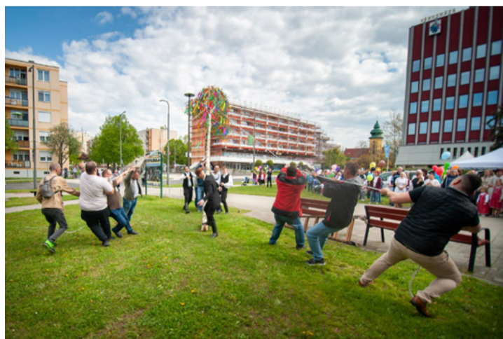
Májusfa állítás az Agorán