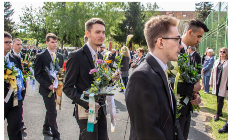
Mindegyikük tarisznyájában ott van a képzeletbeli marsallbot

A végzősöknek a 11-esek búcsúüzenetét Polgár Károly