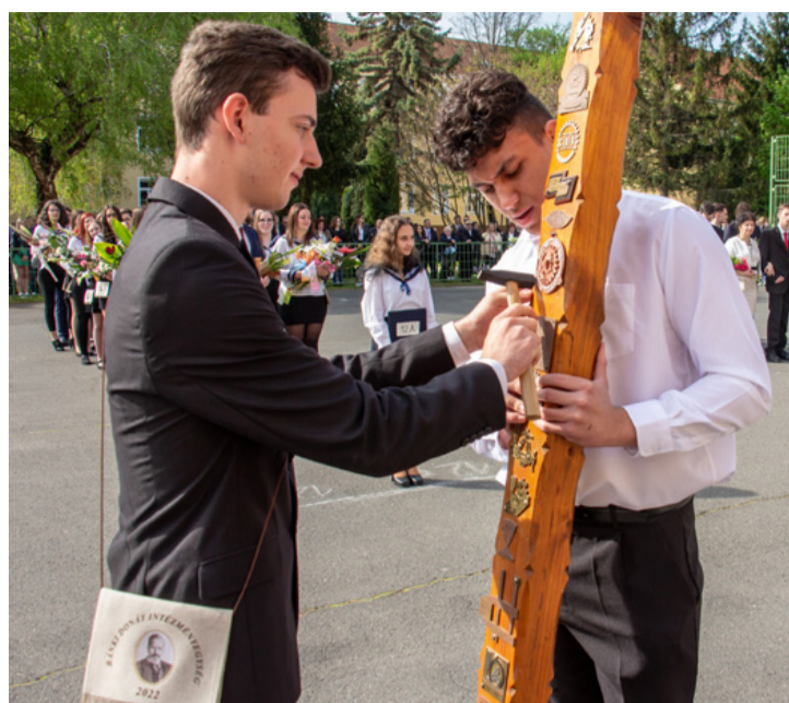
Embléma őrzi a kopfáján az idén végzettek emléket is

A végzős növendékek elérkeztek életük jelentős állomásához a ballagáshoz és a szakmunkás vagy az érettségi vizsgák elé. A héten már számot kellett adniuk arról, amit a középiskolai évek alatt tanultak. Megszéppenve néha kicsit pityeregtek is, ahogyan