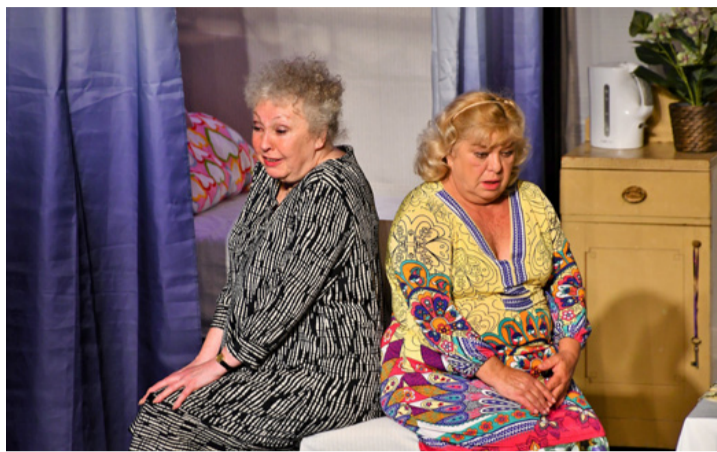
Két karakter, két jellem összezárván egy nagy élményt jelent

debbé teszi a néző számára, az a humor, a bolondozás, egymás kifigurázása. Nincs panaszkodás, sóhajtozás, de vannak közös örömeik, apró élvezetek. Ez egy olyan darab, ami az emberben nyomot hagy, olykor megnevetet, mégis felkavar. Ajánlanám a pároknak, hogy közösen nézzék meg, ha lesz rá lehetőségük. Együtt talán könnyebb szembesülni a döntéseink következményeivel, az időskor nehézségeivel, a halál gondolatával és boldoggá tehet bennünket az egymásnak