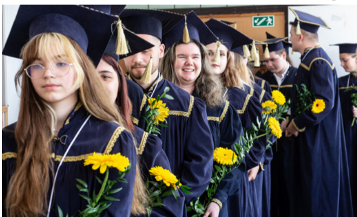
Eljött ez a pillanat is