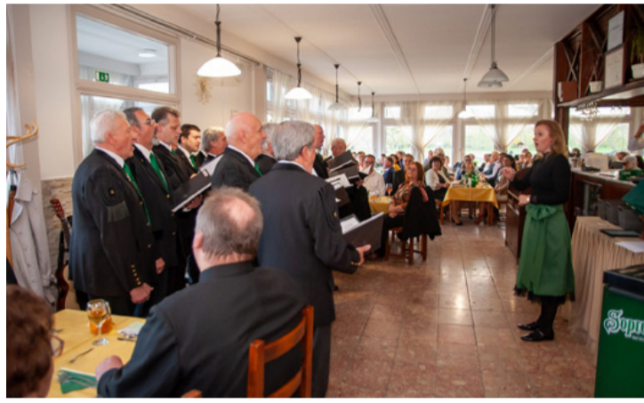
A jótekonysági estét a Padragi Bányász Férfikórus fellépése színesítette