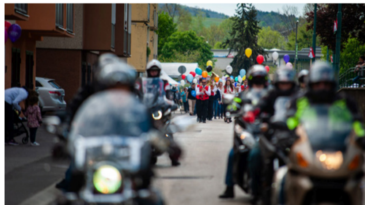
A hagyományos felvonulást a motorosok és bányászfúvósok vezették