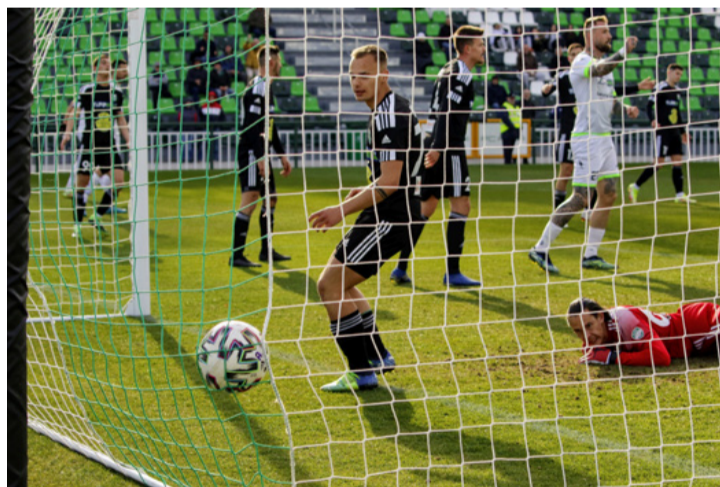
Végre a hálóban a labda, ezzel győzött az Ajka

■ A Merkantil Bank Liga 32. fordulójában az FC Ajka a Szombathelyi Haladást fogadta. A két csapat az utolsó öt bajnoki mérkőzésén hasonló teljesítményt nyújtott, ugyanis négy pontot sikerült begyűjteniük.