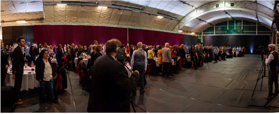
A résztvevők a Himnusz hallgatják