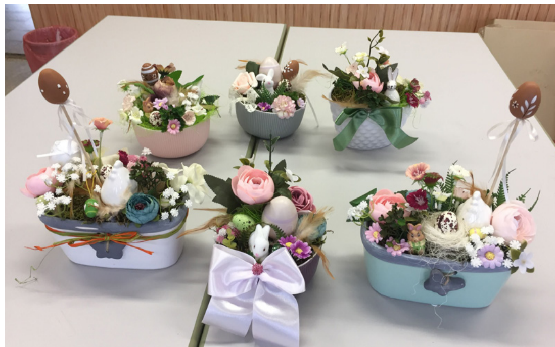
Mustra a legjobban sikerült alkotásokból