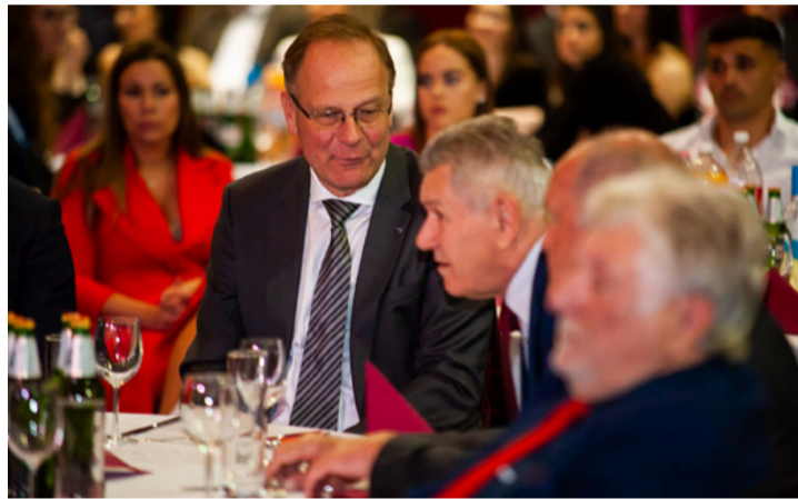
Akiken sok múlik a sportéletben (is)

első osztályba vagy extraligába jutott asztalitenisz, sakk, teke pedig túl is szárnyalta. Az eredményekhez létesítményekre is szükség van. A társasági adóból a vállalkozók által felajánlható összeg nagy segítség, mióta lehet igényelni, csaknem 10 milliárd forint értékű fejlesztés zajlott. Elkészült a fedett uszoda, a jégcsarnok, legutóbb a kosárlabda csarnok. Tervben van egy asztalitenisz csarnok építése és a lőtér fejlesztése, va-