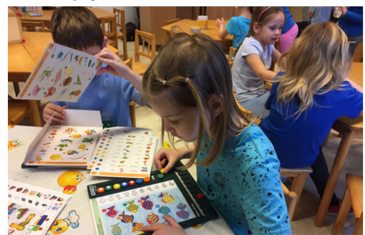
Az óvodában befogadó nevelés folyik

„Az inklúzió fogalma tágabb értelemben az adott közösségben lévő egyének sokszínűségének és bármilyen különbségének elfogadását és megbecsülését, és ezen keresztül az esélyegyenlőség biztosításának egyik legerősebb szintjét jelenti. Inklúzióval tekinthetünk egy társadalmat, egy közösséget vagy egy intézményt is. F. P. T. ■