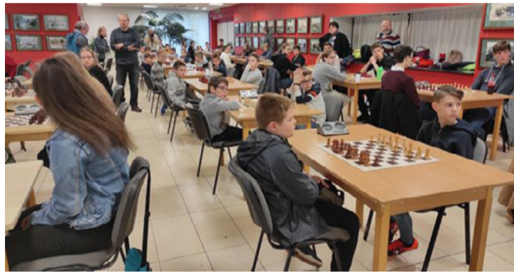
A harmincnégy asztalnál egymással szemben a jövő reménységei

■ A város sakk életének a megyében betöltött szerepét fémjelzi, hogy a Nagy László Városi Művelődési Központ és Könyvtár aulájában rendezte a Veszprém Megyei Sportszövetség Sakk-szövetsége és a Veszprém Megyei Diáksport és Szabadidő Egyesület a Megyei Diákolimpiát.