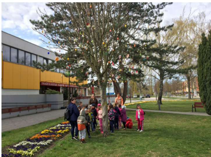
Országszerte így köszöntik a húsvétot. Kicsit az összetartozás jelképe is lehet