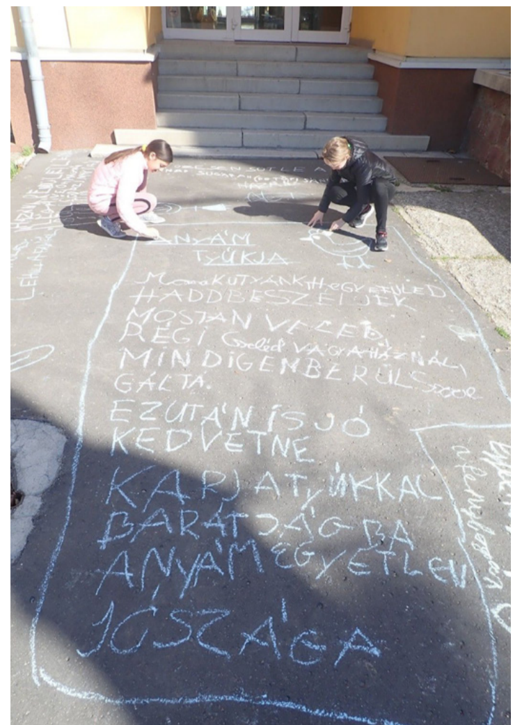
A gyerekek az iskola előtt versidézeteket írtak a járdára

A költészet napján a járókelők figyelmét is felhívták a jeles napra, amikor a diákok vers idézeteket rajzoltak az iskola előtti járdára. Cs.B.É. ■