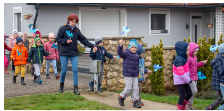
Talán még nem is sejtik, milyen fontos élményt jelent majd nekik ez a séta