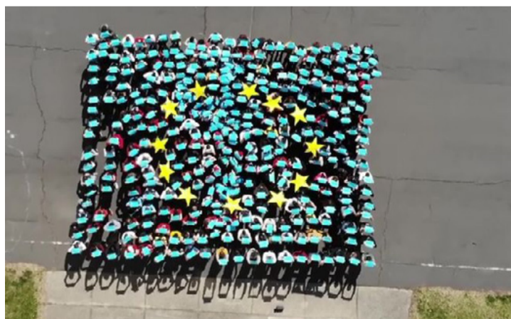
...és a levegőből

met állítottak össze. A videó az iskola közösségi oldalán is megtekinthető.