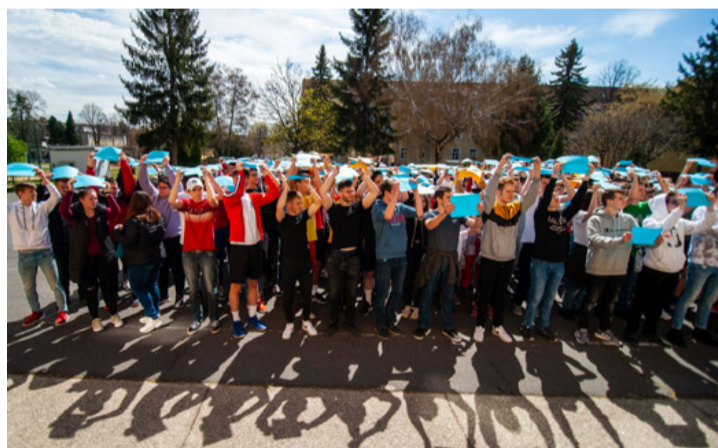
A földről...

Az előadások után a Csodavár Általános Iskola alsótagozatosaival közösen az udvaron téglalap formába álltak, középen az Unió zászlójában is látható tizenkét arany színű csillagot és világoskék lapokat tartottak a fejük fölé. A flashmobot drónfelvételen is rögzítették, amiből egy kisfil-