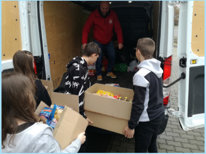
A gyerekek pakolták be a karitásztól autóba a csomagokat