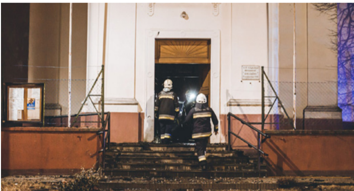
Azon a borzalmas estén tűzoltók árasztották el a tósokberéni templomot

■ Kiderült, hogy egy rejtélyes elektromos tűz okozta a február elején, a tósokberéni templom tornyában kiüttlött tüzet. Részletekbe a katasztrófavédelem nem bocsátkozott, így továbbra sem tudni, hogy egy hibás kapcsolótábla, vagy sérült vezeték, vagy gondatlan tervezés az oka a tűznek, de ebben a tárgyban tovább érdeklődünk az illetékeseknél.