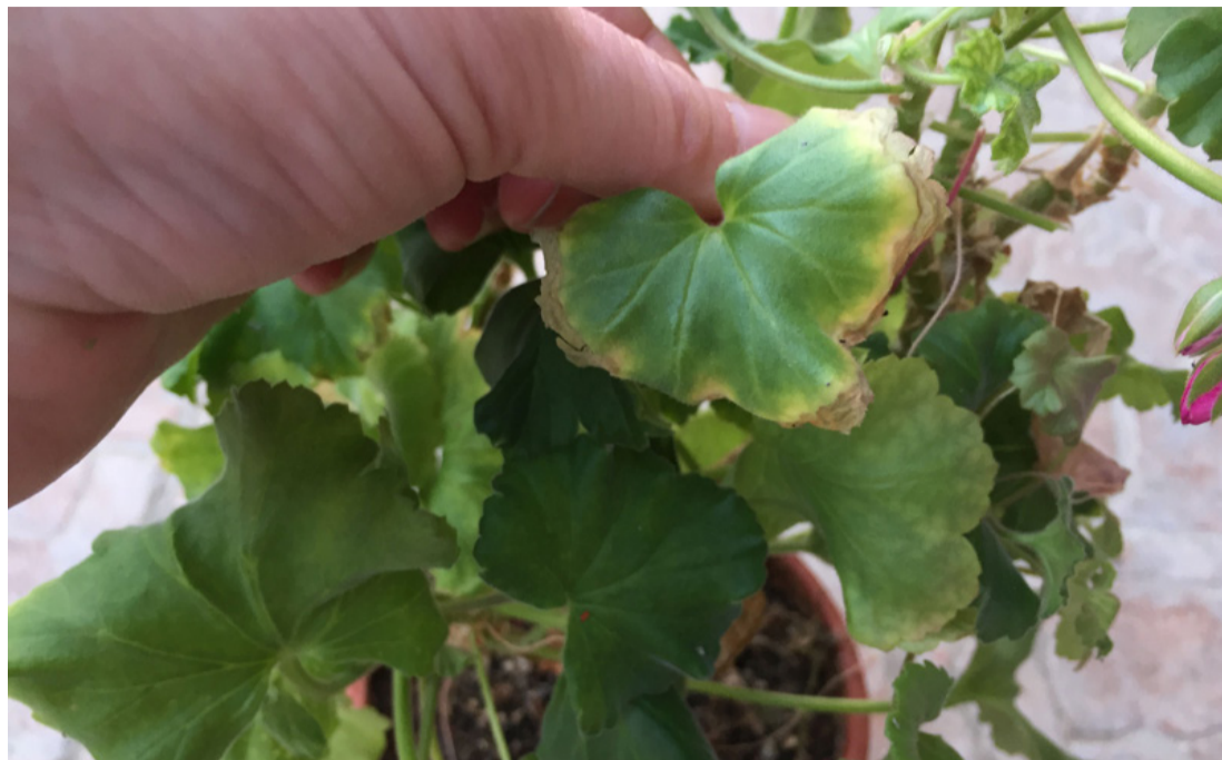
A muskátlinál is fő az egészség!