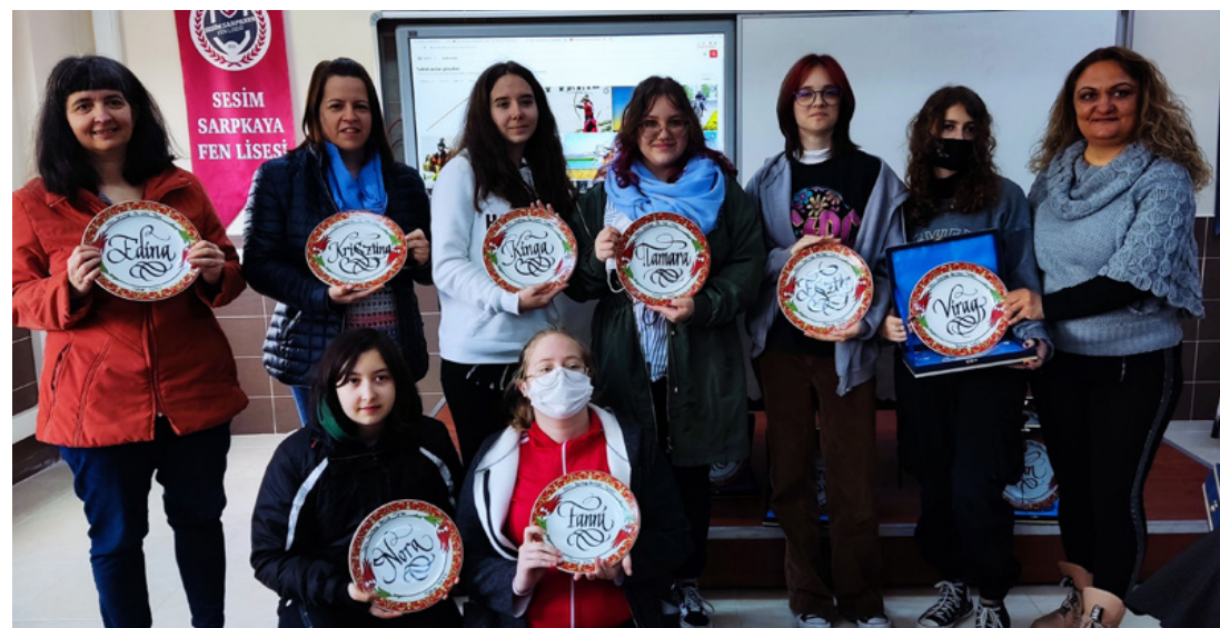
A győztes csapat