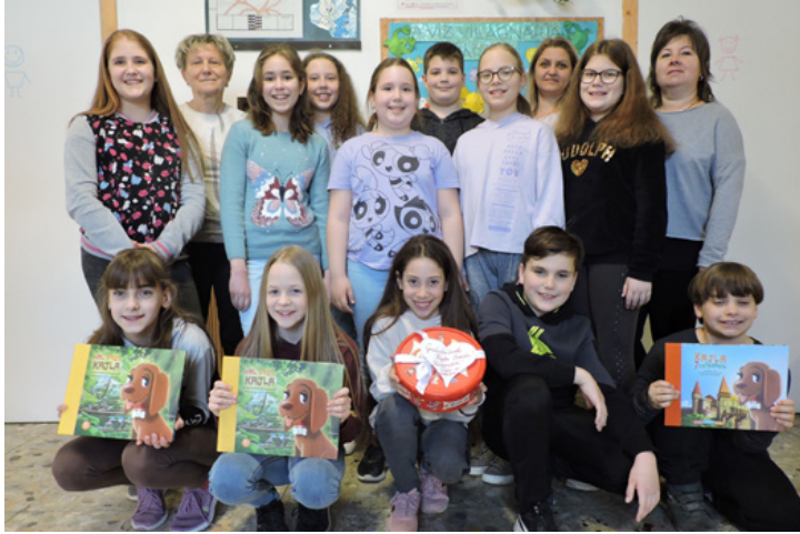
A milliomas „kajlák”

■ Az Oktatási Hivatal január elején ismét meghirdette a harmadikos és negyedikes osztályoknak az Országos Kajla Bajnokságot : megyénként a három legügyesebb osztály indulhatott a 20 db, egyenként 1 millió forint értékű, felejtethetetlen osztálykirándulásért az online, élő elődöntőben, a két legjobb csapat pedig játszhatott a fődíjért a TV-s döntőben.