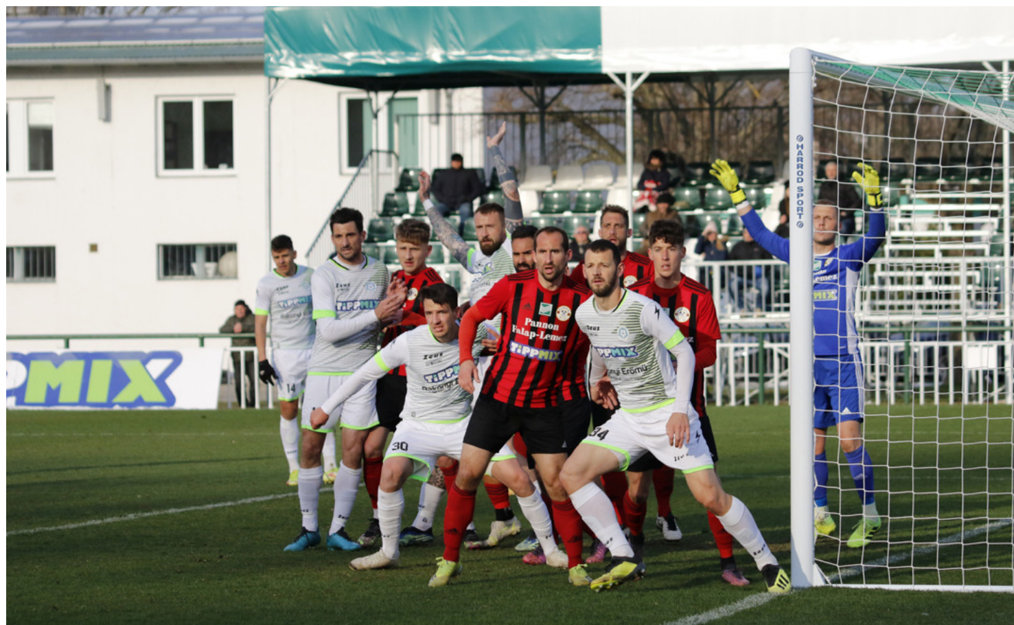
Madách-csal szólvá: „Az élet küzdelem, s az ember célja e küzdelem maga...”