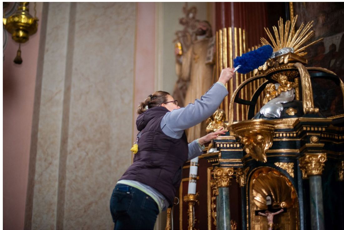
Kellő tisztelettel az oltárt is megtisztították

A munkákból több képviselőtestületi tag és azok csa-