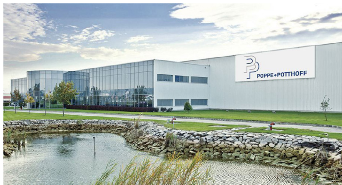
Már az ajkai telep udvara is a természetszeretettel hirdeti