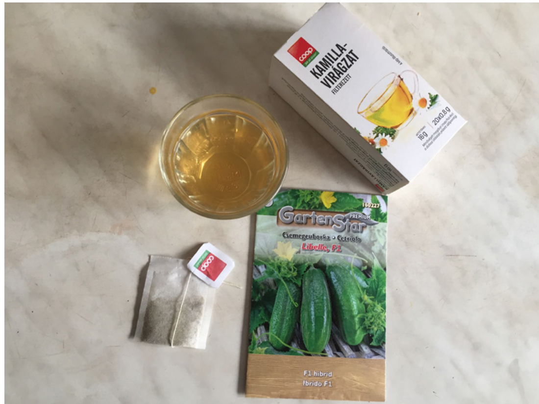
Tavasszal a filteres kamillatea is megteszi