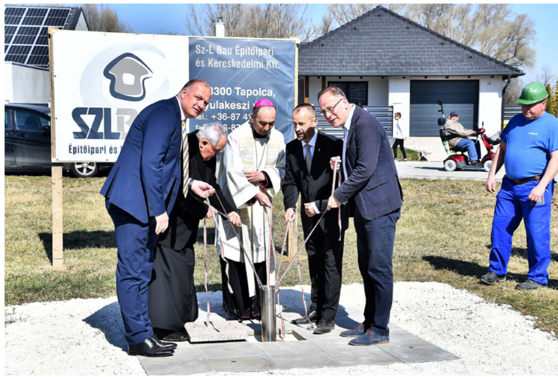
Az építő, a lelki igazgató, az érsek, az igazgató és az állam képviselője helyezte el az alapkövet

■ Újabb jelentős beruházás alapkövetétele történt március 23-án Tósokberénden. A Tálás utca és a Gergőföldi utca kereszteződésében lévő szabad területre óvodát építenek, a Veszprémi Érsekség és a kormányzat szerencsés találkozásával.