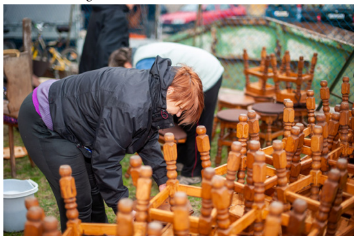
A szabadtéren is folyt a munka

elmondta, hogy az elkövetkezendő ünnepeket, az első áldozást és a bérmálást már a templom falai között szeretnék megtartani. Cs.B.É. ■