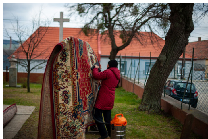
A nehéz szőnyeget nem is olyan könnyű kiporszívózni