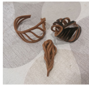
Különböző bőrből rendkívül változatos tárgyak állíthatók elő