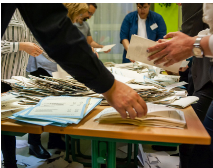
Urnabontás a Fekete – Vörösmarty iskolában. Itt még sokan tippeltek az ellenzéki erő győzelmére.

Az ügyelet címe: Ajka-Padragkút, Iparos u. 8. Tel.: 88/412-104. Csak telefonos bejelentkezést fogadnak, és a helyszínen csengetéssel kell jelezni az érkezést! A váróteremben egyszerre két fő tartózkodhat, és tartani kell a 2 méteres védőtávolságot. A rendelőbe való belépéskor szájmász használata kötelező!