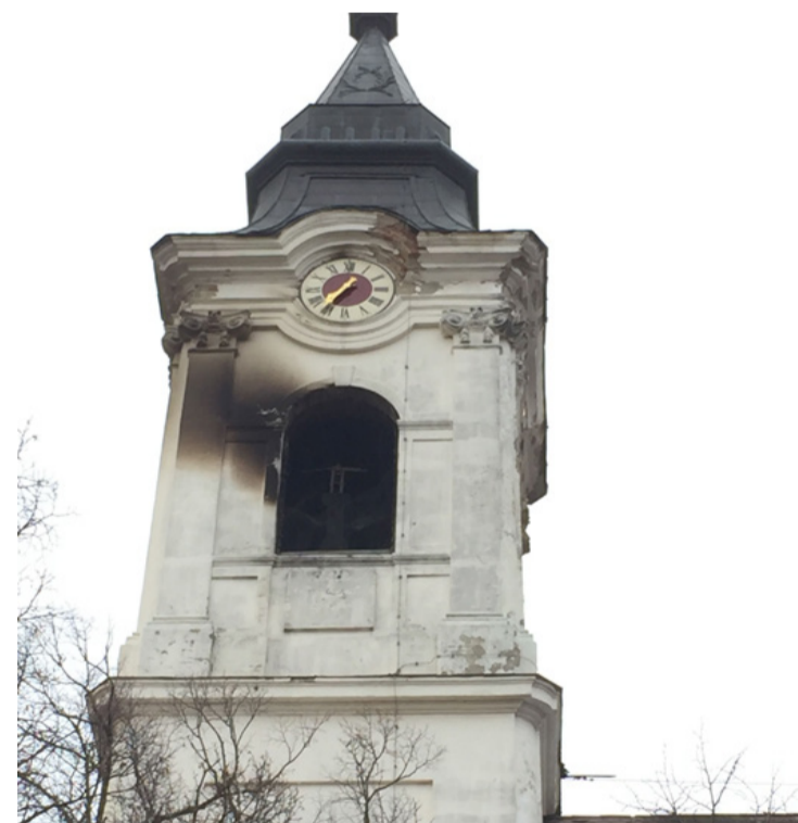
Ez nem pokoltűz volt, csak „tisztító tűz”?

Hogy nagyobb baj nem történt az a nagy szerencsének és Isten ajándékának is köszönhető – mondták szerényen az