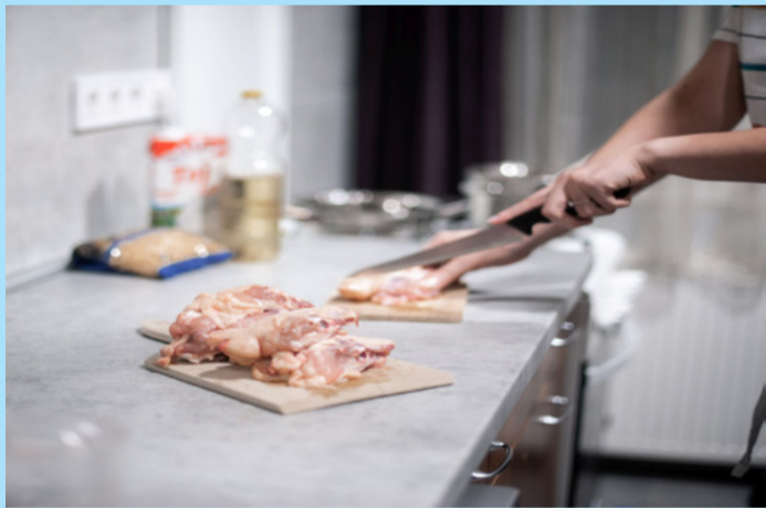
Hannibál elefántháton, Árpád lóháton, Orbán csirkefarhátan lovagolt be a történelembe?