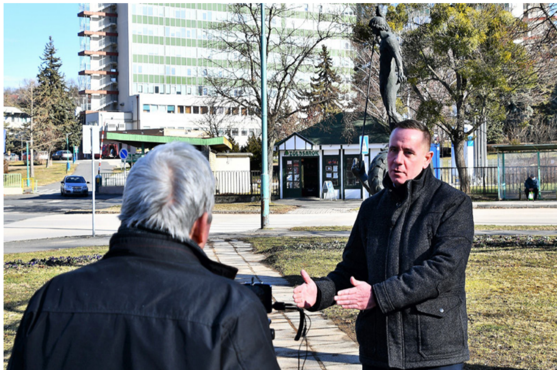
Rig Lajos ezúttal a Magyar Imre Kórház előtt tartott sajtótájékoztatót mondandója alátámasztására

■ Rig Lajos legutóbb nem mint országgyűlési képviselő, hanem mint „a körzetben élő állampolgár” és mint „egészségügyi dolgozó” állt az Ajka TV kamerája elé a Szenttől szembe legújabb műsorában. Mondandója kiindulási pontját jelentette, hogy egy év alatt 17 ezer egészségügyi dolgozó hagyta ott állami munkahelyét, pótolhatatlan űrt hagyva maga után.