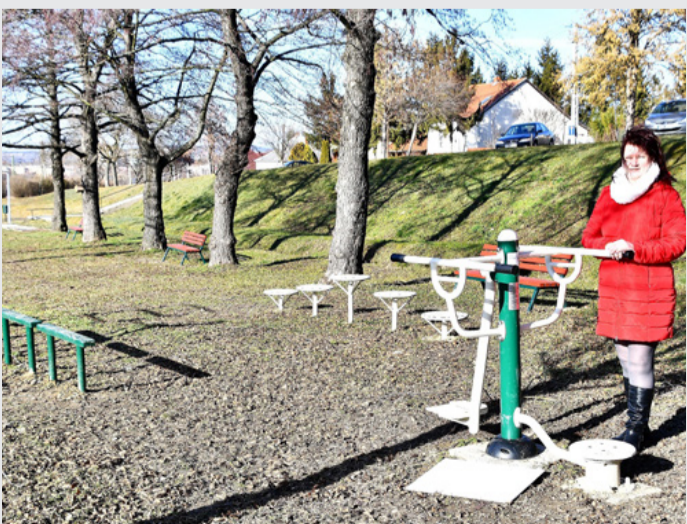
Pethő Anita és a fitnesspark egy részlete