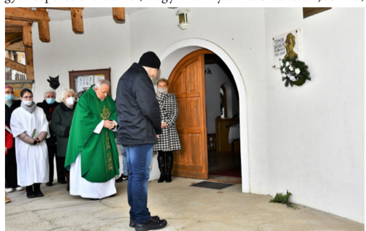
Főhajts a csingervölgyi kápolna falán elhelyezett emléktábla előtt

Február 6-án reggel a közösség nem feledi egy szentmise előtt Bakos Frigyes esperes szövegét arról, hogy