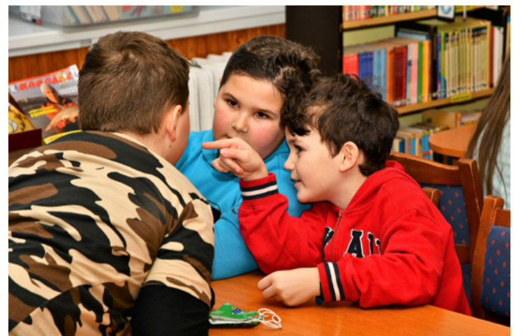
A gyerekek csoportokban oldották meg a feladatokat

A Csodavár Általános Iskola 3. osztálya a havi kölcsönzésükön túl maci foglalkozáson