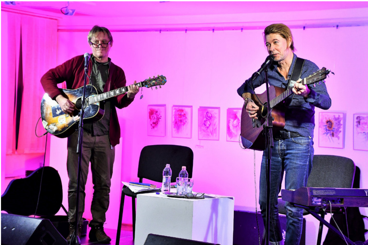
Költészet és zene ezen az estén kéz a kézben jártak