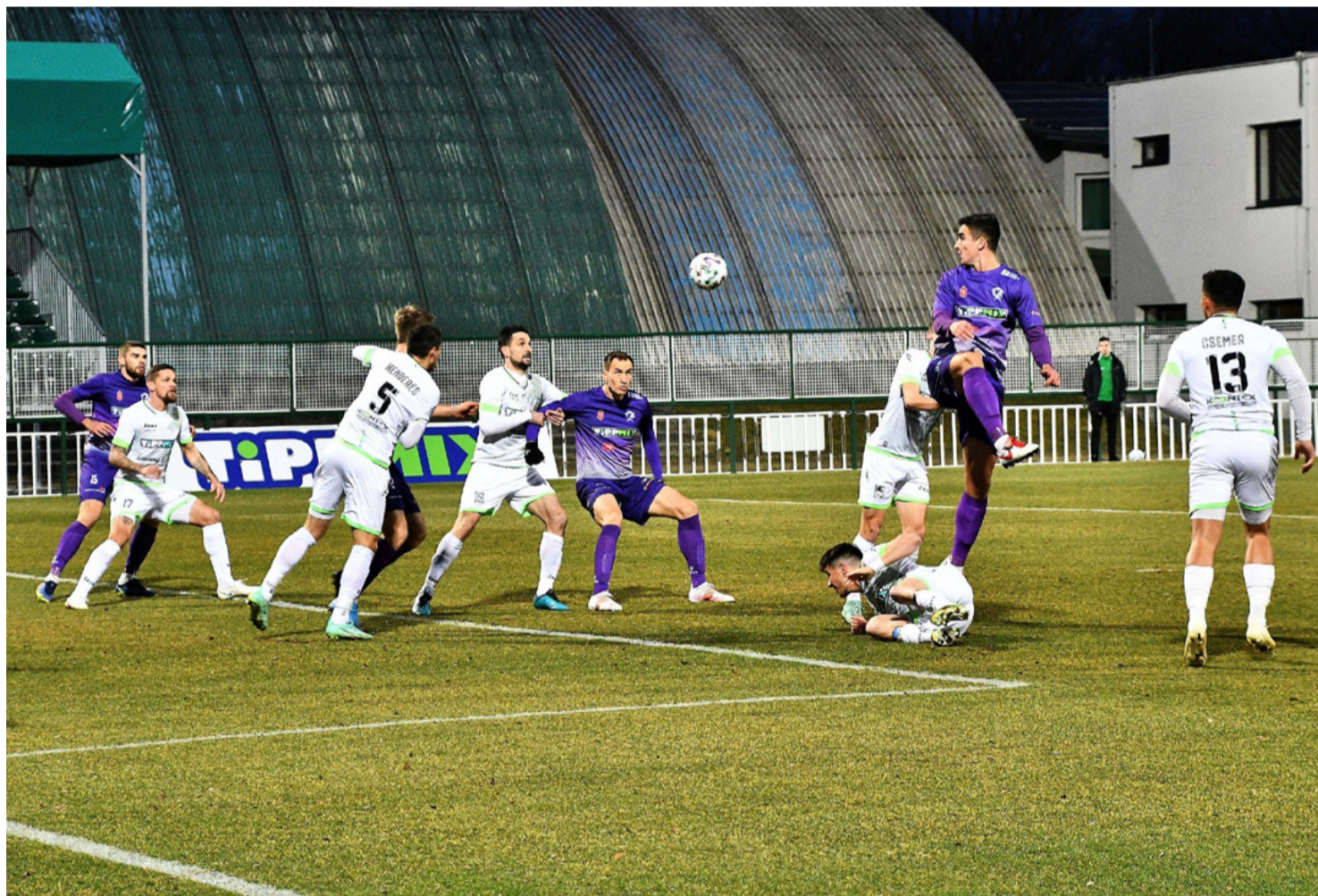
Hősiesen küzdött az Ajka, de veresége borítékolható volt