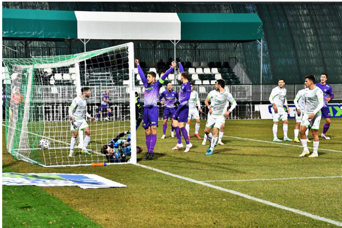
Háromszor is örülhettek a lilák