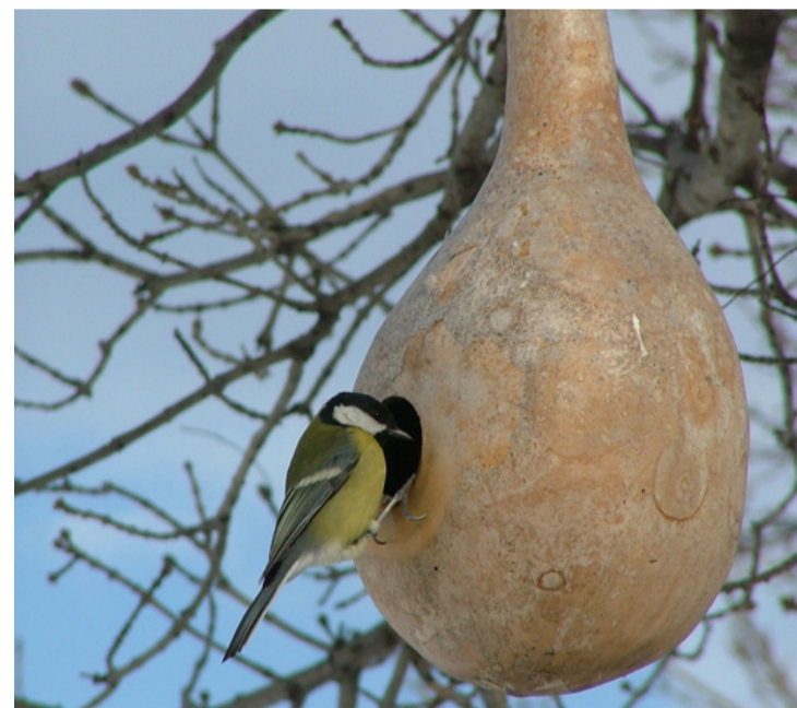
Egy széncinege szemügyre veszi a fára függesztett töklakást. Lehet, hogy ez lesz az?