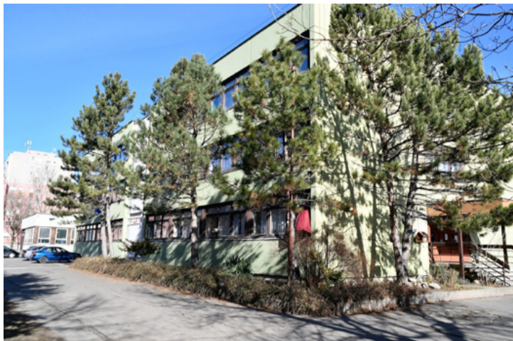
A környezettudatosra nevelő ökoiskola fenyők mögött búvik meg

■ Nehezebb a döntés a leendő első osztályosok szüleinek, ugyanis a járványhelyzet miatt a máskor megszokott és látogatott nyílt napokat sem tarthatják meg a hagyományos formában az iskolák. Az iskola honlapjára vagy közösségi oldalára kitett bemutatkozás segíthet, de nem biztos, hogy választ ad az ilyenkor felmerülő számos kérdés mindegyikére. Ajánk 5 általános iskola várja a leendő elsősokeket. Mindegyik jó színvonalú, de a legjobb, ha a megfelelő érdeklődésű és képességű gyermek kerül oda. A megkérdett szülők leginkább a gyermek érdeklődési körét veszik figyelembe az iskola választásnál, és sokan döntenek az ő egykori iskolájuk vagy hajdani tanítójuk mellett, ha szép emlékeket őriznek róluk. De vajon az iskola minnek alapján dönt, ha túljelentkezés miatt nem tud mindenkit fogadni? Sorozatunk ötödik – befejező – részében a Fekete István-Vörösmarty Mihály Általános Iskola és Gimnázium mutatkozik be.