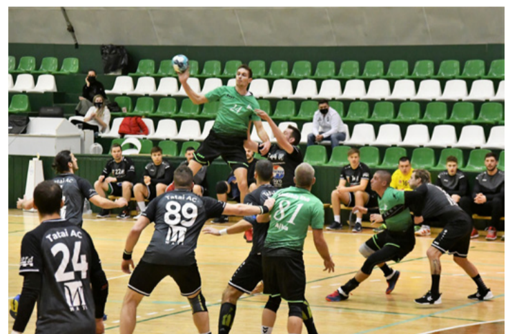
Fentről minden jobban látszik

Négy nappal később a férfiak a bajnokság egyik favoritjával mérhették össze tudásukat, mégpedig a Tatai Atlétikai Clubbal. A tatai csapat 9 mérkőzésen 7-szer