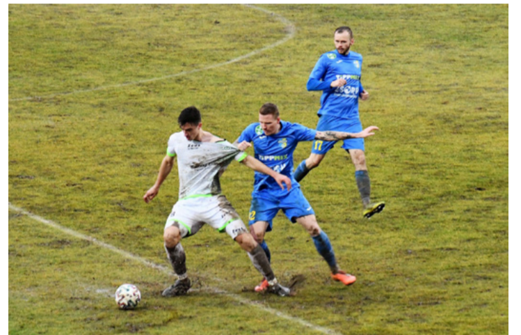
Csak a két tengeri kígyó hiányzik a „Laokoön-csoportból”