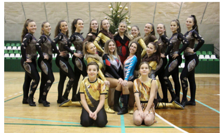
A virtuális térben is versenyeznek, de hús-vér táncosok

Online világkupán méri össze tudását más országok legjobbjaival a Dinamik Rock and Roll Klub Remember felnőtt nagyformációja február 20-án. Az egész világot érintő járványveszély miatt jelenleg csak ebben a formában tudják megtartani a nemzetközi versenyeket. A lehetőséget minden nemzetnél az országos ranglista első 10 helyezetteje kapja. Az ajkaiak a magyar ranglista negyedik helyén állnak. Az online verseny nem adja vissza azt az élményt, amit az utazás, a személyes jelenlét nyújt, de az eredmény és a zsűri értékelése visszajelzés a csapatoknak arra, hogyan állnak a felkészülésben. A versenyt az elődöntőkkel délután 2 órakor kezdik, a döntőt 6 órától a megadott linken az interneten kísérhetik figyelemmel. A csapatoknak két felvételt