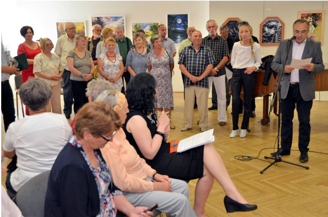
Idén elmaradt a kultúra napi ünnepség. Ez egy régebbi kiállításon készült fotó

■ Nehéz évet zárt városunk közel száz civil szervezete (csoport, klub, egyesület és kör) tekintet nélkül arra, hogy közhasznú, vagy többnyire saját kedvtelésének hódoló közösségről van szó. Év elején bizakodva tervezték programjaikat, közben el sem tudták képzelni, hogy működésükben olyan időszak következik, amely eddig soha nem tapasztalt módon lebénítja a társas együttléteket.