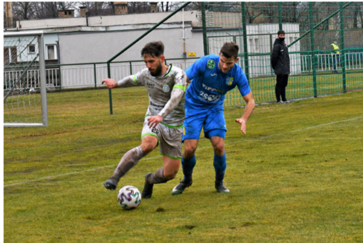
Ez a kép sokat elmond a felázott talajon vívott küzdelemről