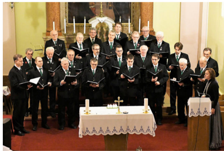
Nézni is, hallgatni is jó a Padragi Bányász Férfikórust

– Kevés idő állt rendelkezésünkre a kórusfarsang próbáira, mert már 2019. őszén, a Pécsi Bördalfesztivál után felkérést kaptunk a KÓTÁ-tól (Kórusok és Zenekarok, Népzenei Együtteseink Országos Szövetsége- VHA) egy nagyszabású rendezvényen való részvételre.