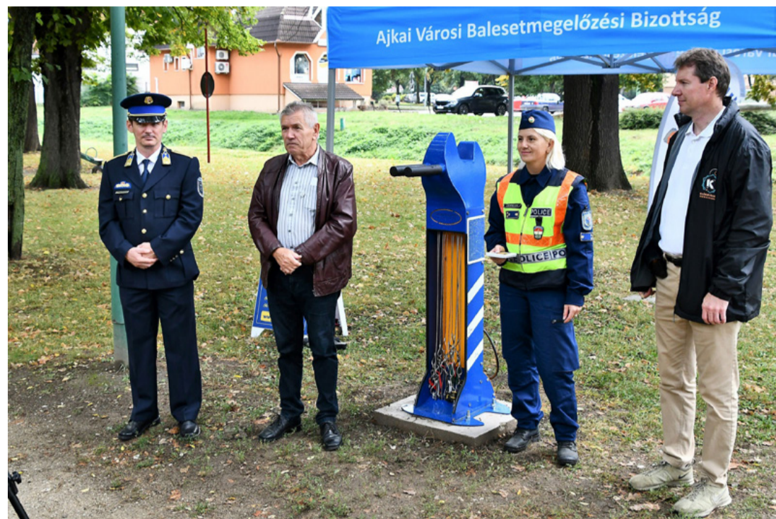
Biztonságosabb lett Ajkán a kerékpározás