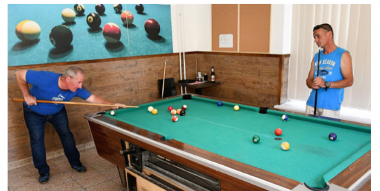
Erőtlen koncentráció a nyári villámversenyen