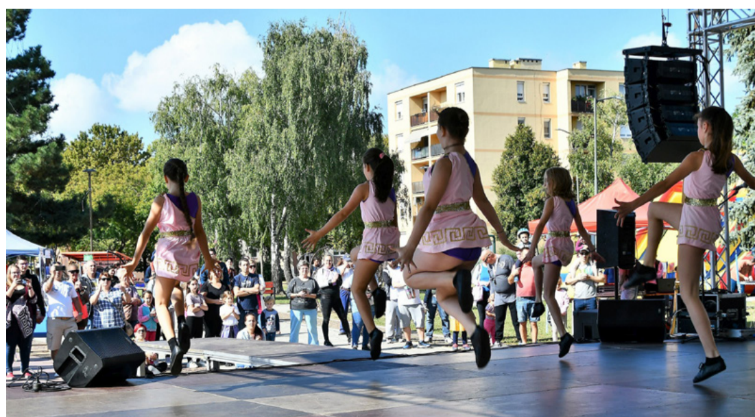
Jól szórakozott a közönség a napfényes időben