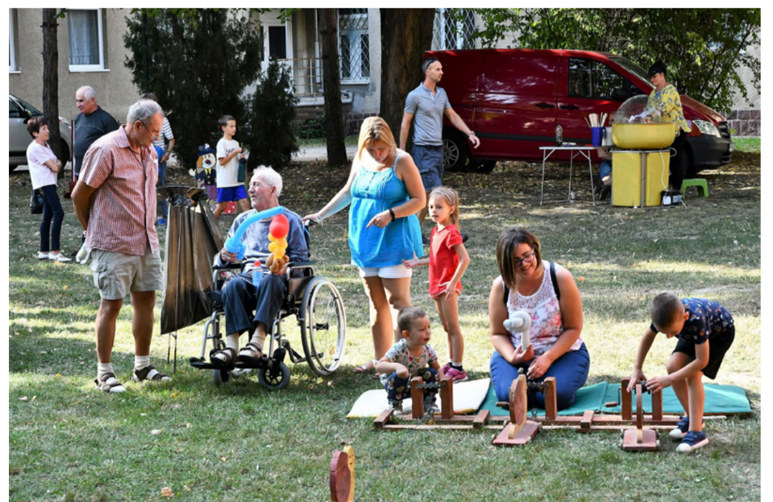
Közös játék, közös élmények

A kulturális programban is három generáció mutatkozott be. A Vízikék és a Zöldikék óvoda Csoszantók tehetségműhelyének tagjai népi gyermekjátékokat mutattak be, majd a bentlakók adták elő műsorukat, valamint az Orfeum Operett Musical Társulat tagjai énekeltek vidám, közismert dalokat.