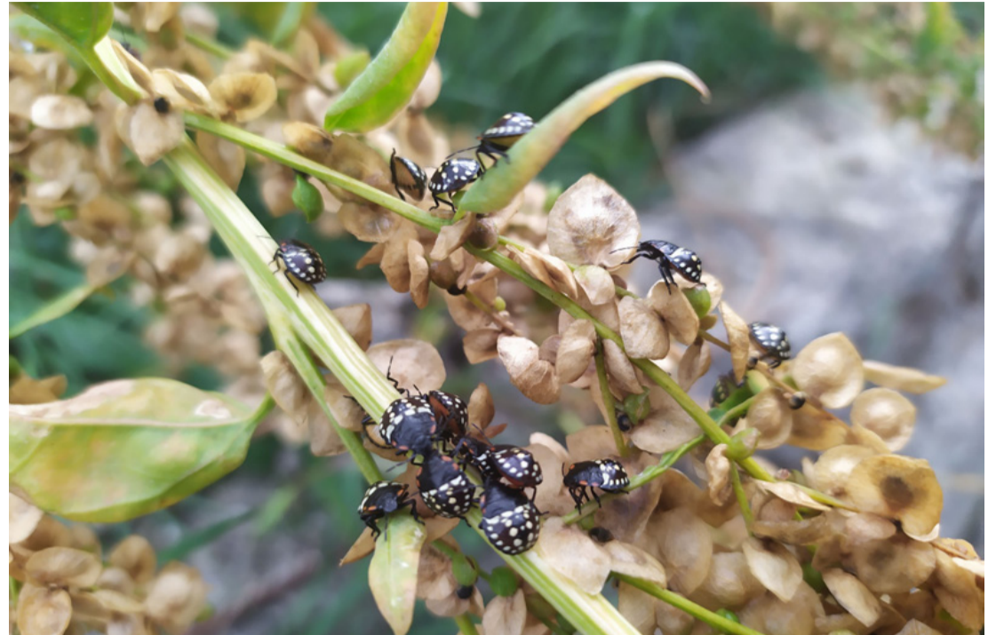
Olyan csúnyák, hogy már szinte szépek